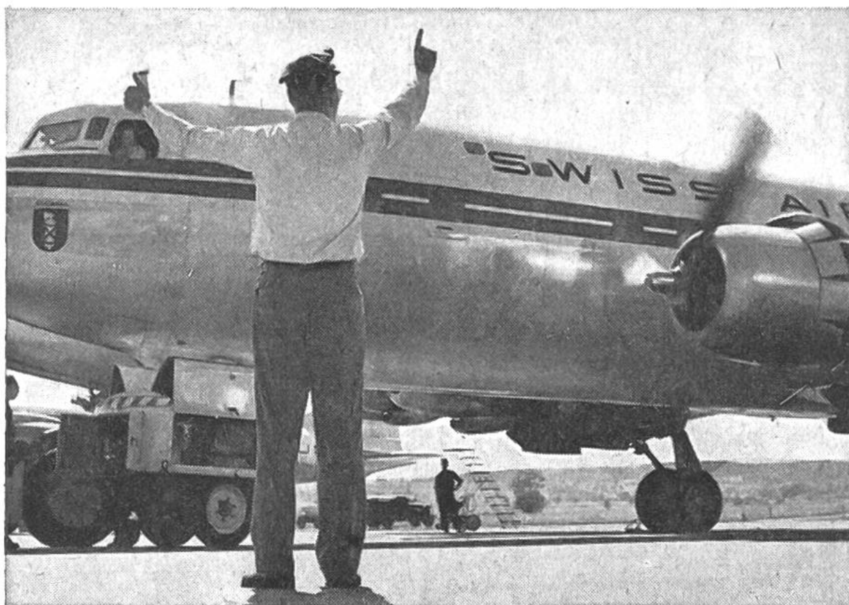
Die Motoren werden vor dem Wegrollen auf die Piste nach besonderen Anweisungen und unter Kontrolle angelassen.

sation gewährleistet einen zuverlässig und reibungslos funktionierenden Betrieb. Ausser der zentralen Leitung: Direktionspräsidium – Planungsdienst – Generalsekretariat – Zentraler Personaldienst – bestehen vier Departemente: Finanzen – Verkehr und Verkauf – Operation – Technik, ferner die Direktion für die Westschweiz.