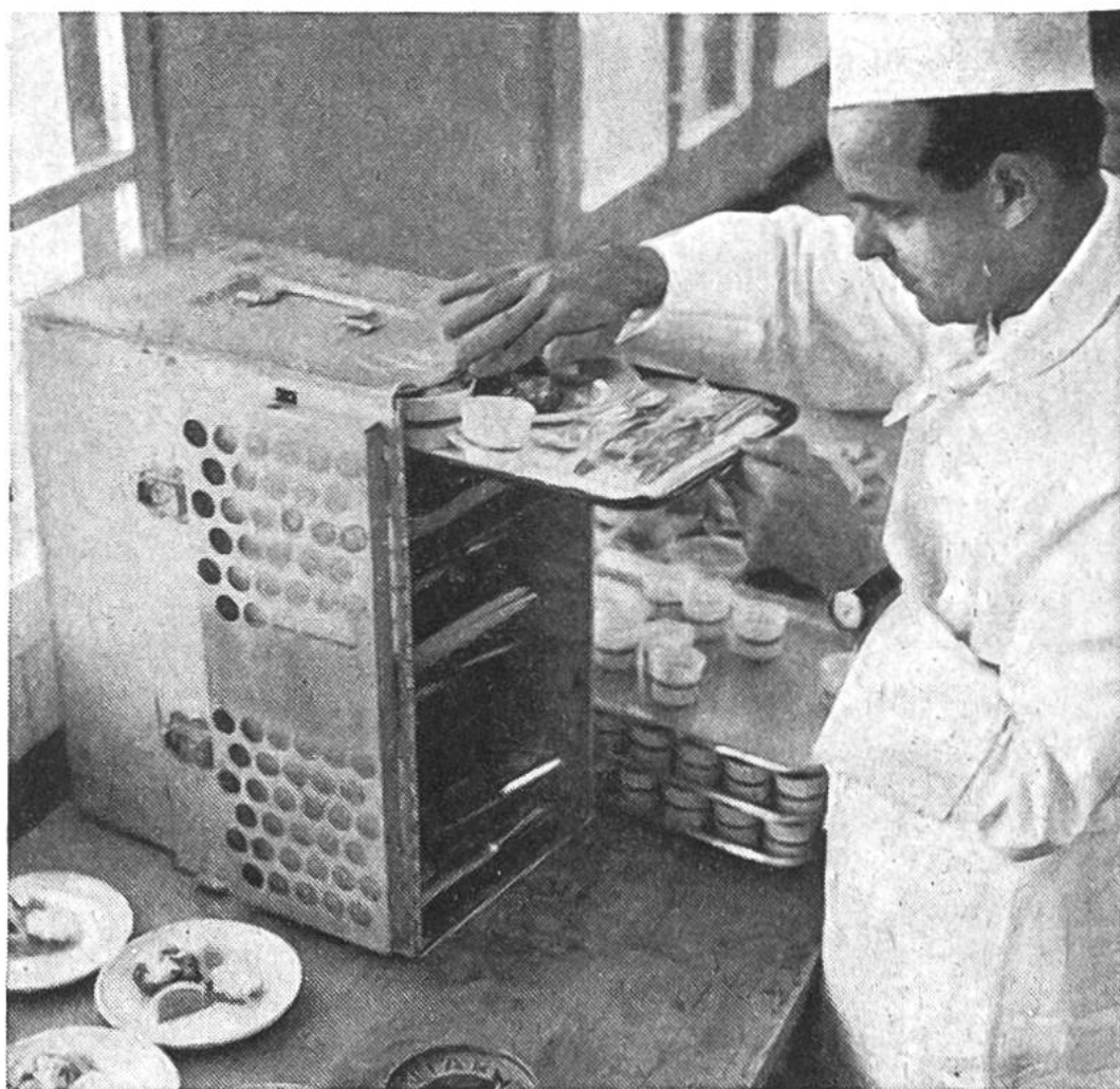
Die in der Flughafenküche zubereiteten Mahlzeiten werden nachher im Flugzeug den Gästen serviert.

Jede Vertretung zählt unter ihren Mitarbeitern Schweizer und Einheimische.