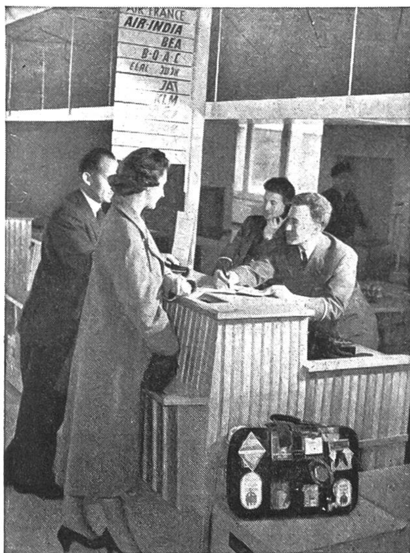
Kontrollieren der Flugscheine am Schalter vor dem Abflug und Abfertigung des Gepäcks.