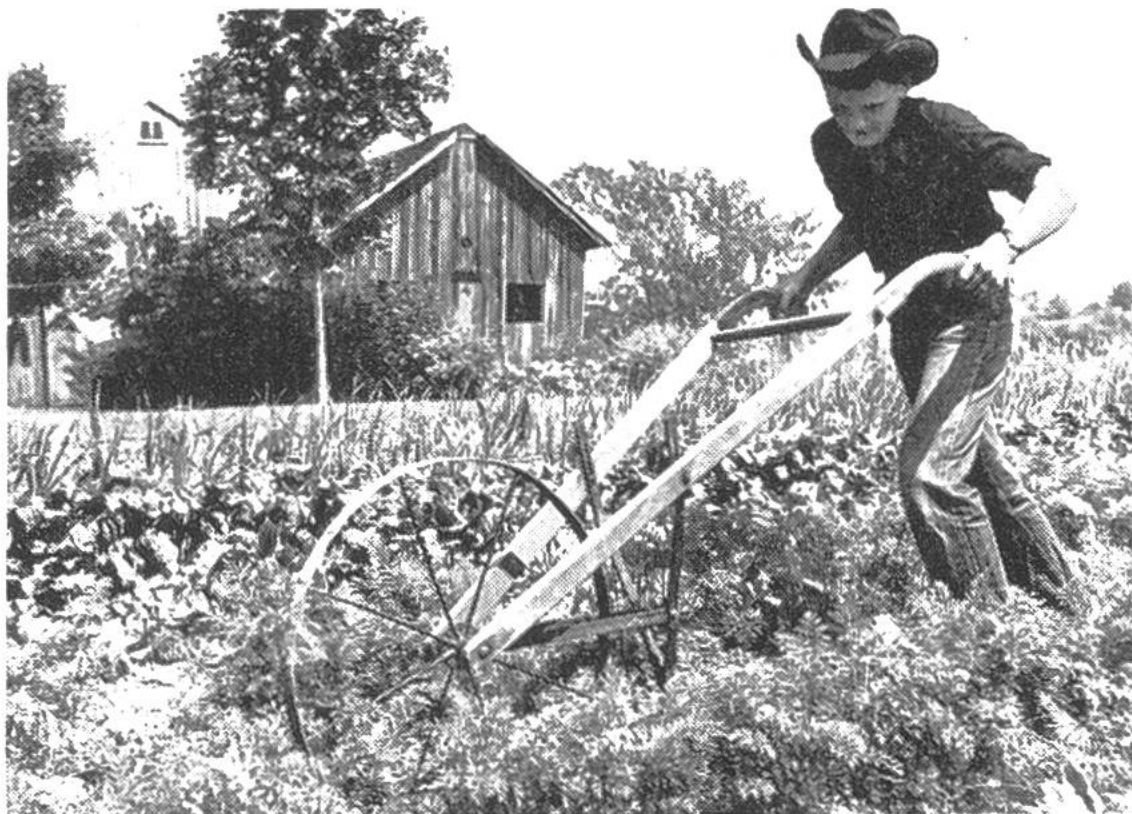
Mit dem Kultivator hackt der Farmerbub seine Rübli selbst.

Hauswirtschaft behandelt werden. Von Zeit zu Zeit gibt es sogar eigentliche Wettkämpfe, wobei sich für das beste, selbst aufgezogene Kalb, für die mit dem Traktorpflug am schönsten gezogenen Furchen oder für eine im Wettstreit unter Mädchen zubereitete Mahlzeit hübsche Preise gewinnen lassen. Diese Veranstaltungen spornen Buben und Mädchen dazu an, es womöglich auch einmal bis zum Preisträger, dessen Bild natürlich in der Landjugendzeitung erscheint, zu bringen. Verständige Eltern wissen den Wert der 4-H-Clubs zu schätzen und lassen ihre Jungen, auch wenn im Übereifer manchmal etwas in die Brüche geht, gerne gewähren.