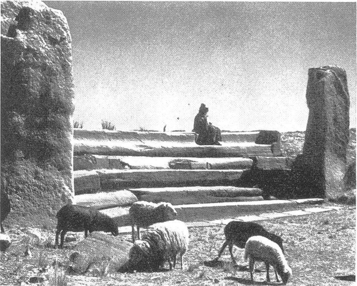
Steinerne Freitreppe aus der Vorinkazeit am Sonnentempel von Tihuanacu.

ter arbeiten, um in dem geheimnisreichen Buch ältester Vergangenheit zu lesen. – Wir zeigen auf unseren Bildern Reste des Sonnentempels Kalasasaya bei dem bolivianischen Dorf Tihuanacu. Einzelne Steine (Monolithe) der über 60 m langen Erkerwand des Sonnentempels wiegen mehr als 7000 kg. Wir wissen auch, dass der Steinbruch, aus dem man die Quadern mit Feuer aussprengte, 40 km vom Bauplatz entfernt liegt. Welch gewaltige menschliche Leistung spricht aus diesen Zahlen! Die grosse Freitreppe, vor der heute Schafe weiden, führte von der Ostseite zum Tempel hinan. Vielseitige Messungen der Forscher vereinigen ihre Zahlen zu einer Altersdatierung des Baues und errechnen ein Alter von ungefähr 17000 Jahren.