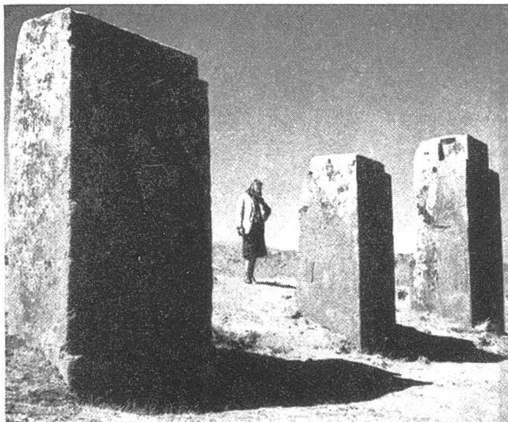
Mauerreste des gewalti- gen Tempels v. Tihuanacu.

dieses kostbare Tor wahrscheinlich gesprengt, da sie Gold in ihm vermuteten.