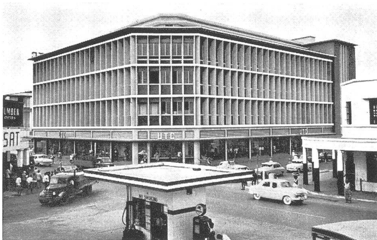
Das im Januar 1956 eröffnete hochmoderne Warenhaus der Basler Union Handels-Gesellschaft in Accra (Ghana).