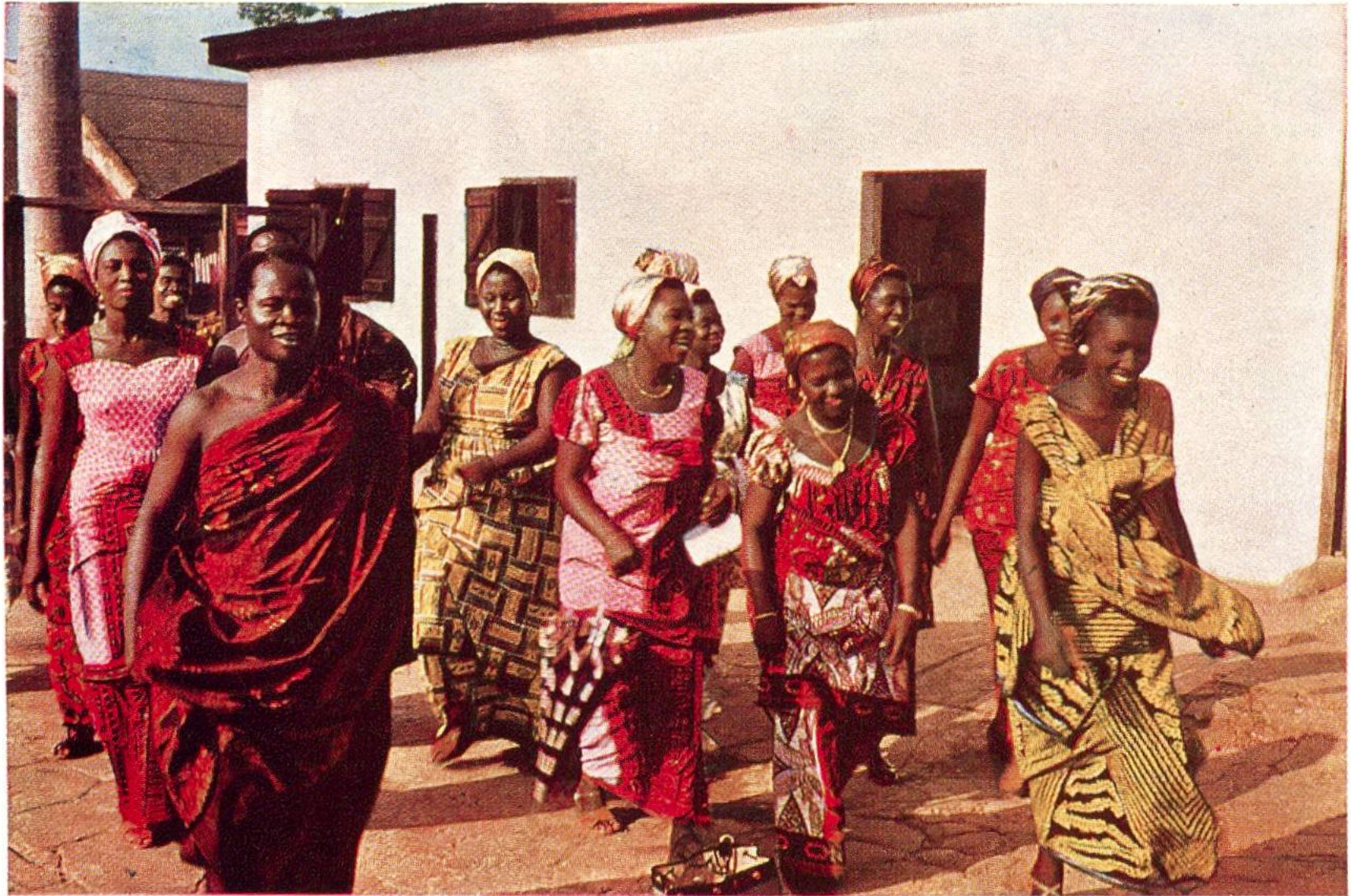
Eingeborene aus Kumasi, dem Hauptort von Ashanti (Ghana), in farbenfrohen Gewändern, die durch die Textildruckerei Hohlenstein AG. in Ennenda (Glarus) bedruckt worden sind. (Siehe auch Seite 246.)