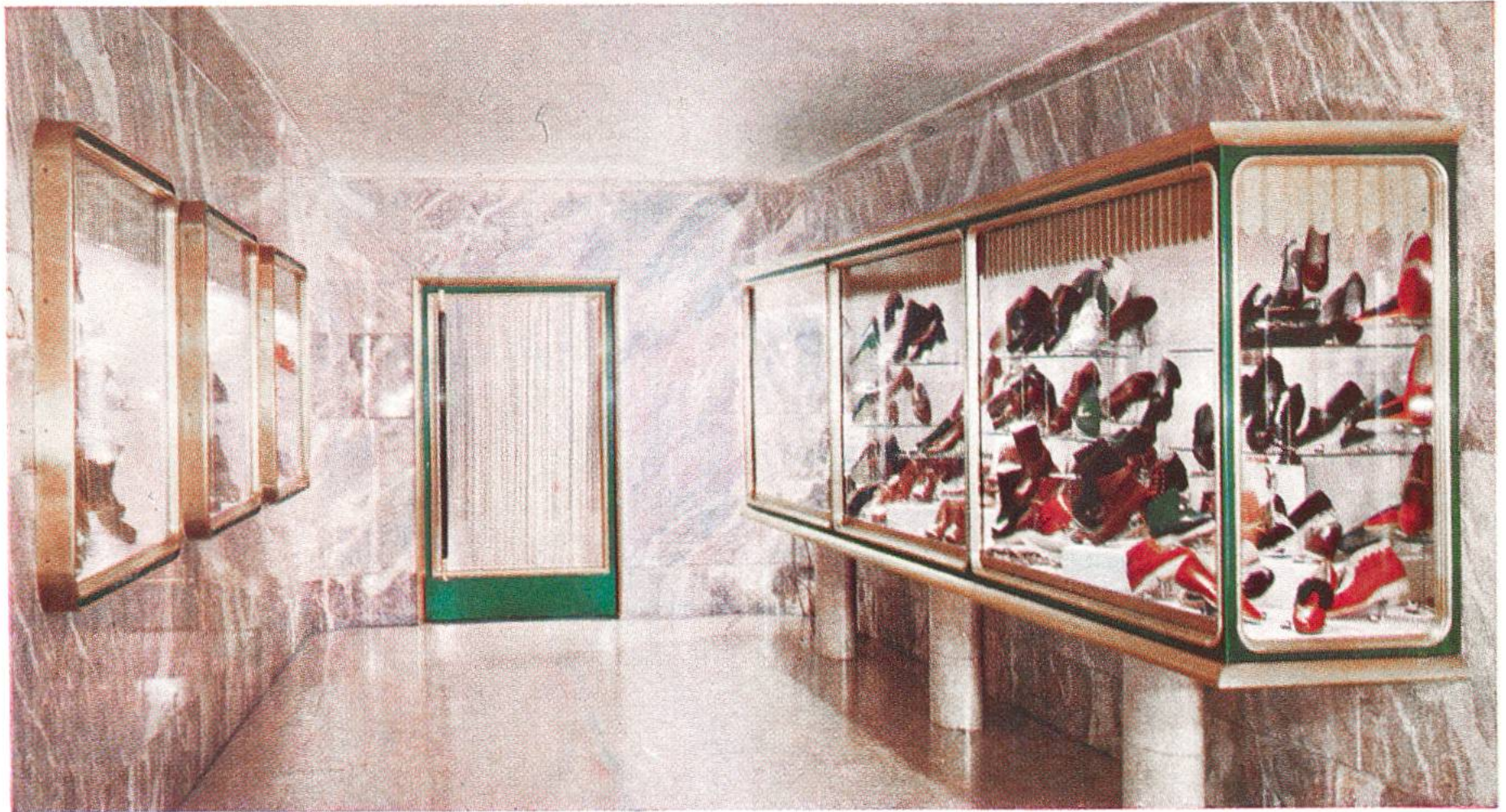
Farbig anodisierte Aluminium-Profile ergeben ein freundliches Schaufenster. (Siehe auch Seite 233.)