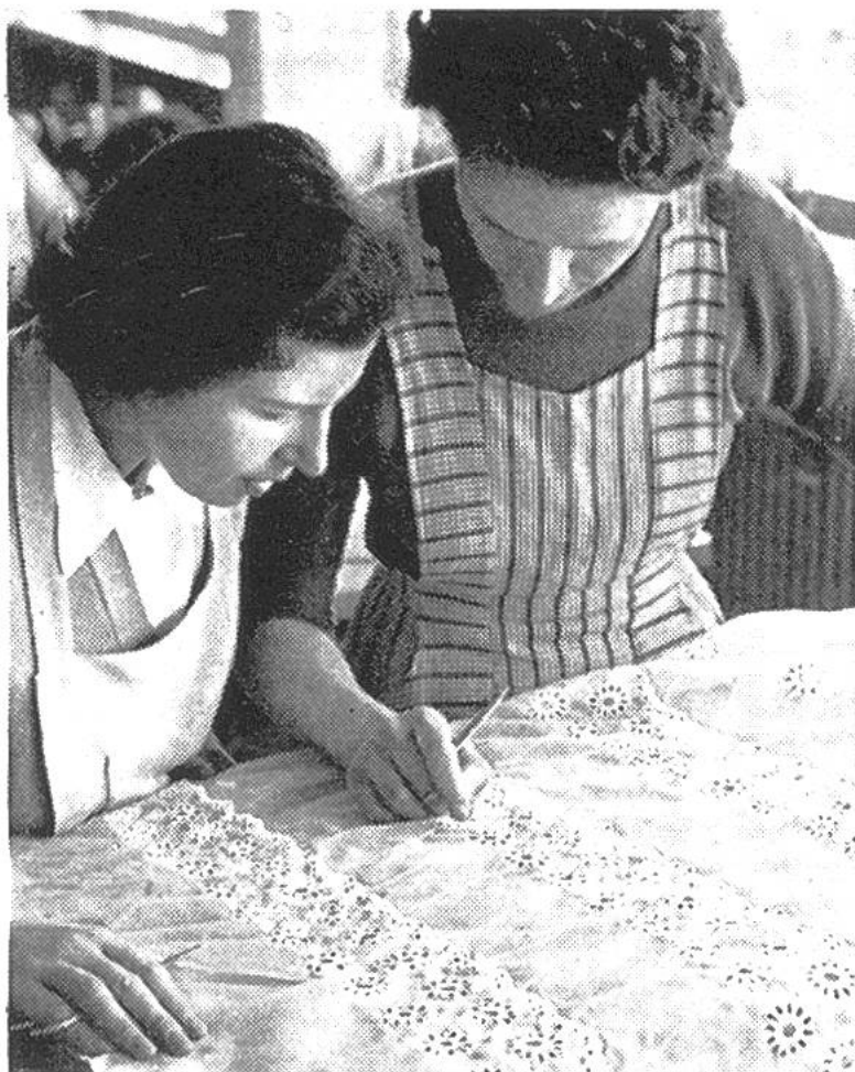
Stickereien, die aus der Maschine kommen, werden geprüft und liebevoll von Hand ausgebessert.

amerika als auch nach Asien, Afrika und Australien exportiert werden. Die Stickereien – darunter die bestickten Tüechli – erfreuen sich in England, in den Ländern des Commonwealth (Australien usw.) und in den USA grösster Beliebtheit, während die Baumwollstoffe vor allem in Deutschland, Italien, Skandinavien und auch in Amerika einen Begriff für beste Qualität und Mode, eine sympathische Visitenkarte unseres kleinen Landes darstellen.