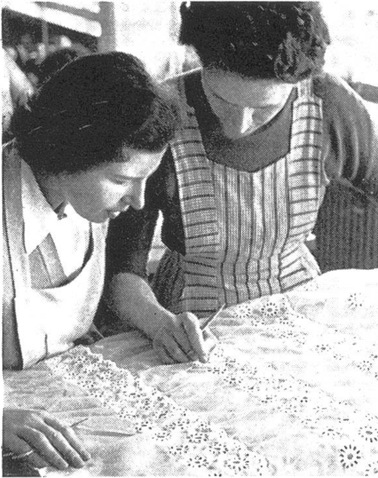
Stickereien, die aus der Maschine kommen, werden geprüft und liebevoll von Hand ausgebessert.

amerika als auch nach Asien, Afrika und Australien exportiert werden. Die Stickereien – darunter die bestickten Tüechli – erfreuen sich in England, in den Ländern des Commonwealth (Australien usw.) und in den USA grösster Beliebtheit, während die Baumwollstoffe vor allem in Deutschland, Italien, Skandinavien und auch in Amerika einen Begriff für beste Qualität und Mode, eine sympathische Visitenkarte unseres kleinen Landes darstellen.