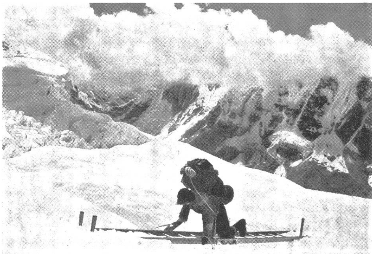
Aluminium-Leiter zum Überqueren einer Gletscherspalte (Khumbu-Eisbruch). Schweizer Mt.-Everest-Expedition 1956.

Die Qualität des Schweizer Aluminiums und seiner Legierungen sowie die Präzision seiner Halbfabrikate sind auch im Ausland bekannt, so dass die Produktion gut exportiert werden kann. – Der beispiellose Erfolg des Aluminiums beruht zum Teil auf seinen besonderen Materialeigenschaften. Dank seinem geringen spezifischen Gewicht von nur 2,7 wurde es der ideale Baustoff für Flugzeuge, Autos und Schnellboote. Auch die letzte schweizerische Mount-Everest-Expedition wusste sich diesen Vorteil zunutze zu machen. Seilwinden, Kochgerät, Kannen, Sauerstoffapparate und vieles mehr aus Aluminium ersparte manche Transportkiste. Dass Aluminiumlegierungen trotz ihrem leichten Gewicht auch sehr fest sein können, beweisen Brücken, Baugerüste, Lawinenverbauungen oder z.B. die Al-Pufferhülsen der SBB. Für einen Konstrukteur liegt das Verlockende darin, dass sich Aluminium fast zu jeder beliebigen Form verarbeiten lässt. Chippiser Profile gelangen in allen Variationen, vom Uhrengehäuse bis zum Balken für Schiffgerippe, in die Welt hinaus. Zu dünner Folie ausge-