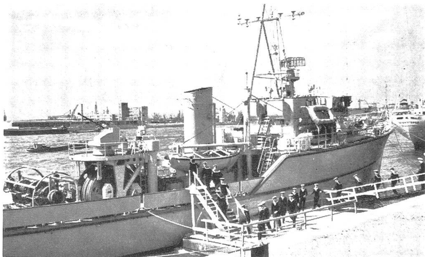
Antimagnetisches Minenräumboot der holländischen Marine. Es besteht fast zu 100% aus Schweizer Aluminium. Bei einem stählernen Boot würden die empfindlichen Instrumente einer Mine ansprechen und sie zum Explodieren bringen.

walzt, hält unser Aluminium die Schweizer Schokolade in jedem Klima frisch. Für Radiokondensatoren kann diese Folie bis zu der Dicke eines Spinnfadens (5/1000 mm) ausgewalzt werden. Wer kennt nicht die Hochspannungsleitungen, die als stolzes Symbol unserer einheimischen Naturkraft über Land und Berge ziehen? Auch sie bestehen fast alle aus Aluminiumseilen, die ausgezeichnete Elektrizitätsleiter sind. Aluminium rostet auch nicht, da es sich an der Luft sogleich mit einer schützenden Oxydschicht umgibt. Diese Schicht kann künstlich verstärkt, sogenannte anodisch oxydiert, und mit schillernden Farben imprägniert werden.