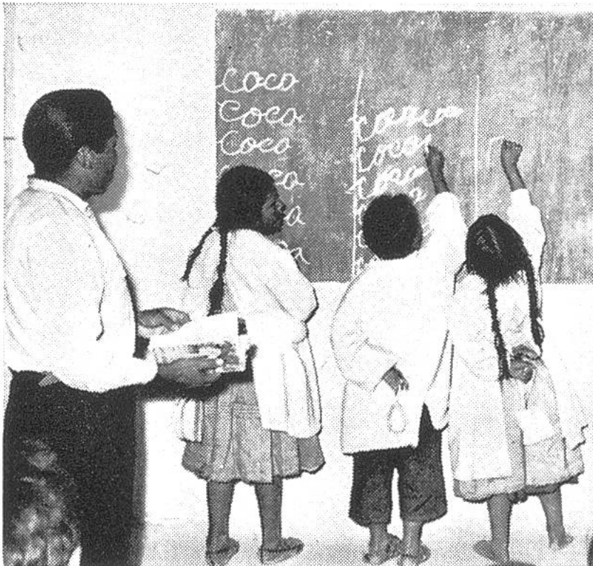
Der erste Schreibunterricht in einer Dorfschule in Bolivien. Was ist wohl «coco»? – Bestimmt ist es für die Wirtschaft des Landes wichtig!

gen der Unesco, jener internationalen Einrichtung, die sich um die Pflege und Förderung der Kultur in allen Erdteilen bemüht, gibt es noch heute auf der Welt rund 700 Millionen Menschen im