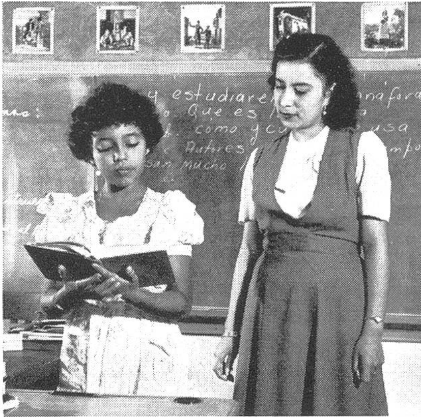
In einer spanischen Schule in San Juan (Puerto Rico, Mittelamerika).

gen der Unesco, jener internationalen Einrichtung, die sich um die Pflege und Förderung der Kultur in allen Erdteilen bemüht, gibt es noch heute auf der Welt rund 700 Millionen Menschen im