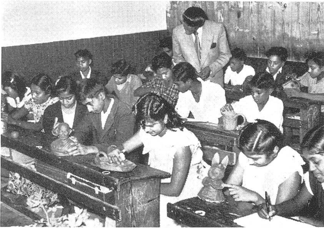
Eine indische Klasse in Südafrika bei der Werkarbeit, die das künstlerische Ausdrucksvermögen fördern soll. Ein Schüler hat die Büste Mahatma Ghandis modelliert.