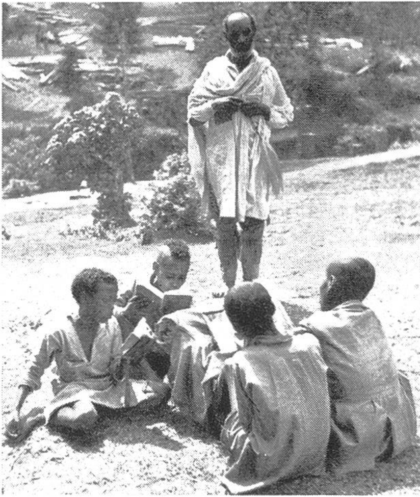
Eine Unterrichtsstunde unter freiem Himmel in Aethiopien.