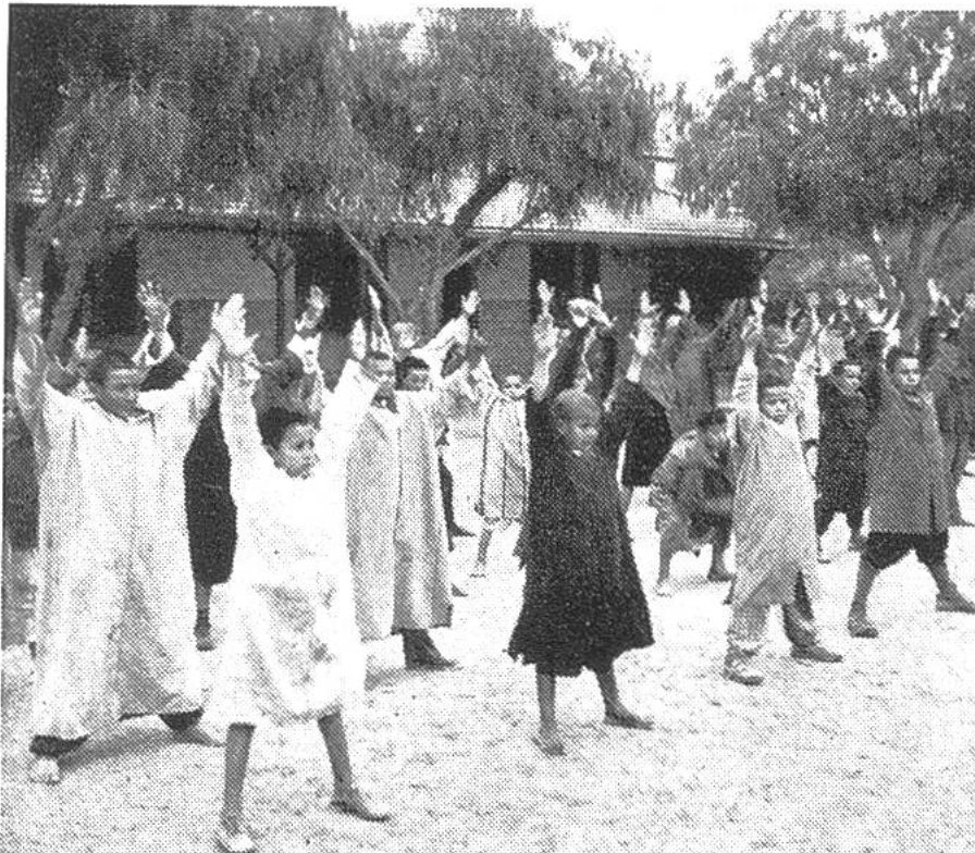
Gymnastik in einer französischen Schule in Marokko.