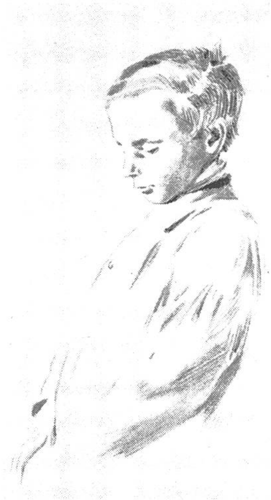
Skizze von Wilhelm Busch.

kommen kann und schliesslich von der Katze gefressen wird. Aber der Dichter Busch verzweifelt nicht. Sein Lachen und sein Humor überwinden die Macht der Welt – er singt (wie der Vogel auf dem Leim).