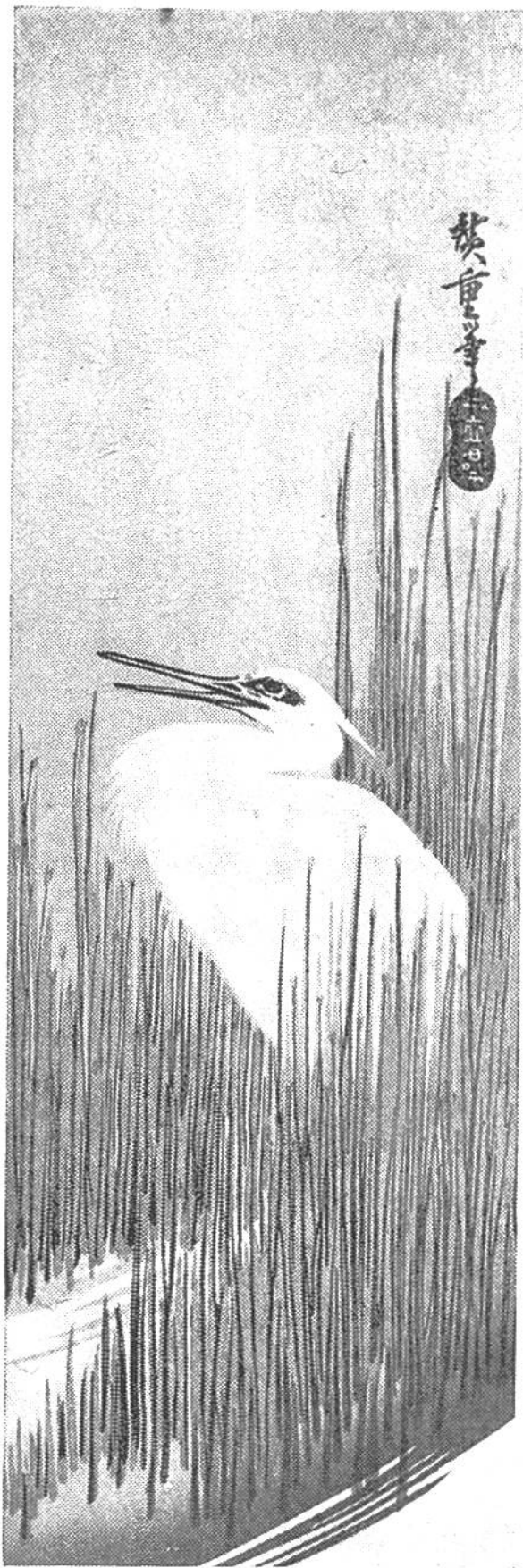
Reiher im Schilf.