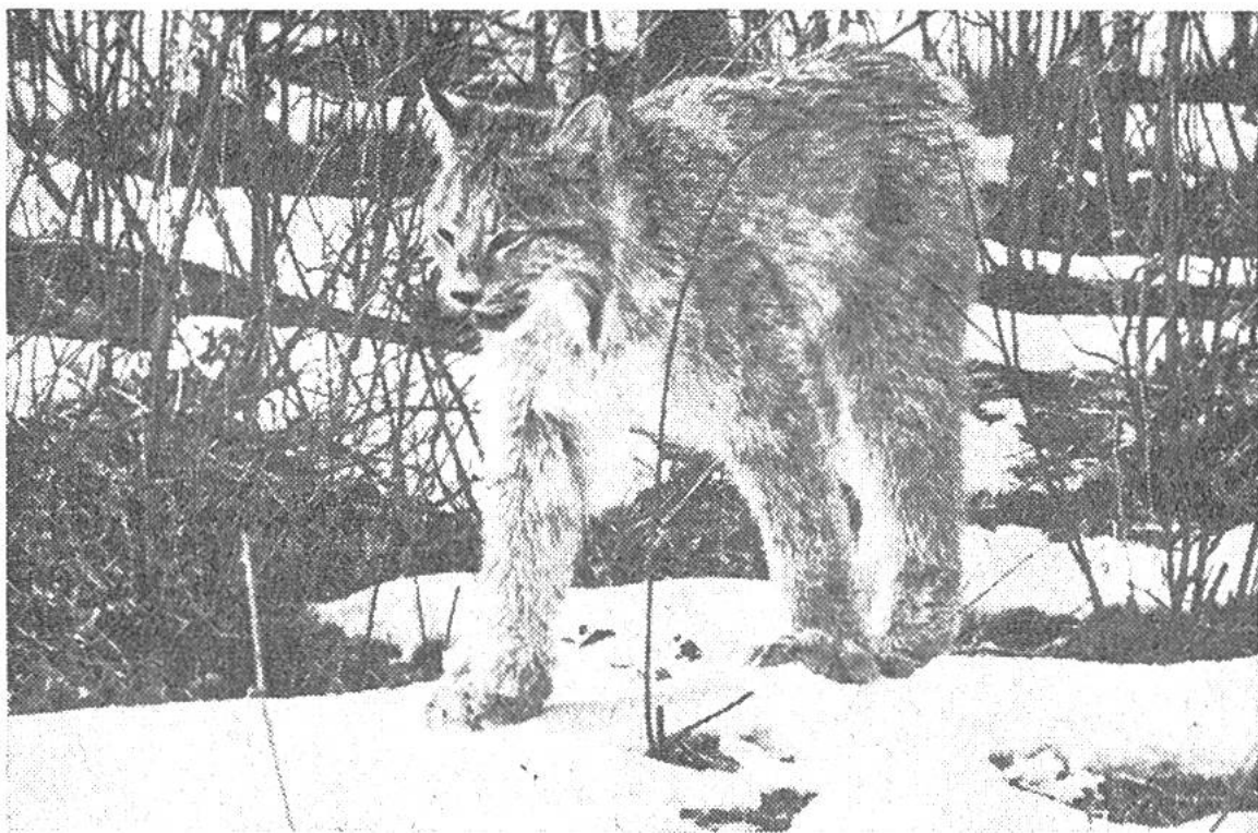
Im Winter tragen die kanadischen Luchse einen dicken, weichen Pelz.

Tierfreund die Mühe, junge Luchse mit der Flasche aufzuziehen und als zahme Hausgenossen zu halten. Da kann man seine helle Freude erleben, denn diese starken Katzen sind sehr sauber und zeigen sich gezähmt von der liebenswertesten Seite. Sogar Kinder können es sich dann erlauben, mit diesen hübschen und interessanten Raubtieren zu spielen.