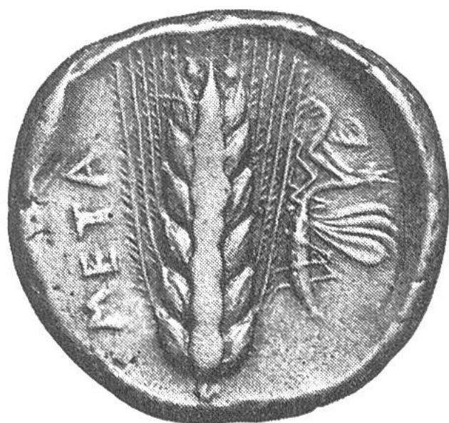
Gerstenähre auf Silbermünze, 380 v. Chr.

Metapont, die an der Ostküste Lukaniens gelegene Stadt, führte als Zeichen der Fruchtbarkeit ihrer Fluren eine Gerstenähre auf fast allen Münzen. Die auf dem Bild neben der Ähre sitzende Heuschrecke (eigentlich eine Gottesanbeterin) wird auf eine schlechte Ernte hinweisen (Heuschreckenplage).