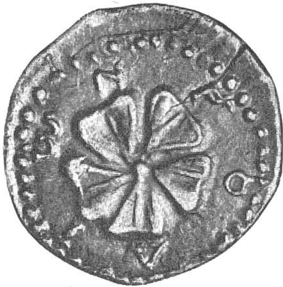
Rosenblüte auf einer Silbermünze der Insel Rhodos, geprägt um 80 v. Chr.

Die Rose war der Münztypus für Rhodos, denn diese Insel war früher die Hauptstätte des Helios-Kultes. Sie errichtete dem Gotte Helios den Koloss von Rhodos, bekannt als eines der sieben Weltwunder. Helios war der griechische Sonnengott, der alles sah und hörte. Die Rose erscheint daher auf den Münzen bald von oben und bald von der Seite. OPW