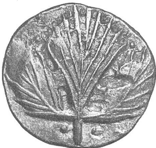
Silbermünze der Stadt Selinunt (Sizilien) mit einem Eppichblatt. Geprägt um 530 v. Chr.

Eigentliche Pflanzenbilder sind auf den Münzen des antiken Griechenland bedeutend seltener als Tierdarstellungen. In erster Linie finden wir Pflanzendarstellungen in Form von Kränzen oder Verzierungen des eigentlichen Münzbildes. Meist haben die wiederge-