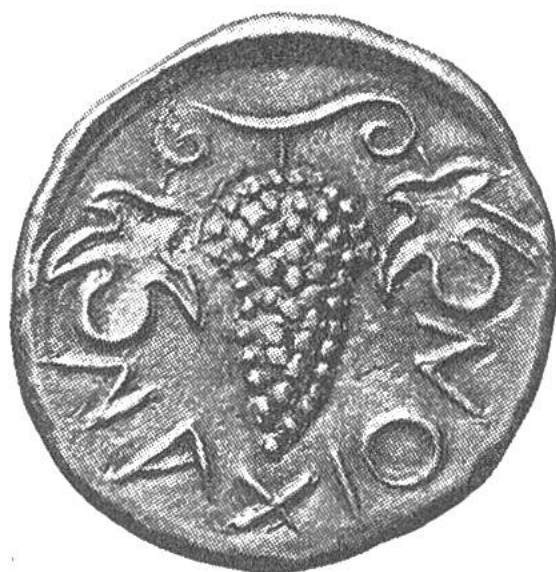
Silbermünze der sizilianischen Stadt Naxos mit einer Weintraube. Geprägt um 490 v. Chr.

gebenen Pflanzen geschichtliche Bedeutung oder weisen auf den Prägeort hin. Viele wurden auch als Heilpflanzen abgebildet. So war das Eppichblatt (Sellerie) das Wappen der Stadt Selinunt. Mit dieser Pflanze wurden im Altertum Grabsteine verziert, daher sagt man sprichwörtlich von einem Kranken: Er braucht Eppich, das heisst, er wird bald sterben.