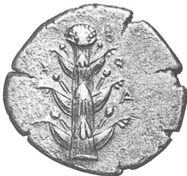
Um 350 v. Chr. geprägte Münze.

Der Granatapfel war für die Stadt Side in Pamphylien (südliches Kleinasien) das Wappenbild. Die Früchte bildeten im Altertum ein beliebtes Obst, wurden aber schon früh von der Orange verdrängt, die durch die Kriegszüge Alexanders bekannt wurde. Die besten Granatäpfel sollen bei Karthago gewachsen sein.