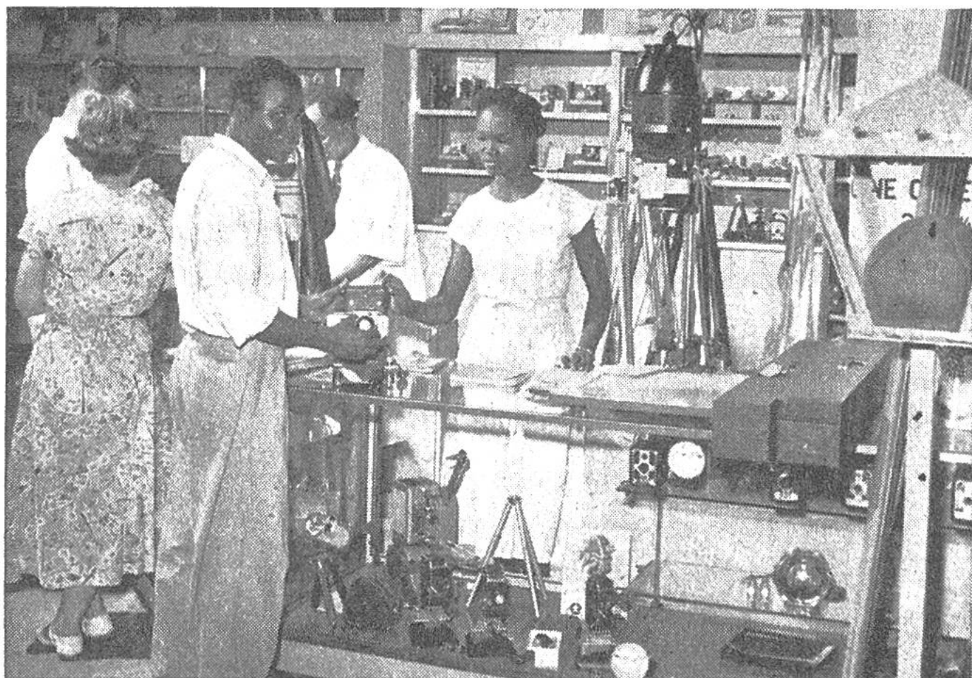
Im Warenhaus der Union Handels-Gesellschaft, Basel, in Legos (Nigeria) gelangen Photoapparate samt Zubehör zum Verkauf, die zum Teil von der Schweizer Firma Paillard stammen.

langen Weg nach Westafrika, dann aber auch beim Schritthalten mit der überaus starken Konkurrenz von Gütern aller Art aus den übrigen Ländern Europas, den Vereinigten Staaten von Amerika und Japan sind oft die schwierigsten Hindernisse zu überwinden. Glücklicherweise betätigen sich aber über ganz Westafrika zerstreut Schweizer aller Kantone als Kaufleute, welche, wenn immer möglich, die Erzeugnisse unserer eigenen Industrie zum Verkauf bringen. Wichtig ist, dass sich unsere Produkte dank ihrer vorzüglichen Qualität, trotz dem relativ hohen Preis, auch in jener tropischen Gegend grosser Nachfrage erfreuen. So war es bis heute stets möglich, dorthin Schweizer Waren zu exportieren.