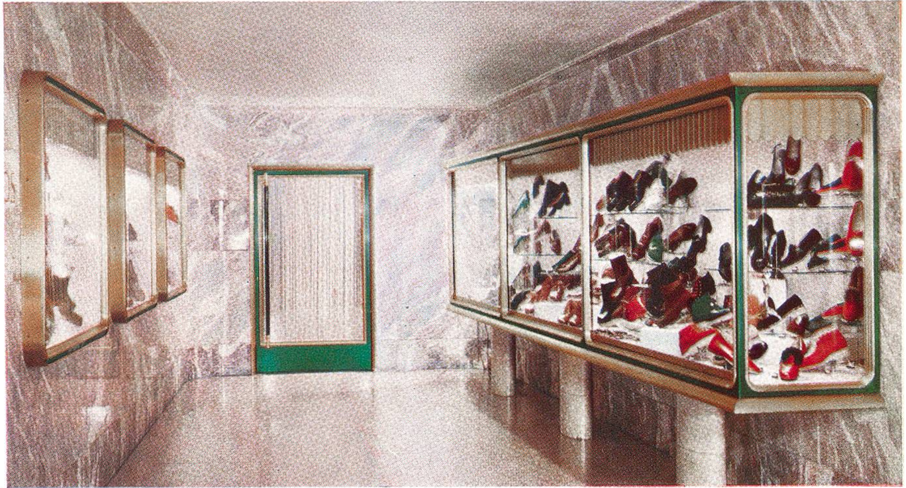
Farbig anodisierte Aluminium-Profile ergeben ein freundliches Schaufenster. (Siehe auch Seite 233.)