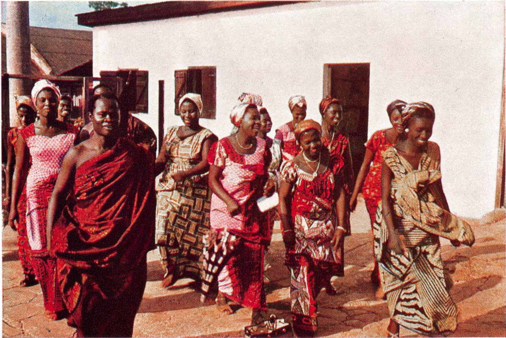
Eingeborene aus Kumasi, dem Hauptort von Ashanti (Ghana), in farbenfrohen Gewändern, die durch die Textildruckerei Hohlenstein AG. in Ennenda (Glarus) bedruckt worden sind. (Siehe auch Seite 246.)