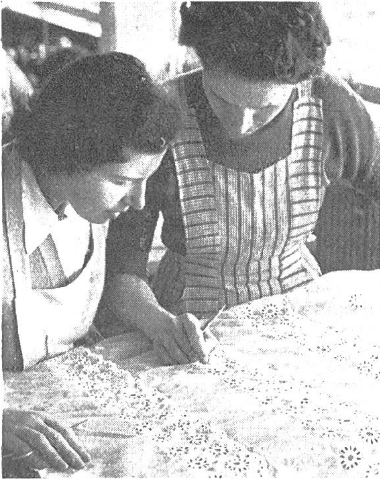
Stickereien, die aus der Maschine kommen, werden geprüft und liebevoll von Hand ausgebessert.

amerika als auch nach Asien, Afrika und Australien exportiert werden. Die Stickereien – darunter die bestickten Tüechli – erfreuen sich in England, in den Ländern des Commonwealth (Australien usw.) und in den USA grösster Beliebtheit, während die Baumwollstoffe vor allem in Deutschland, Italien, Skandinavien und auch in Amerika einen Begriff für beste Qualität und Mode, eine sympathische Visitenkarte unseres kleinen Landes darstellen. P. R.