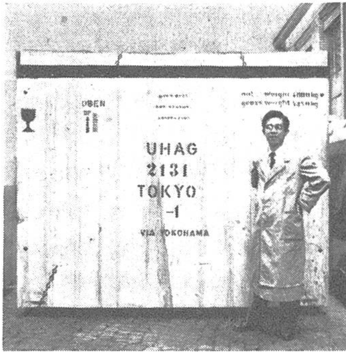
Der japanische Abnahmeingenieur der Übersee-Handel A.G. überwacht den Abtransport einer seemässig verpackten Zahnradschleifmaschine von Reishauer, Zürich.

europäischer Länder zum Opfer fallen könnten. Seitdem hat Japan in etwa 100 Jahren einen beispiellosen Aufschwung erlebt und steht seit Jahrzehnten als das Industrieland Nummer eins in Asien da. Japan hat mit Fleiss und trotz abwegigen kriegerischen Unternehmungen einen gewaltigen Vorsprung gegenüber allen andern Staaten Asiens gewonnen. Auch heute ist das Land bemüht, seine Industrie weiter auszubauen und zu verbessern.