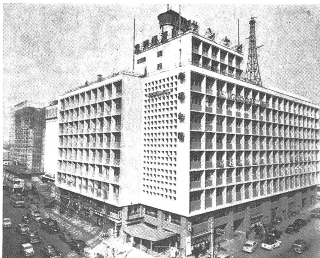
Das Sankei-Gebäude, eines der vielen modernen Geschäftshäuser von Tokio, in welchem die Zweigstelle der Übersee-Handel A.G. untergebracht ist.

Japan wollte während Jahrhunderten für sich allein sein und keine Beziehungen zum Ausland haben. Die eifrigen Versuche der Portugiesen und Spanier im 16. Jahrhundert, des Handels wegen in Japan Fuss zu fassen, hatten nur für knapp 60 Jahre Erfolg; seit 1612 war Japan wieder fast gänzlich vom Ausland abgeschlossen, bis die Amerikaner im Jahre 1853, gegen den Willen der Japaner, diese aus dem Dornröschenschlaf aufrüttelten und das Land für den Welthandel erschlossen. Die Japaner rieben sich die Augen und erkannten nun sofort, dass sie sich ohne die Technik, die in Europa während der Abgeschlossenheit Japans einen so grossen Fortschritt gemacht hatte, nicht auf der Weltbühne behaupten konnten und dass sie möglicherweise der Kolonialpolitik einiger