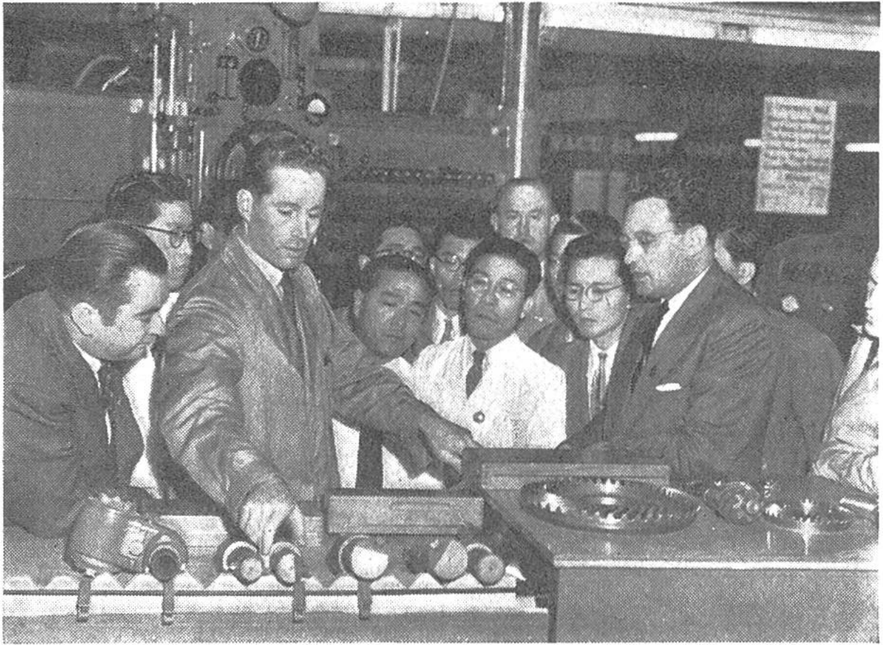
Schweizer Ingenieur in Tokio beim Erklären der Anwendung einer Verzahnungsmaschine der Werkzeugmaschinenfabrik Bührle, Oerlikon; rechts vorn: der Übersetzer.

an der unter anderem die neuesten Schweizer Maschinen von Fachleuten vorgeführt werden. Diese Messe besitzt, verglichen mit unsern Messen, eine besondere Note, die durch die eigenartige Kultur Japans bedingt ist. So sehen wir zum Beispiel als Wimpel schwarze und rote Riesenkarpfen mit vom Wind aufgeblähten Leibern an Fahnenstangen wehen. Junge Damen in prächtigen Kimonos und mit Blumenkörbchen wandeln gleichsam als Mannequins durch die breiten Strassen zwischen den Hallen.