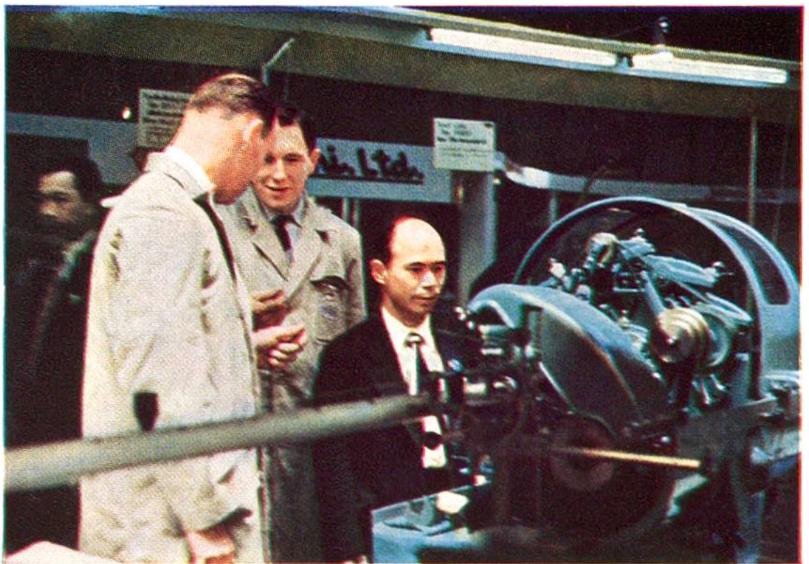
Schweizer Monteure erklären einem japanischen Interessenten einen Drehautomaten von Bechler, Moutier, in der Tokioter Ausstellungshalle. (Siehe auch Seite 229.)