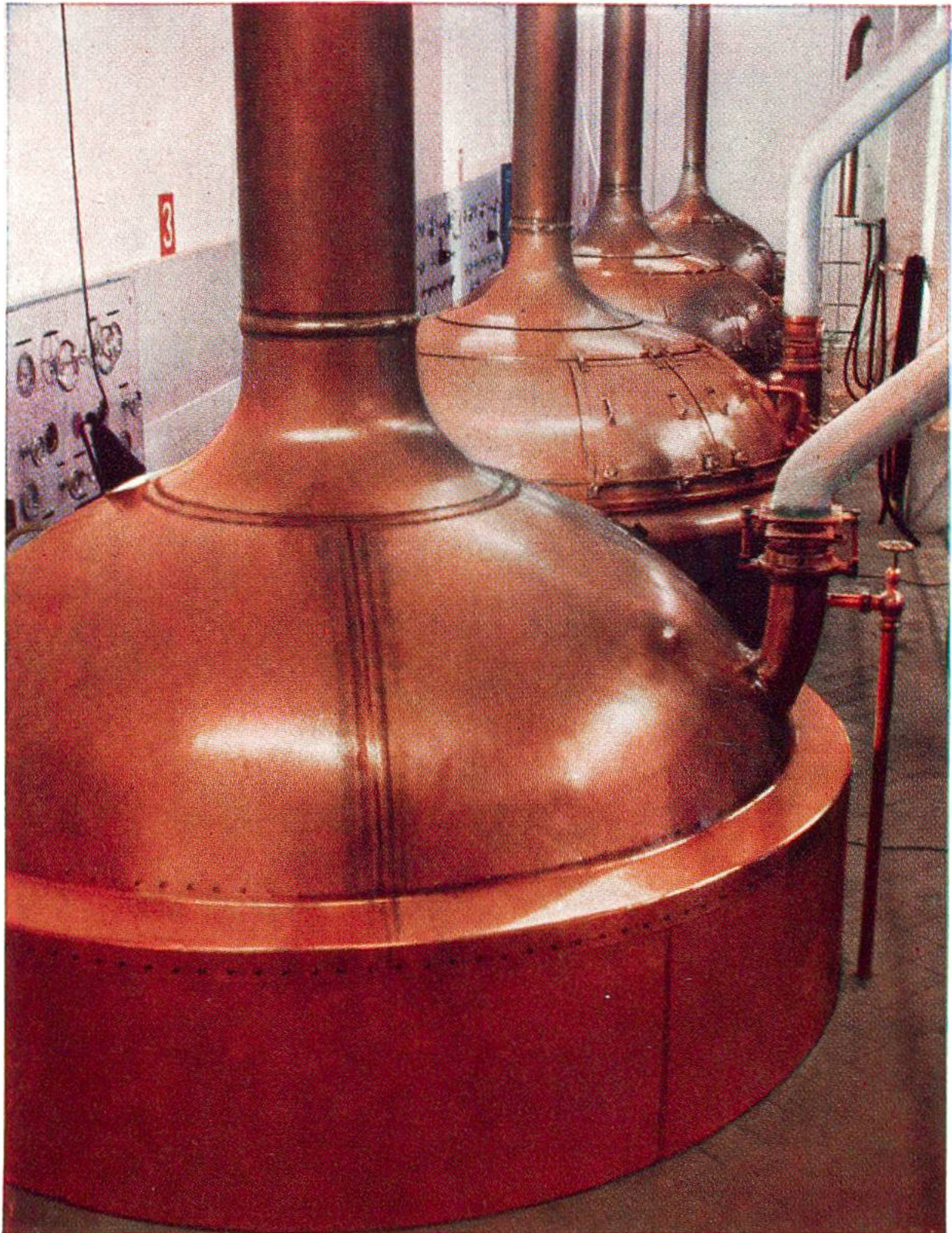
Maischbottiche für die Gewinnung der Malzwürze bei der Herstellung von Malzextrakt.