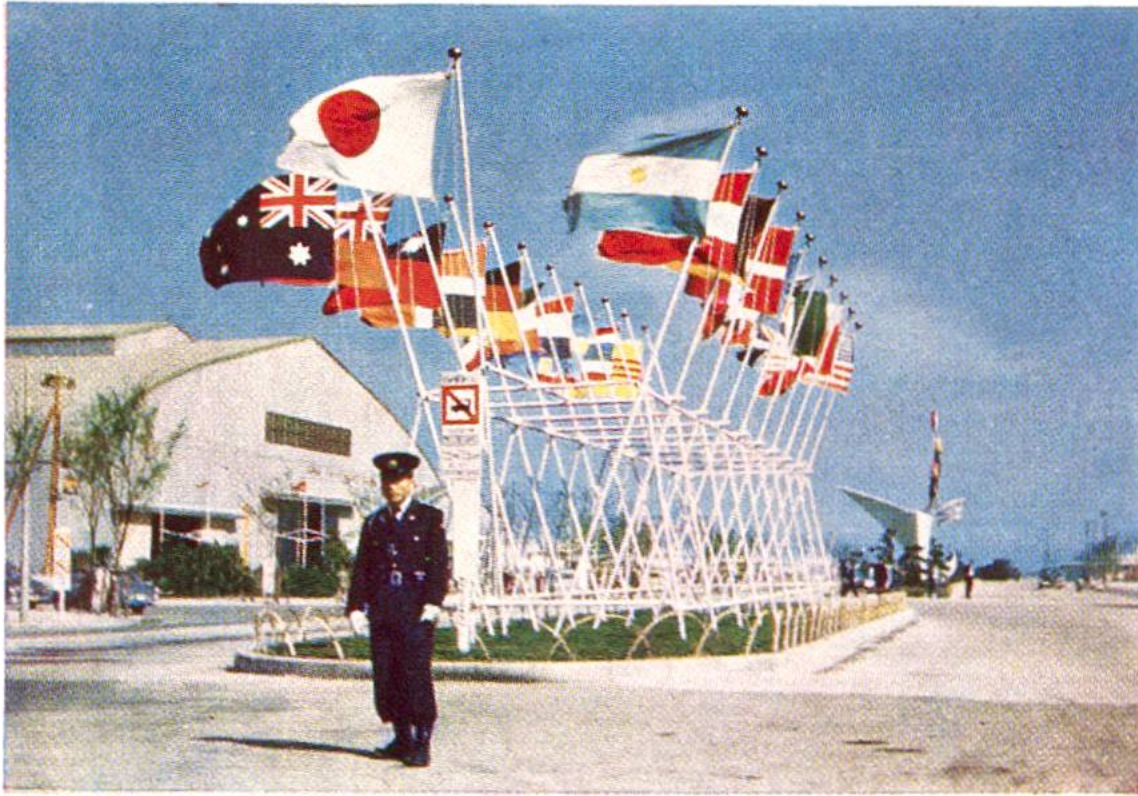
Am Messe-Eingang in Tokio wehen Flaggen vieler Nationen. Vorn: japanischer Polizist. Hintergrund links: die Haupthalle.