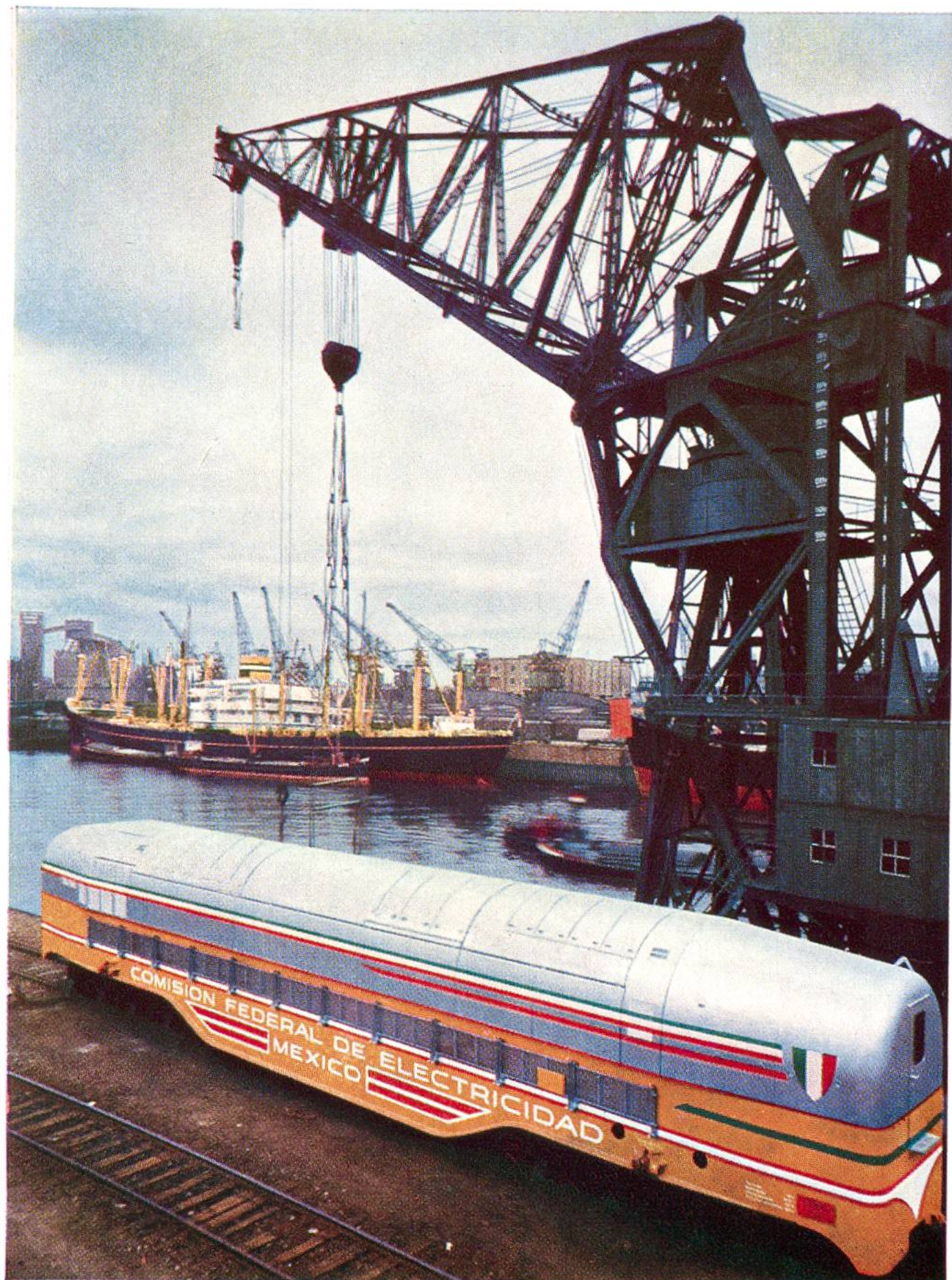
Einschiffung eines fahrbaren Brown Boveri Gasturbinen-Kraftwerkes (Wagen, der die Turbine und den elektrischen Generator enthält) in einem Nordseehafen zum Transport nach Mexiko. Solche Kraftstationen werden in Mexiko dort eingesetzt, wo dringender Mangel an elektrischer Energie herrscht.