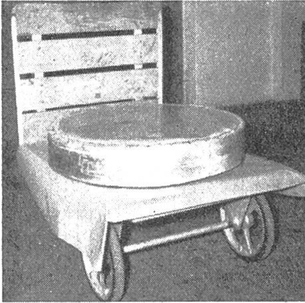
Ein in Zinkblech eingelöteter Exportkäse bereit zum Versand nach Übersee.

Sorge für gute Qualität, richtige Behandlung und fachgerechten Transport. Der Käsehändler kauft die Laibe meist in den gleichen Käsereien ein, oft bestehen diese Verbindungen seit Generationen. Regelmässig besucht er die Käser, wählt die Laibe aus, kauft ein und bringt auch ab und zu einen ausländischen Käufer mit, der sich an Ort und Stelle umsieht. Nach einigen Wochen oder Monaten sorgfältigster Pflege in den Käsereikellern holt der Händler die Käse ab und pflegt sie nun im eigenen Keller weiter, bis sie exportreif sind. In bestimmten Zeitabständen werden die schweren Laibe gekehrt, abgerieben, eingesalzen. Ab und zu entnimmt man ihnen mit der Sonde ein Stücklein zur Kontrolle. Sind die Laibe verkauft und versandbereit, so werden sie gereinigt und mit dem roten schweizerischen Markenzeichen versehen, das einzig die echten Schweizerkäse tragen dürfen. Die vom Kunden oder für ihn ausgelesene Ware wird dann je nach dem Bestimmungsort verpackt (für die Tropen gibt es zum Beispiel eine ganz besondere Verpackung aus Zinkblech, das verlötet wird).