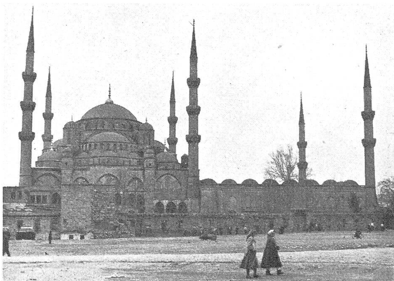
Die «Blaue Moschee» zu Istanbul (früher Byzanz) weist mit Ausnahme der Minarette die typischen Kuppelformen christlich-byzantinischen Baustils auf.