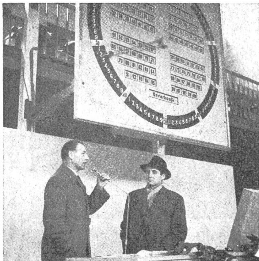
Die Versteigerungsur in Burgdorf zeigt aus- sen die Zahlen für die Preise, innen die Num- mern der Käufer.

In der Schweiz ist eine derartige Versteigerung für Obst und Gemüse «über die Uhr» zum erstenmal im Herbst 1956 in Burgdorf durchgeführt worden. Der Erfolg war so gut, dass die Einführung dieser Methode für 1957 beschlossen wurde. Für Blumen hat sich jedoch vorläufig ein anderes Verkaufssystem auf genossenschaftlicher Grundlage, die «Blumenbörse» in Zürich, als zweckmässiger erwiesen.