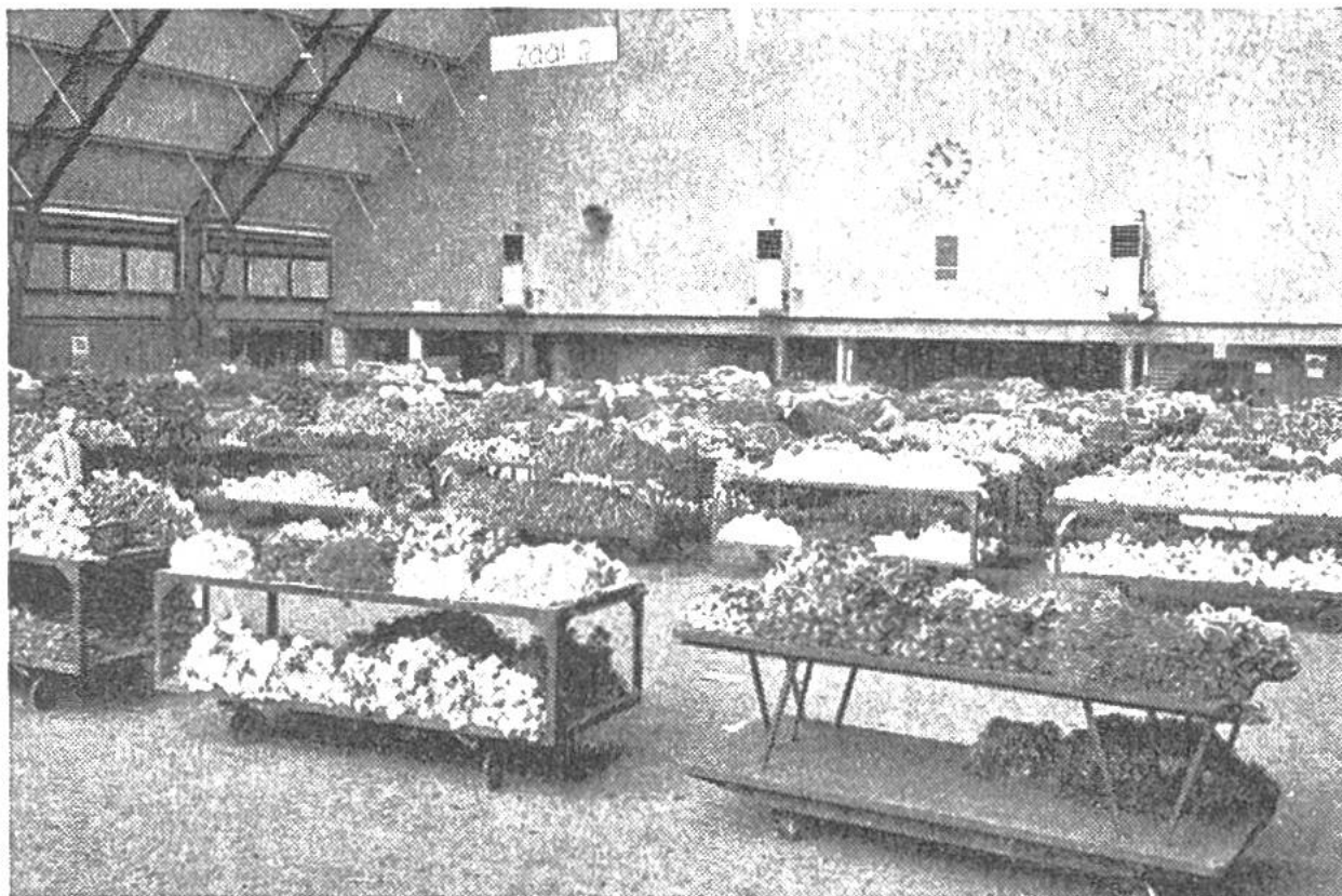
In einer der fünf grossen Hallen von Aalsmeer (Holland) sind die Schnittblumen auf fahrbaren Tischen zur Besichtigung aufgestellt.

sich gegenüber der Tribüne befindet, setzt sich in Bewegung, indem er erst einen überdurchschnittlich hohen Preis anzeigt und dann absinkt. Sobald ein Käufer die Ware zu dem gerade angezeigten Preis kaufen möchte, drückt er auf den Knopf an seinem Platz, die Uhr bleibt stehen und die Nummer des Käufers leuchtet auf. Die Uhr reagiert auf einen Unterschied von nur \frac{1}{20} Sekunde, so dass die Gefahr praktisch ausgeschaltet ist, dass zwei Käufer zur genau gleichen Zeit auf den Knopf drücken. Würde der Käufer noch länger zuwarten, so könnte er die Ware billiger erhalten, riskiert jedoch, dass ihm ein anderer Käufer zuvor kommt und er infolgedessen leer ausgeht. Die Ware muss meistens bar bezahlt und sofort mitgenommen oder weggeschickt werden.