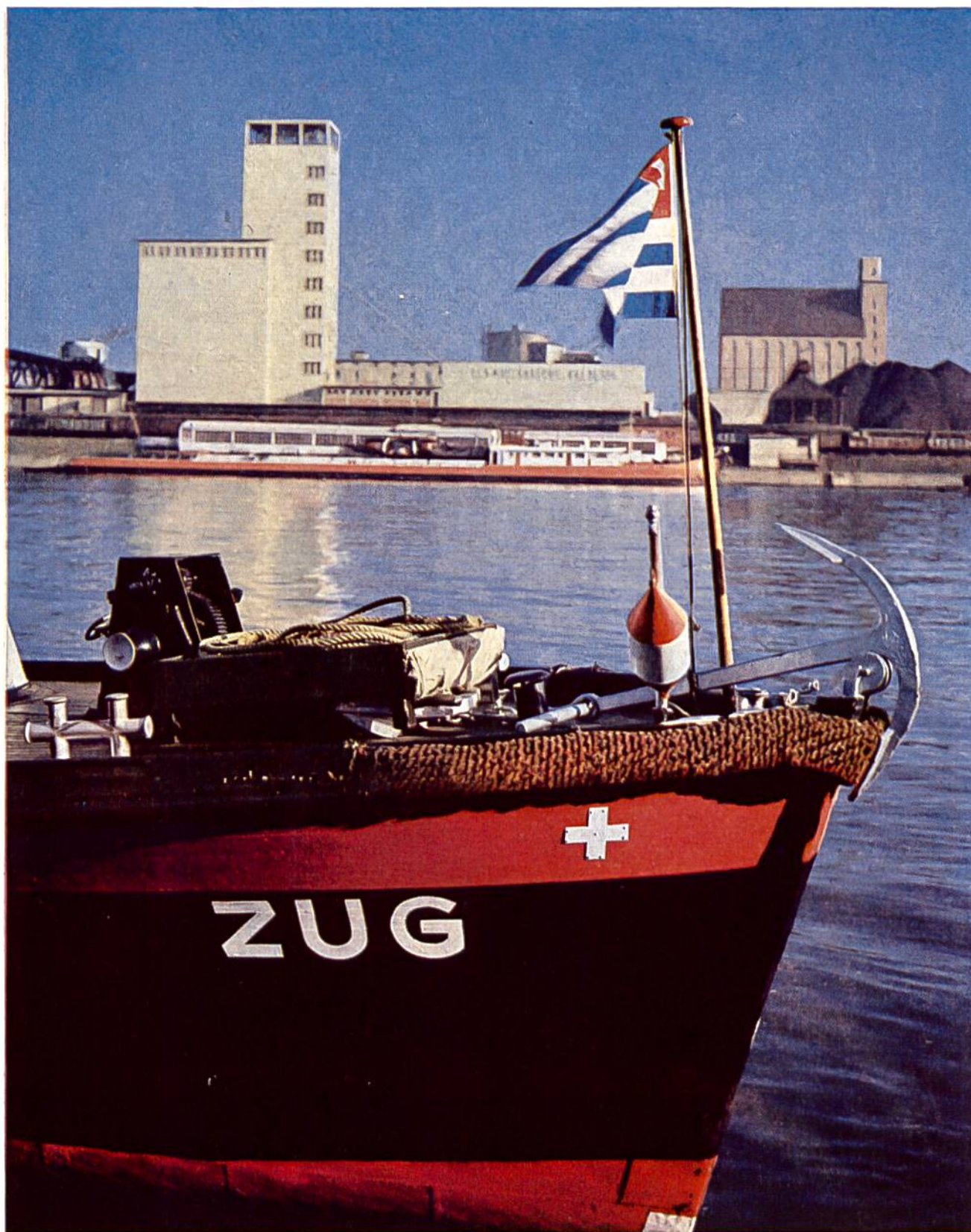
Bug des Hafenschleppers ZUG, welcher die Frachtschiffe im Basler Rheinhafengebiet von einer Umschlagstelle zur andern verbringt. Im Hintergrund: Dieselschlepper URI und zwei Getreidesilos, von denen jeder 16 000 t Getreide fasst. Rechts: Berge von Kohlen, die im Hafen eingelagert sind, bis sie vom Verbraucher in der Schweiz benötigt werden.