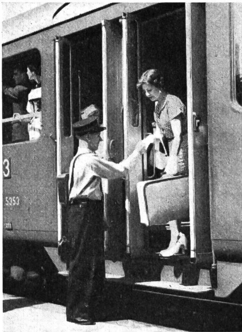
Die helfende Hand des Kondukteurs – ein vertrautes Bild.

Sehr große Bahnhöfe, welche mehr als 13000 Verkehrspunkte aufweisen, tragen die Bezeichnung Bahnhofinspektion . Einige Beispiele: Basel SBB (73281 Verkehrspunkte), Zürich (71 473), Bern (32 167), Genève-Cornavin (22 092), Lausanne (16 163). Der Bahnhofinspektor Zürich ist Chef von 2200 Beamten und Angestellten.