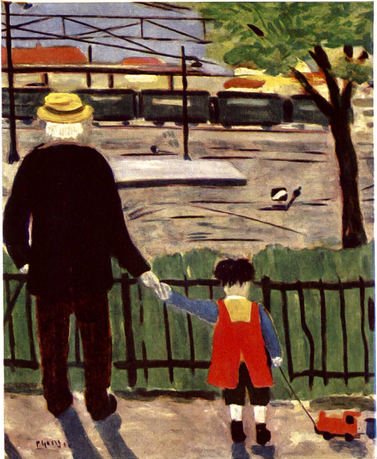
Der Pensionierte, von Paul Gross. (Paul Gross ist von Beruf Rangierarbeiter und malt in seiner freien Zeit als Amateur.)