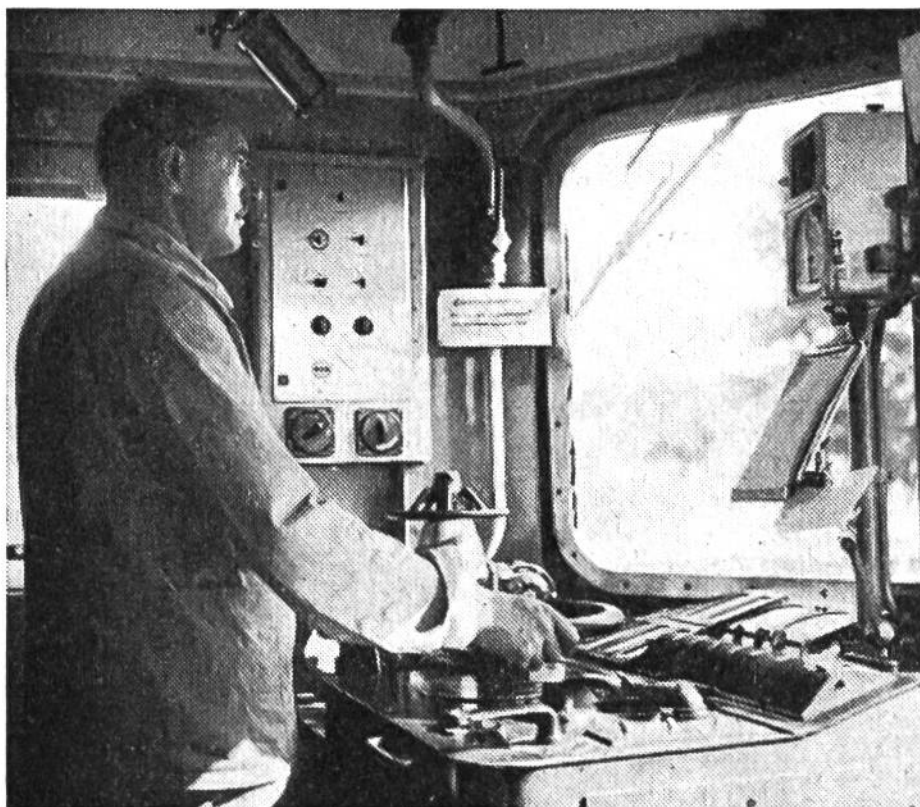
Die Hand am Steuer, den Blick auf die vorbeifliegenden Signale gerichtet – so beherrscht der Lokomotivführer die Lokomotive.

(2152 Verkehrspunkte), Martigny (2396), Lugano (5736), Arth-Goldau (5829), Rorschach (7386) und Aarau SBB (11 776).