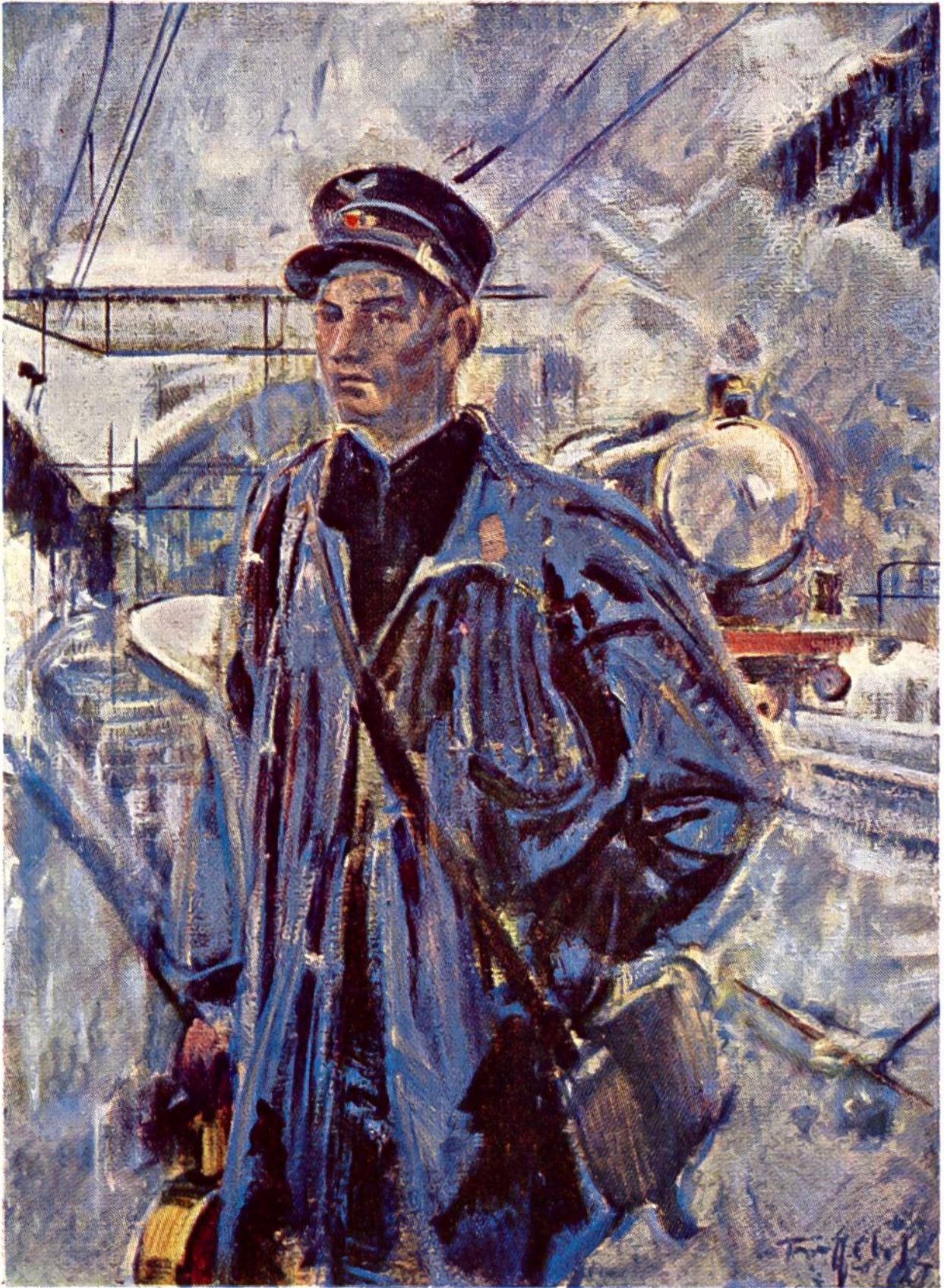
Der Kondukteur, Gemälde von Friedrich Traffelet, 1897–1954, Bern.