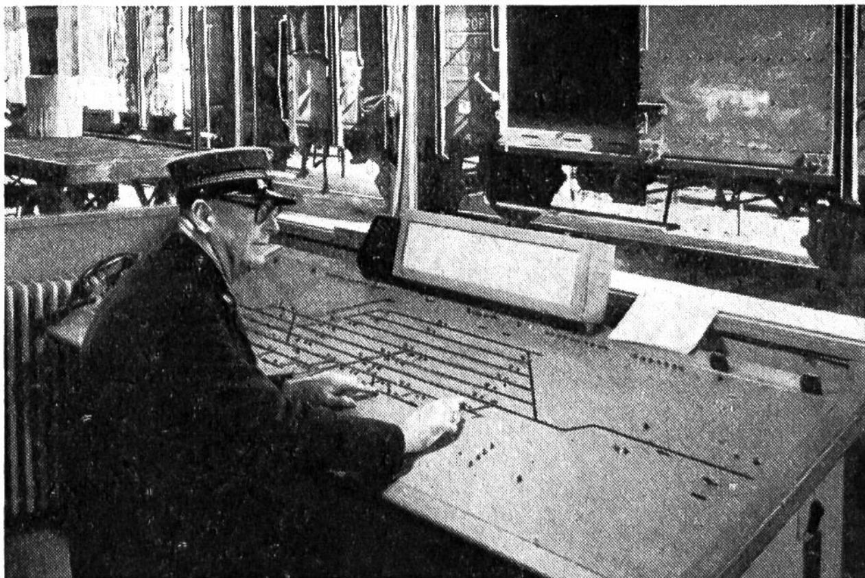
Ein Souschef bedient sitzend das neue elektrische Pult-Stellwerk eines kleineren Bahnhofes.