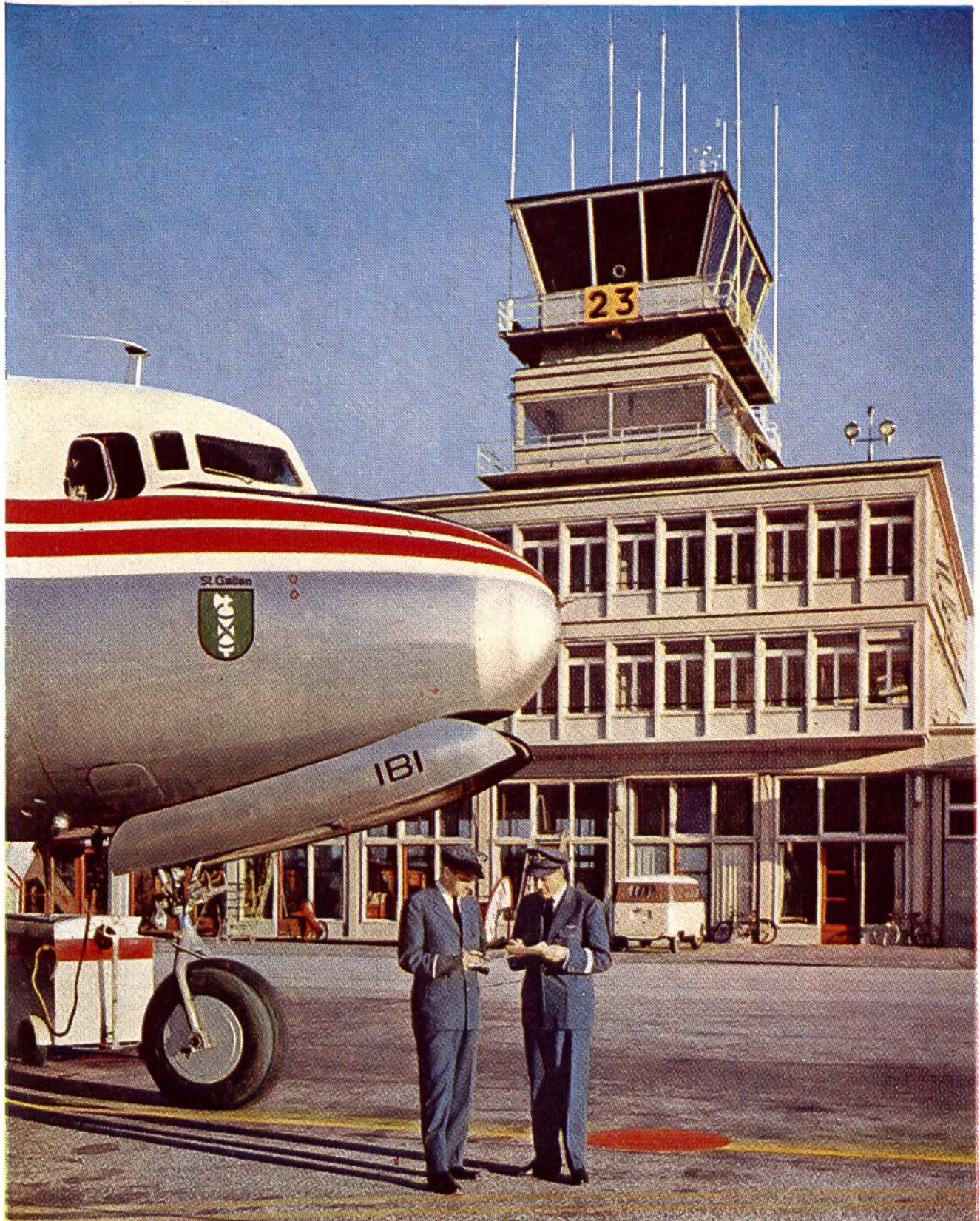
Ein DC-6 B der Swissair in Genf-Cointrin vor seinem Abflug. Diese Maschinen dienen dem Langstreckenverkehr. Der Flight Simulator ist eine genaue Nachbildung des DC-6 B (siehe Seite 229).