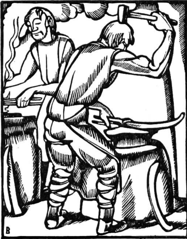
Schmieden, ein neues Gewerbe der älteren Eisenzeit.