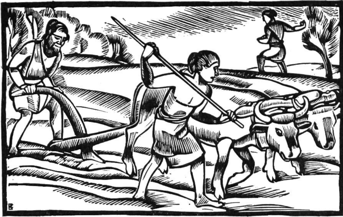
Jungsteinzeitliche Bauern pflügen ein Feld.