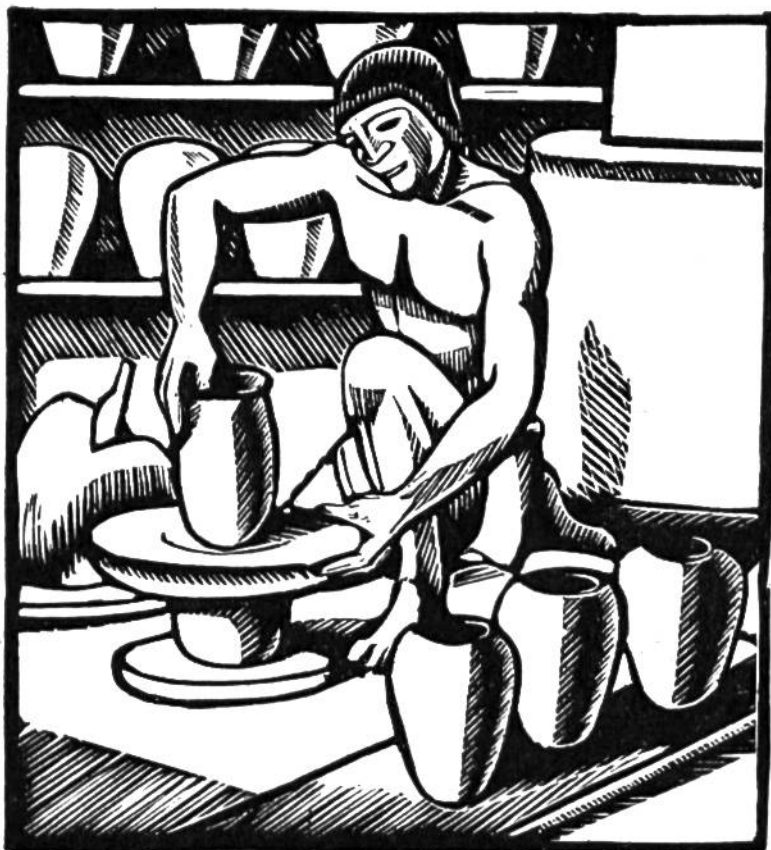
Die Töpferscheibe wurde bei uns erst während der jüngeren Eisenzeit bekannt.

fen, Wagen- und Pferdegeschirrbestandteilen – versehenen Toten, scheinen Fürstengeschlechtern zu entstammen. Dies deutet darauf hin, dass einzelne Familien zu Macht, Reichtum und Ansehen gelangt waren.