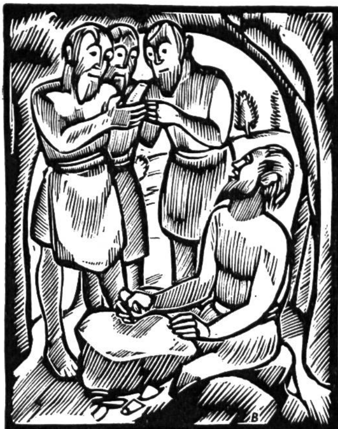
Höhlenbewohner der unteren Altsteinzeit bei der Herstellung von Steingeräten.

stösse in den Kälteperioden des Eiszeitalters verursachten. Man bezeichnet diesen ersten Abschnitt der Menschheitsgeschichte als Altsteinzeit und teilt ihn in zwei Abschnitte ein.