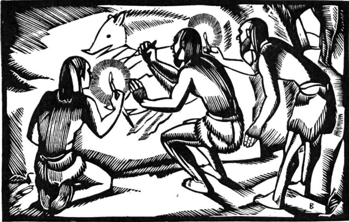
Jäger der oberen Altsteinzeit beim Zeichnen von Tierbildern im Innern einer Höhle.

von Höhlen ausgeführte Tierdarstellungen, die wohl vor allem dem Jagdzauber dienten.