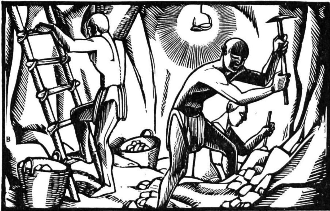
Im Innern eines bronzezeitlichen Bergwerkes.