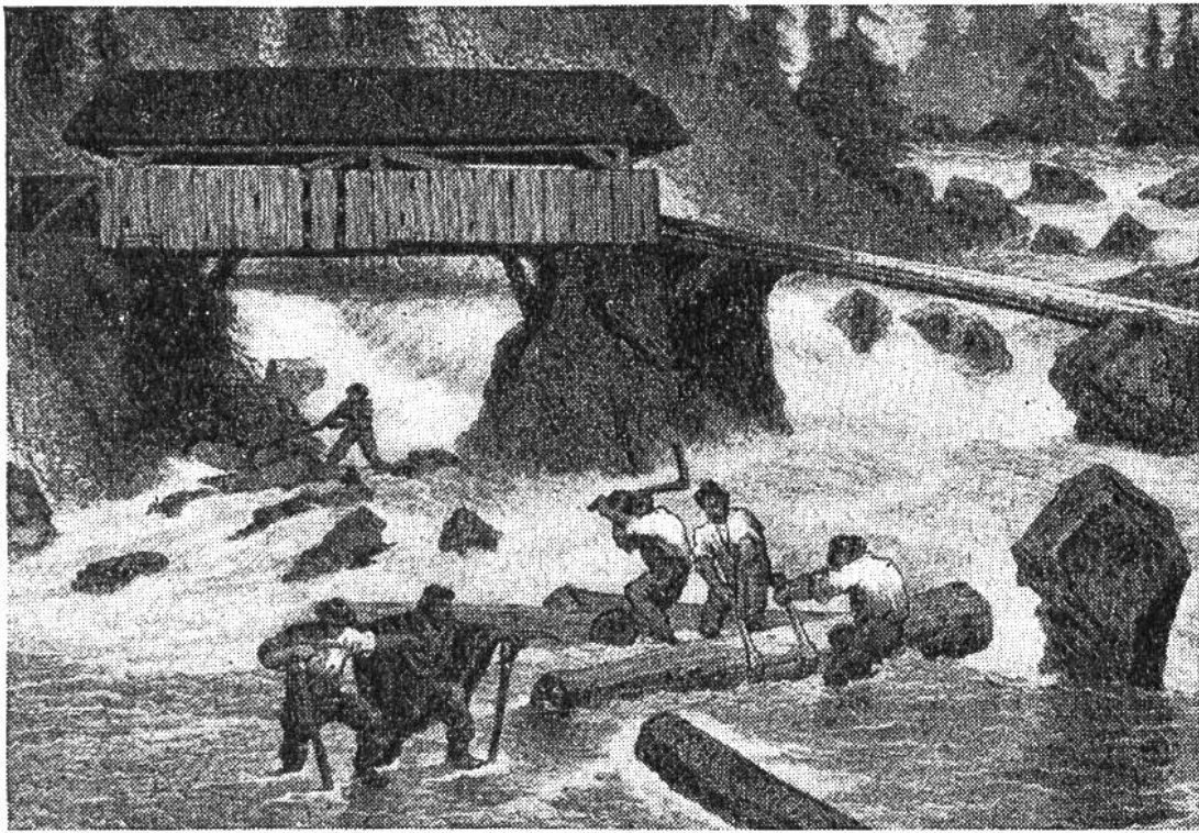
Wildflößen von Sägehölzern an der Sense. Nach einem alten Stich.

mässigen Holzlieferung an Bergwerksbetriebe verwendet wurden, sind heute aus unseren Bergtälern verschwunden. Beim Holzreisen wie bei der Wildflösserei oder der «Trift» (so heisst der Transport einzelner Holzstücke durch das Wasser) wird das Holz durch das häufige Anschlagen stark beschädigt. Die Triftflösser rechnen mit einem mittleren Holzverlust von 10%. Früher soll dieser Verlust noch grösser gewesen sein. So konnte die Stadt Zürich in den Jahren 1616–1619 am Rechen der Sihl nur zwei Fünftel aller von den Schwyzern im oberen Sihltal abgekauften Scheiter herausfischen. Die restlichen drei Fünftel gingen durch Hochwasser, Hängenbleiben, Untersinken und Diebstahl unterwegs verloren.