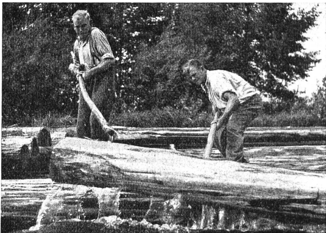
Mühsam heben die Flößer die zweite Lage Stämme auf das von ihnen selbst erstellte Floss.

gerei oder einer fahrbaren Strasse – haben die Flößer einen Rechen errichtet, der das Weiterwandern des Holzes verhindert. Im felsigen Bergbach verfängt sich das Holz leicht an allen möglichen Hindernissen. Damit keine Stauungen entstehen und alles nachfolgende Holz leicht passieren kann, müssen die Flößer mit ihren langen, zweizinkigen Flößerhaken die festgeklemmten Scheiter, Stangen und Trämel auf dem ganzen Talweg immer wieder lösen. Die meisten Flößer lieben ihren gefährlichen Beruf. Geschickt springen sie von Block zu Block oder turnen waghalsig auf zwei Stämmen quer über den stiebenden Bach, dessen Tücken sie genau kennen und daher wissen, wie sie ein festgefahrenes Stück Holz im reissenden Wasser wieder flott machen müssen, damit es sicher zu Tale gleitet.