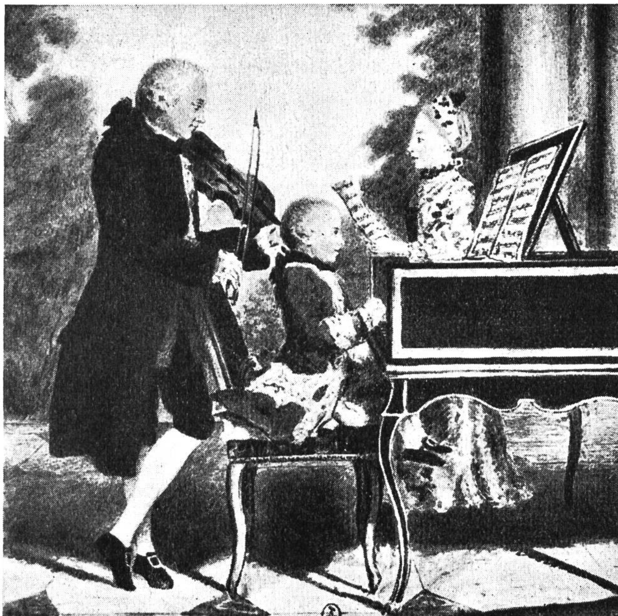
Mozart im Alter von 7 Jahren mit Vater und Schwester in Paris. Stich von Delafosse um 1764.

von Nassau-Weilburg, welche die Mozarts nun nach Holland, in den Haag, einlädt. Schliesslich aber kehren sie nach dreijähriger Abwesenheit über Paris, Südfrankreich, die Schweiz und München nach Salzburg zurück.