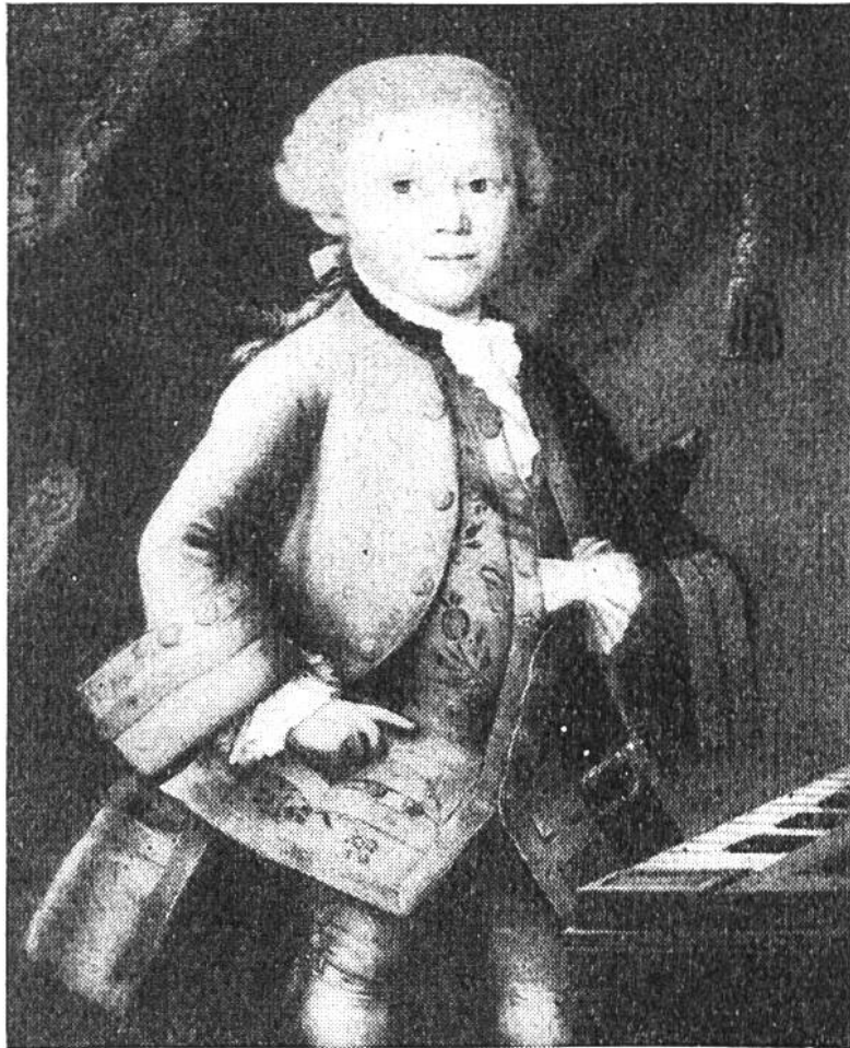
Der junge Mozart im Galakleid. Ölgemälde im Mozart-Museum in Salzburg.