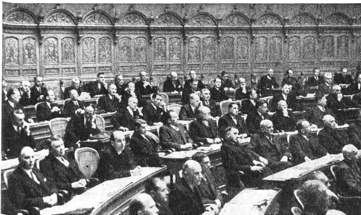
Hier tagen die 196 Nationalräte.