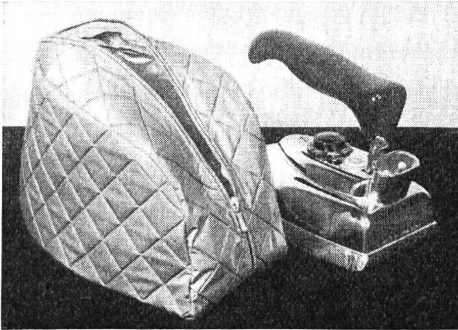
In dem Etui aus Plastic ist das Bügeleisen gut vor Staub geschützt.