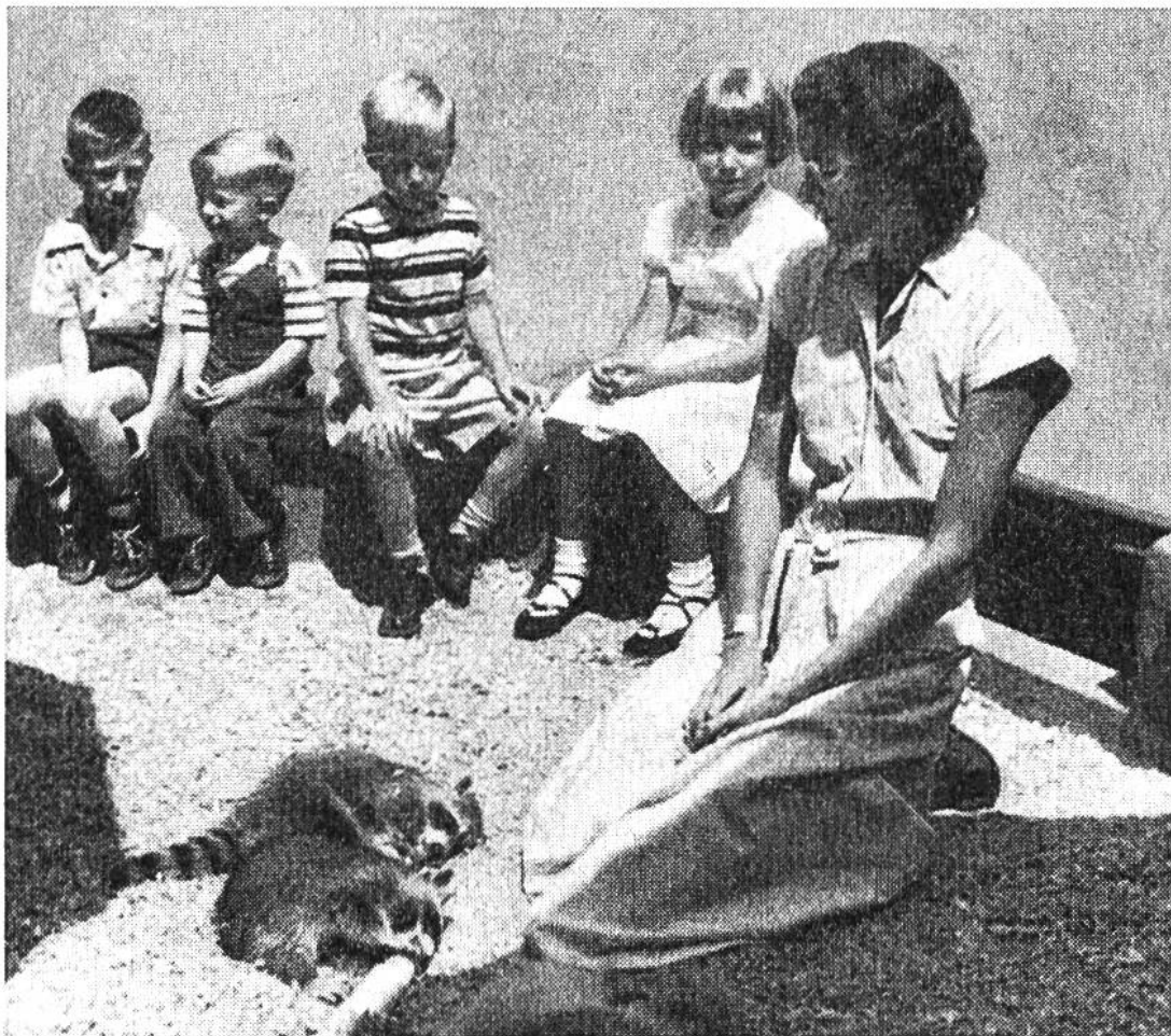
Die Zoo-Lehrerin von Detroit erzählt von Waschbären und zeigt, wie sie spielen.

durch, dass man ein Tier mit Gewalt heranholt und umschlingt, sondern nur dadurch, dass der Mensch das Tier liebevoll und respektvoll auffordert, zu ihm zu kommen. Dem Tier muss daher alle Freiheit gelassen werden; man darf es unter keinen Umständen zwingen – auch wenn man es noch so gerne Herzen und in die Arme schliessen möchte. Dem Tier ist das oft unheimlich, und es kann sich ja nicht wehren. Wehrhafte Tiere gibt es im Tierkindergarten nicht, weil sie die Menschenkinder verletzen könnten. – Der Kinder-Zoo in diesem Sinn ist also eine höchst zwiespältige, für das Tier sehr zweifelhafte Angelegenheit.