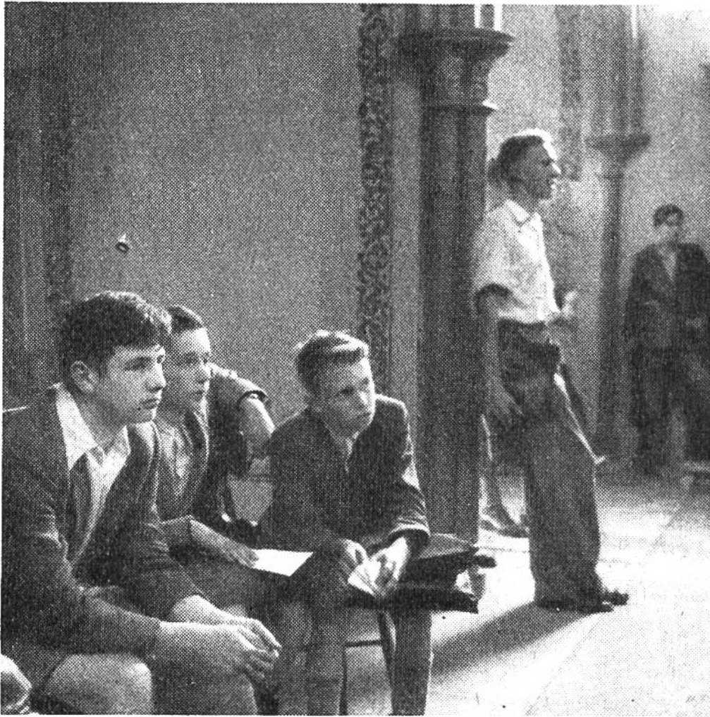
Neuntklässler lauschen ergriffen den Orchesterklängen.

wieviel Freude, wieviel Ergriffenheit aus ihnen spricht? – Da ist der kleine Flötist von sechs Jahren, der seinem Schwesterchen auf der Blockflöte vorspielt. «Kuckuck, Kuckuck! Suseli, guck, guck!» Und Suseli hat gut zugehört, damals. Jetzt spielt es selber schon Geige und sein grosser Bruder die Querflöte. – Oder hättet ihr euch vorgestellt, dass es so lustig zugeht wie auf dem zweiten Bild, wenn euch im Radio mitgeteilt wird: «Hört zu, jetzt folgt die Kindersymphonie von Haydn, gespielt von lauter Kindern»? Da trommeln und trompeten sie, schlagen den Triangel, streichen Geige und Bratsche, und eines darf wiederum den Kuckuck spielen. – Und auf den andern Bildern? Da dürfen die Grösseren ein von der Schuldirektion veranstaltetes Konzert anhören, das nur um ihretwillen aufgeführt wird. Alle Neuntklässler bekommen einen schulfreien Vormittag, um Musik zu erleben. Dichtgedrängt füllen sie die geräumige