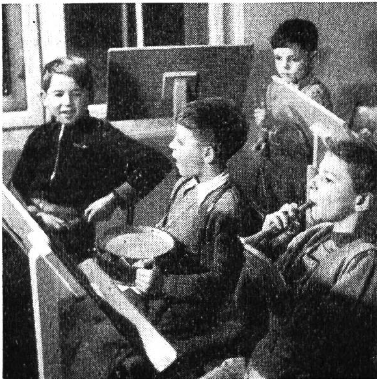
Kinder musizieren für Kinder; Radiosendung von Haydns Kindersymphonie.