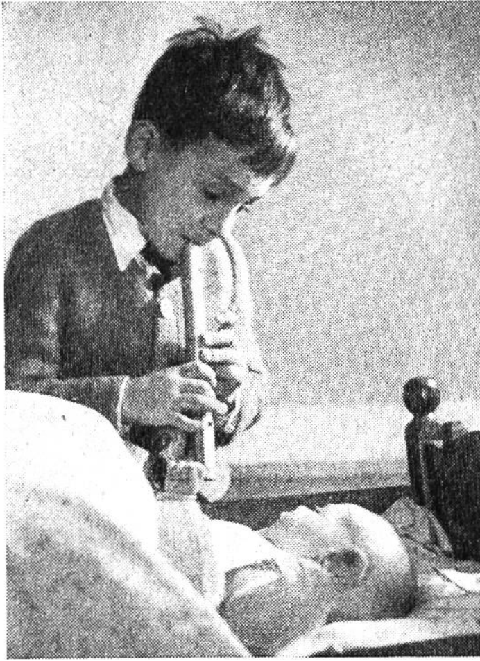
Hörst du, Suseli: Kuckuck, Kuckuck – ruft's aus dem Wald!