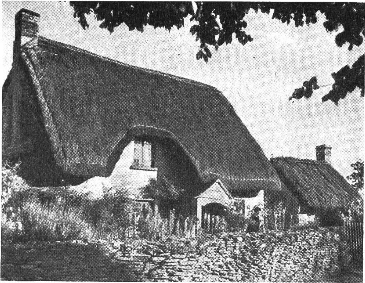
Bauernhäuser mit steil abfallenden Strohdächern in der Grafschaft Oxfordshire, Mittel-England.

chen Zeugen altüberlieferter Bauweise trifft. Das gleiche gilt für andere Gebiete, wo man einst die Dächer mit Stroh deckte. So weiss man im Südtessin, am Lago Maggiore, kaum noch etwas von der einstigen Dachbedeckung. Auch die schönen alten Schwarzwaldhäuser mit ihren Strohdächern, die fast bis auf den Boden herunterreichen, verschwinden leider. Ebenso bevorzugt man heute in den englischen Bauerngegenden immer mehr die Ziegeldächer, weil sie billiger und zum Teil eben doch haltbarer sind. Vor allem aber sind diese weniger feuergefährlich. Die Versicherungsgesellschaften drängen deshalb darauf, dass man zum Decken der Dächer Ziegel oder anderes feuersicheres Material verwende. Aus dem gleichen Grunde finden wir auch in unseren Alpengegenden immer mehr Ziegel- oder gar die hässlichen Wellblechdächer, während früher die schönen, oft mit Steinen beschwerten Holzschindeln als einziges Material in Frage kamen.