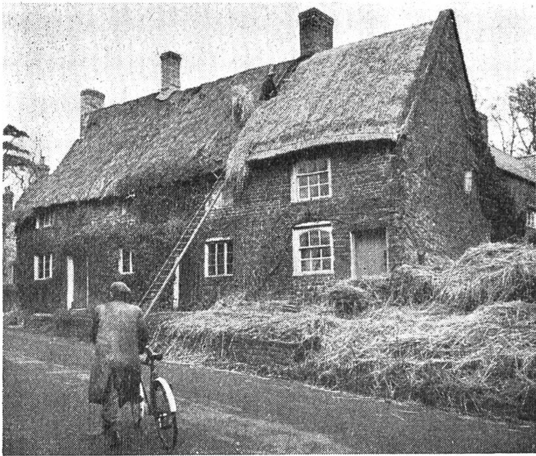
Decken eines Hausdaches mit Stroh in England.