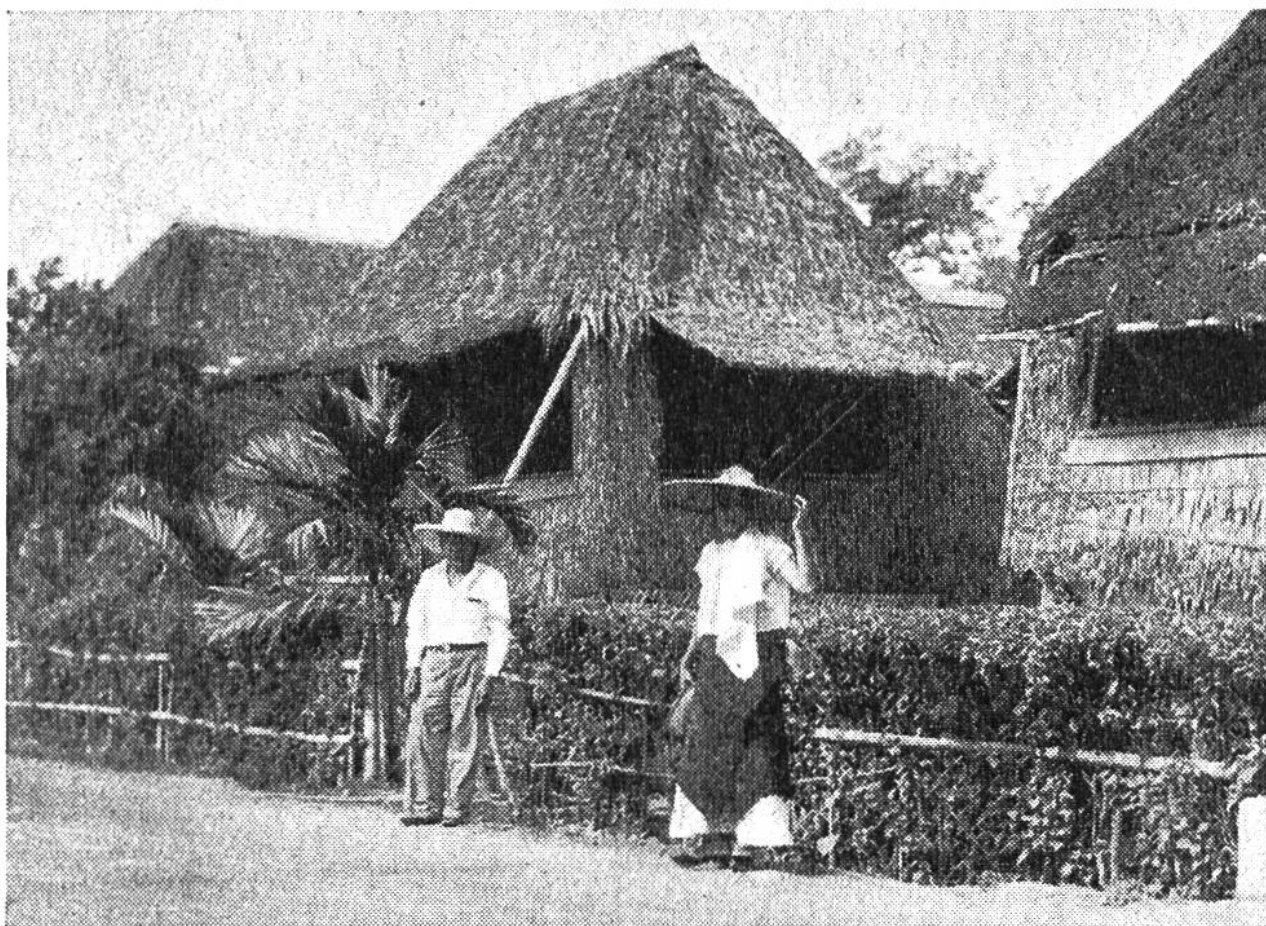
Haus der Eingeborenen, mit Dach und Wänden aus Blattfiedern der Nipapalme in Manila (Philippinen).

Wände oder doch für Teile davon. In der Südsee sind Dachdeckungen aus Blättern der Sagopalme besonders beliebt, da sie nicht so leicht brennen wie Stroh oder andere Palmblätter.