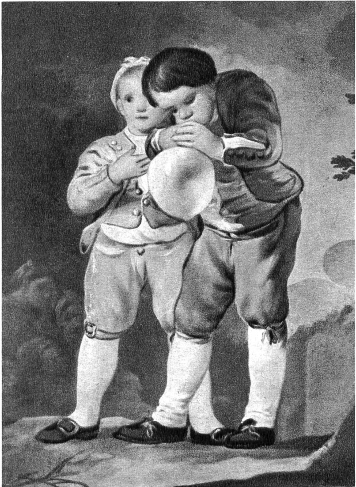
Spielende Kinder, von Francisco Goya, Madrid, 1746 - 1828.