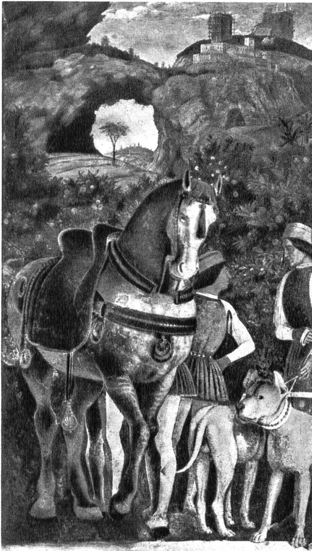
Rückkehr von der Jagd (Teilstück der Fresken in Mantua), von Andrea Mantegna, Mantua, 1431-1506.