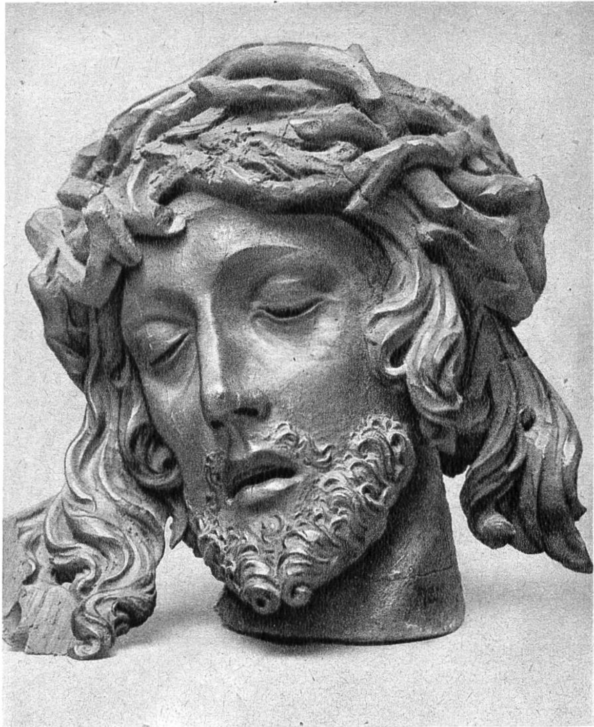
Haupt Christi, Lindenholzplastik eines österreichischen Meisters vom Anfang des 16. Jahrhunderts.