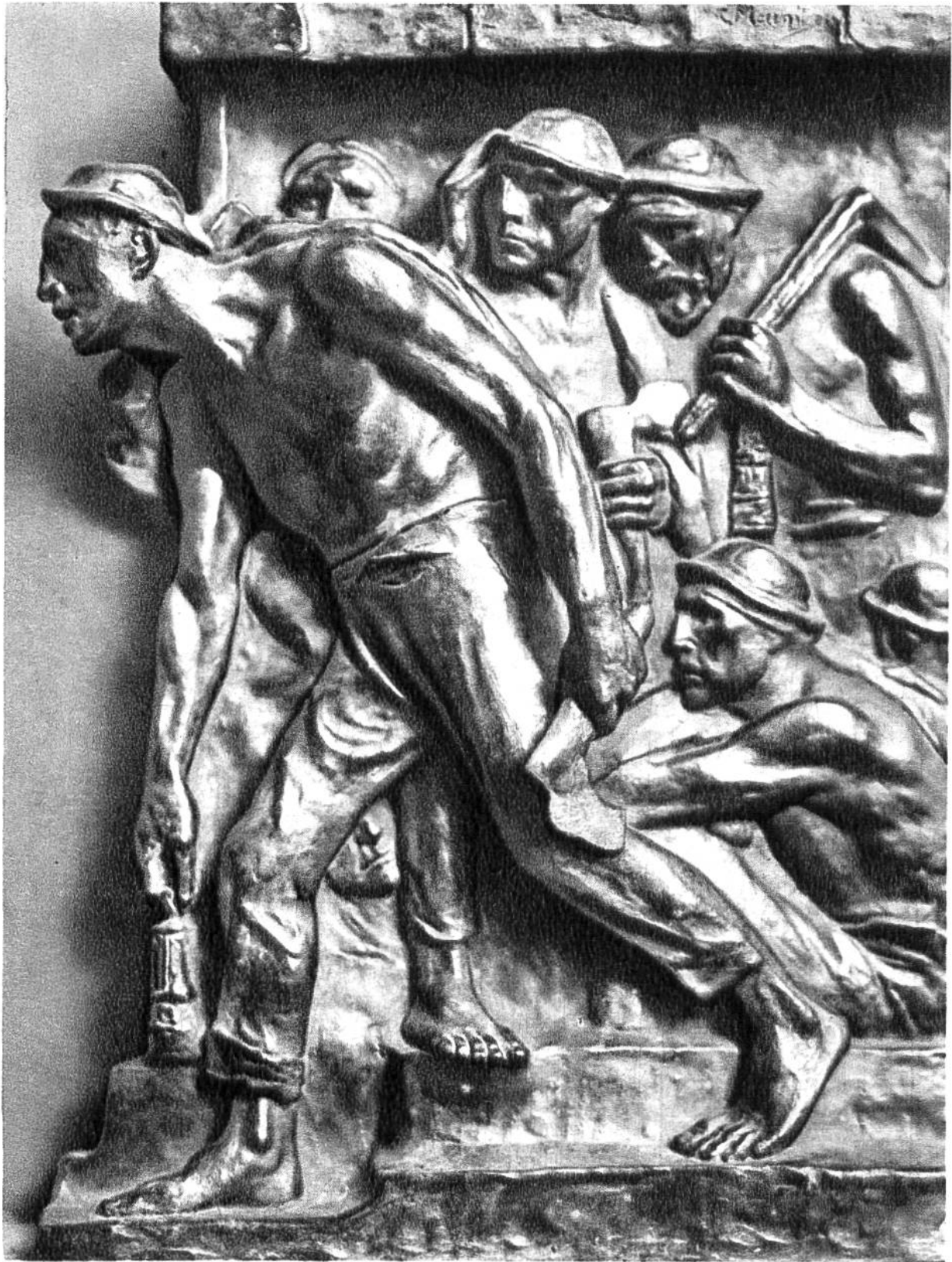
Bergleute nach der Arbeit, Bronzerelief von Constantin Meunier, Brüssel, 1831 - 1905.