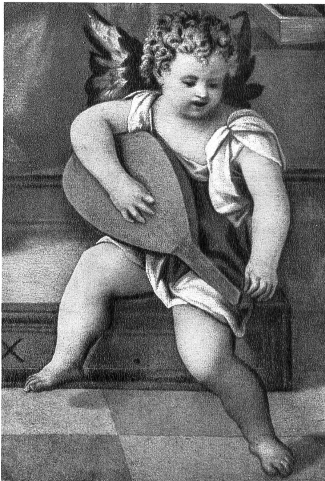
Engel, aus dem Gemälde «der thronende Christus» von Bonifazio Veronese, Venedig, 1491-1553.