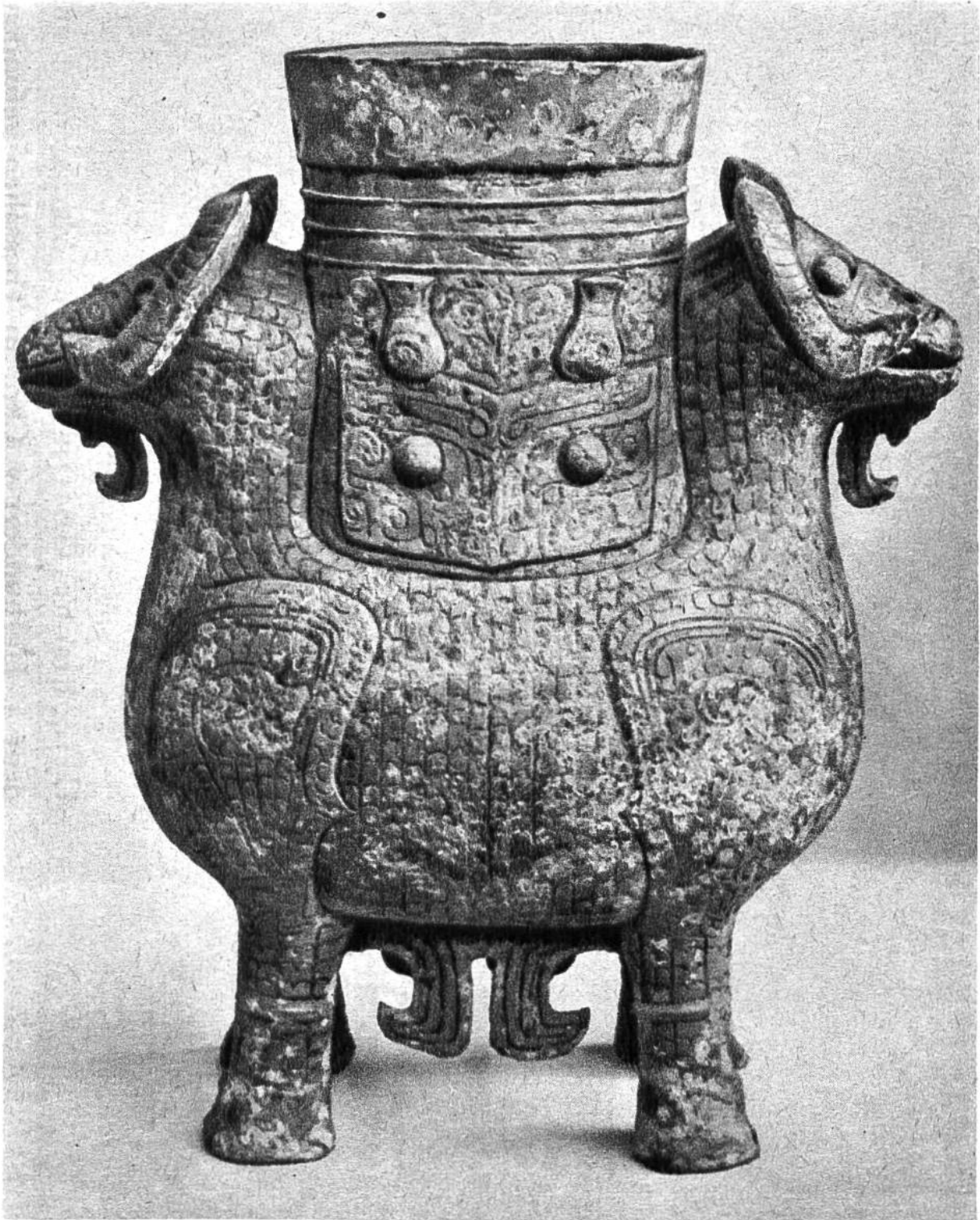
Chinesisches Weihegefäß, Bronze, aus der Zeit der Schang-Dynastie (13.-10. Jahrhundert v. Chr.).