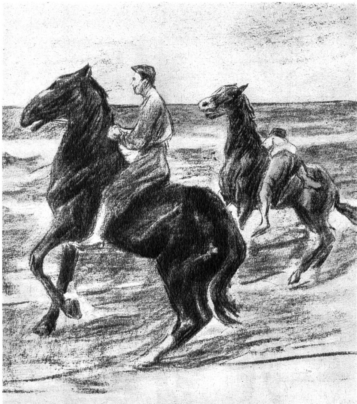
Reiter am Strand, von Max Liebermann, Berlin, 1847-1935.