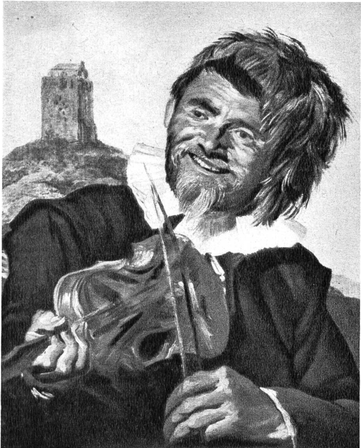
Geigender Fischer am Strand von Zandvoort, von Frans Hals, Haarlem, 1580 - 1666. (Galerie Thyssen, Lugano.)