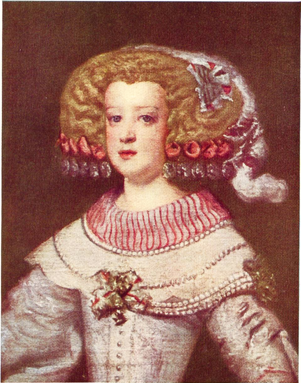
INFANTIN MARIA THERESIA, TOCHTER PHILIPPS IV. VON SPANIEN, SPÄTER GEMAHLIN LUDWIGS XIV. VON FRANKREICH.

Gemälde von Diego Velasquez, Sevilla, 1599–1660.