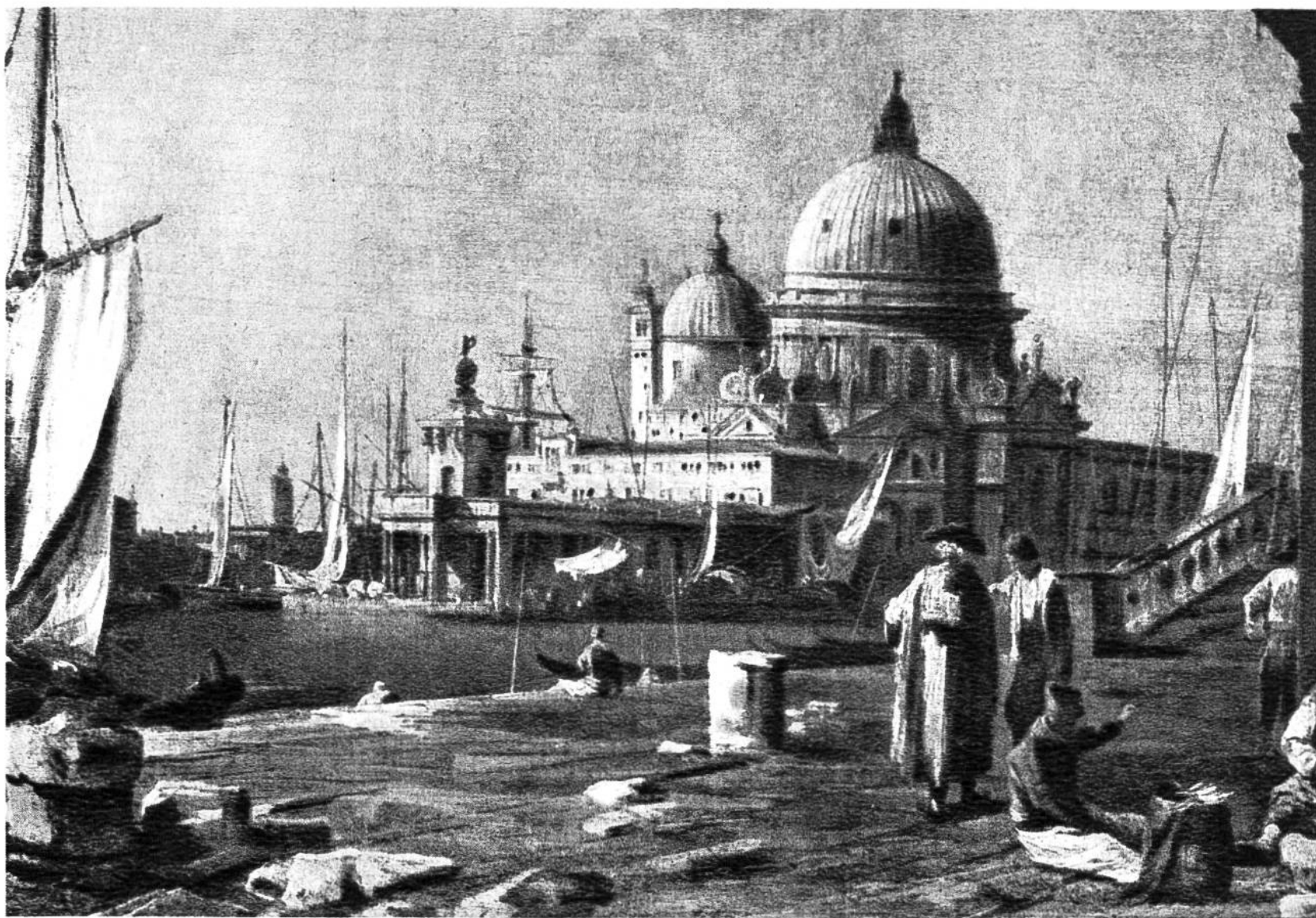
Santa Maria della Salute in Venedig, v. Antonio Canaletto, Venedig, 1697-1768