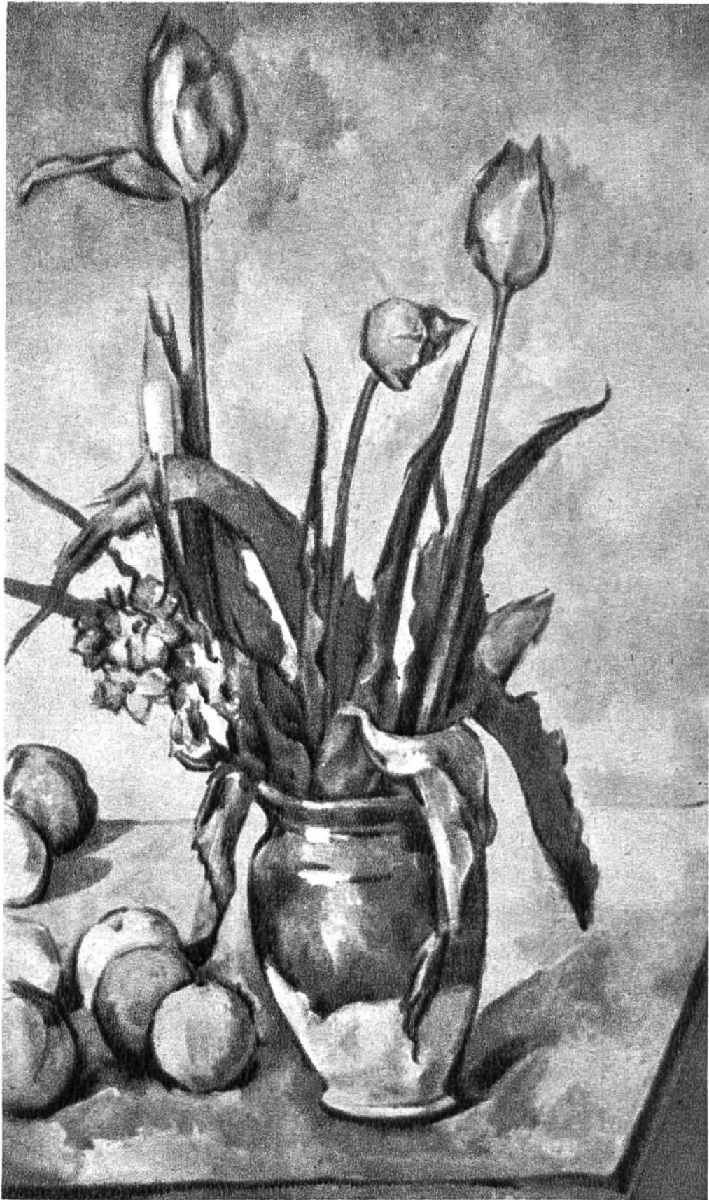
Stilleben, von Paul Cézanne, Aix-en-Provence, 1839 - 1906.