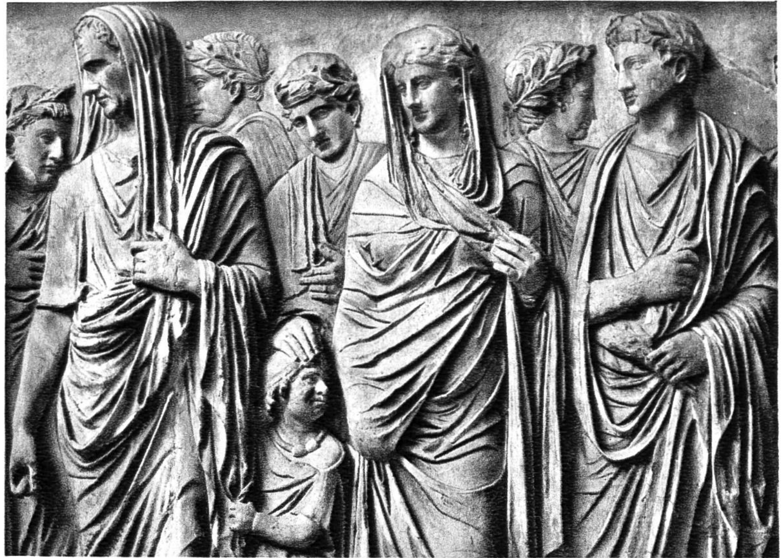
Römische Kaiserfamilie, Relief aus dem 1. Jahrh. v. Chr.