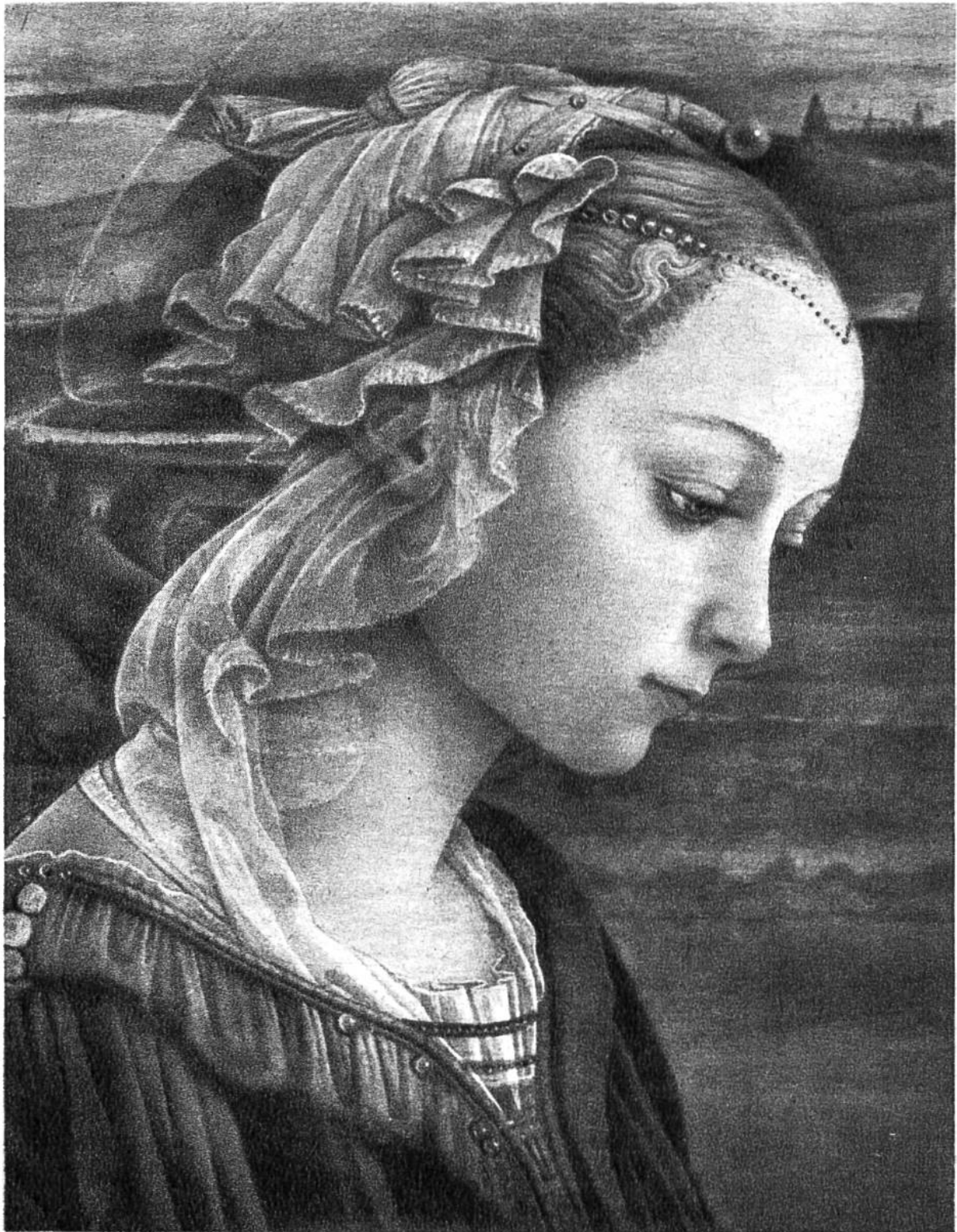
Maria, von Fra Filippo Lippi, Florenz, 1406-1469.