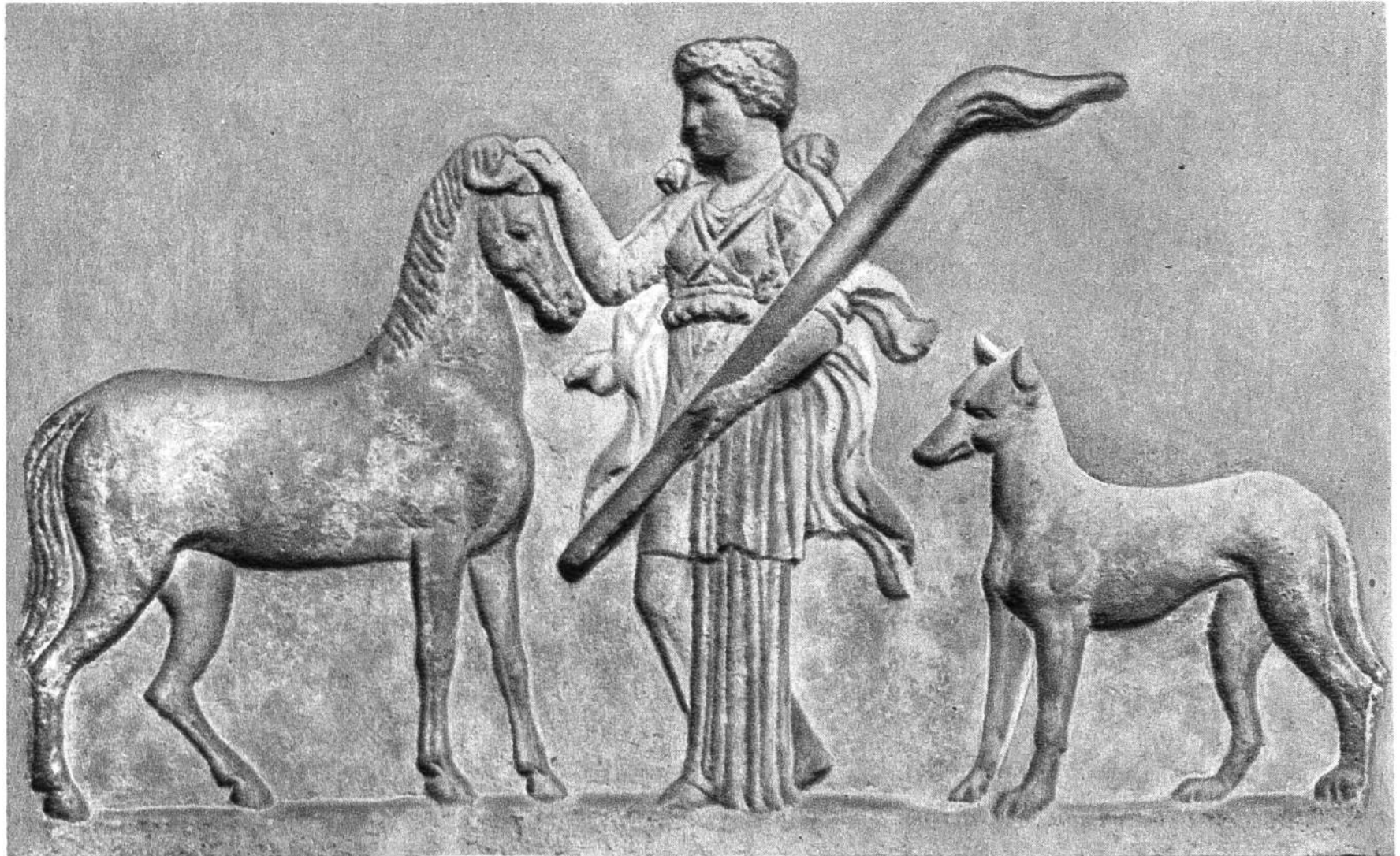
Griechische Göttin Hekate, Marmorrelief aus dem 4. Jahrhundert v. Chr., in Thessalien gefunden.