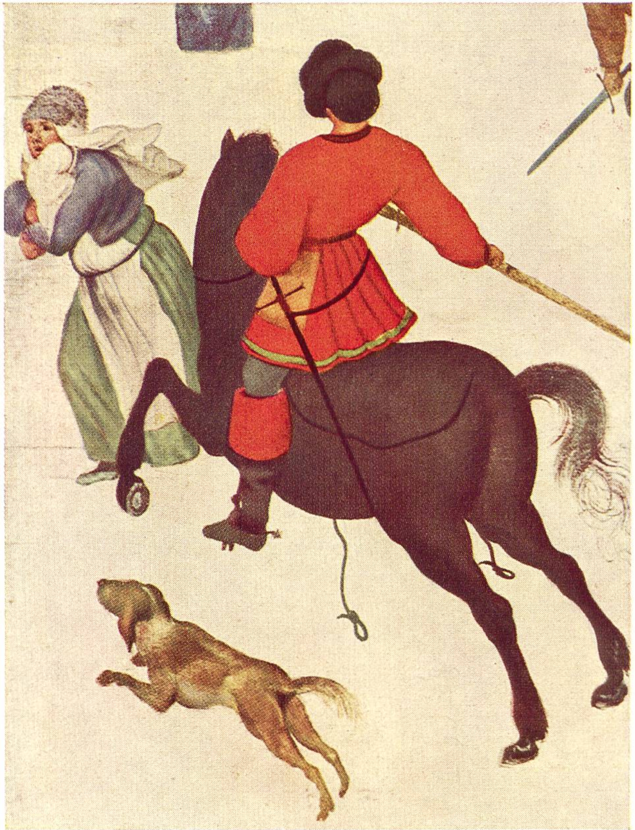
BETHLEHEMITISCHER KINDERMORD (Teilstück), von Pieter Brueghel dem Älteren (genannt Bauernbrueghel), Brüssel, 1525–1569.