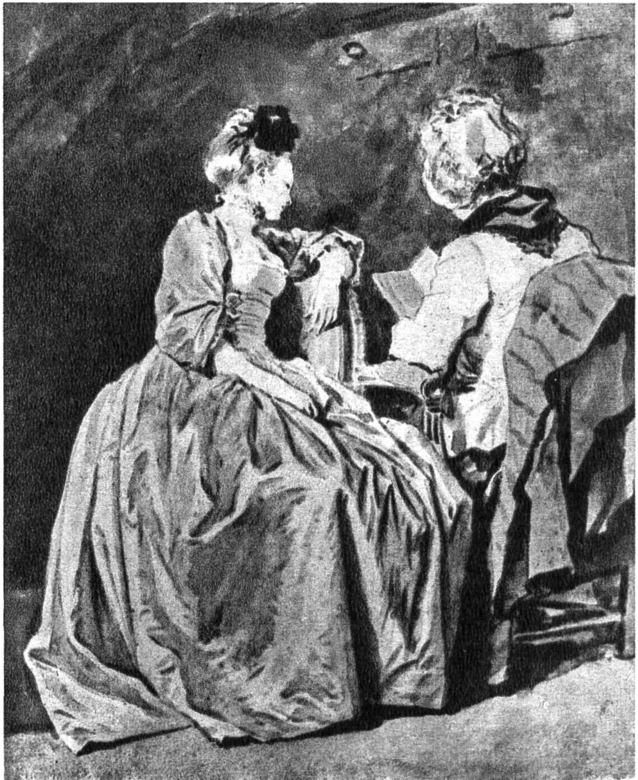
Die Lesenden, von Jean-Honoré Fragonard, Paris, 1732-1806.