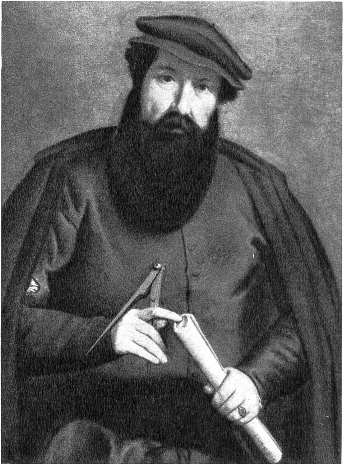
Architekt, von Lorenzo Lotto, Venedig, 1480-1556.