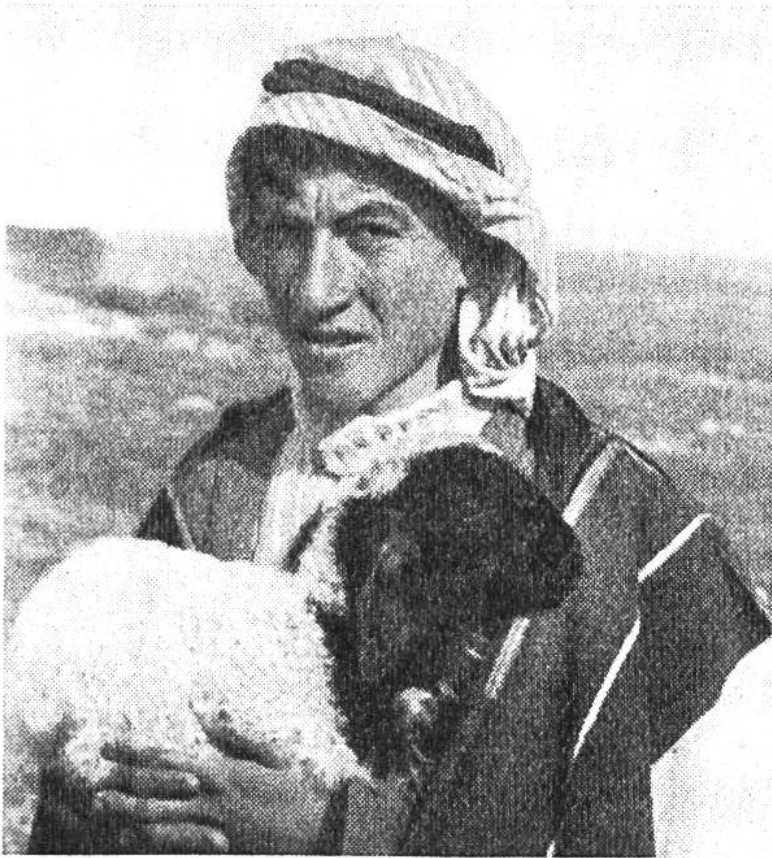
Türkischer Hirte mit einem müden Schäfchen.