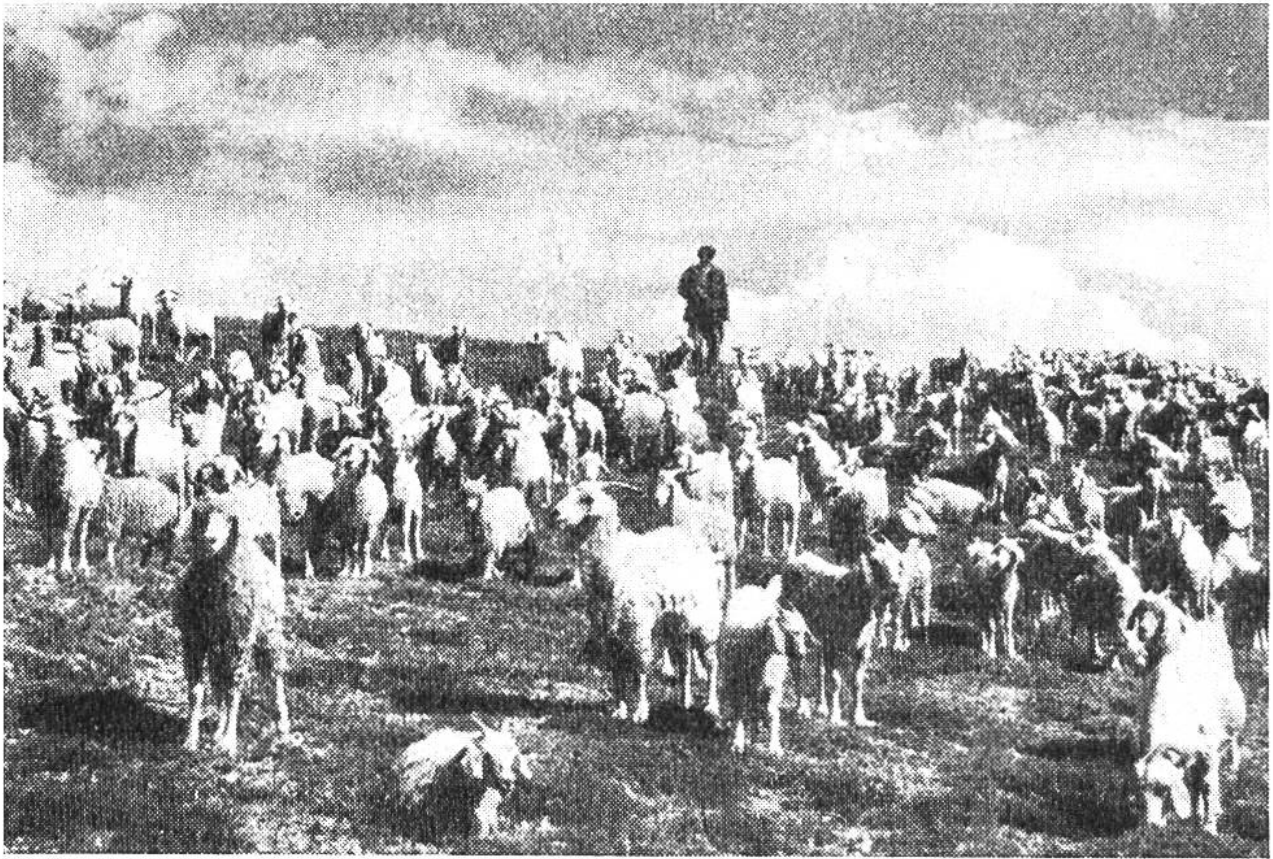
Fettschwanzschafe und Angoraziegen ziehen über die Steppen Kleinasiens hinauf in die Jailas (Maiensässen) des Taurusgebirges.

Herde ist der Wassermangel, die Dürre. Aber der Hirte kennt seinen Wanderweg sehr genau und findet auch im Hochsommer unversiegte Quellen. Die meisten Wanderwege folgen daher weniger den Bergrücken als jenen Taleinschnitten, die möglichst weit ins Gebirge zurückgreifen. Mit der Zeit bildeten sich daher auch gewisse Gewohnheitsrechte für die einzelnen Hirtensippen, die heute mehr denn je beachtet werden.