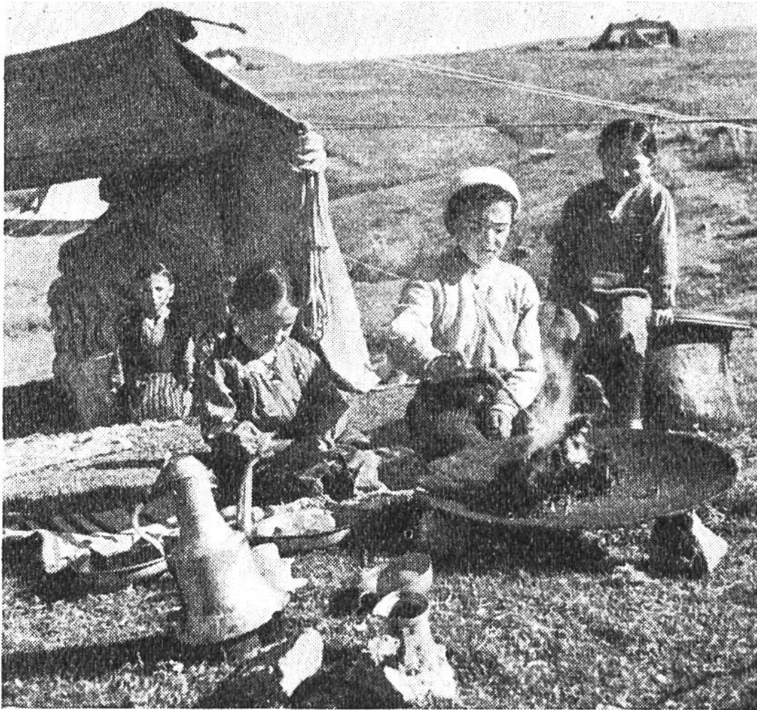
Die Jungmannschaft ist beim Kochen. Auf einem Kupferblech wird Feuer entfacht, um die Kaffeekanne (links) in glühende Holzkohle (oder Schafdung) setzen zu können. Nomaden trinken oft und gerne «Türkischen».

familie lebt vegetarisch, ausgenommen dann, wenn ein hoher Gast im Zelt ist. Dieser wird mehr geschätzt als irgendein Familienangehöriger. In allen Ländern Vorderasiens wird die Gastfreundschaft ungemein hochgehalten, so hoch, dass wir sie kaum noch begreifen können. Bei den türkischen Nomaden wird ein Fremder wie ein König aufgenommen! Geht und prüft diese Behauptung, vergesst aber nicht, einen kräftigen Knüppel mitzunehmen, um euch der bissigen Hirtenhunde zu erwehren, die von «Gastfreundschaft» keine Ahnung haben!