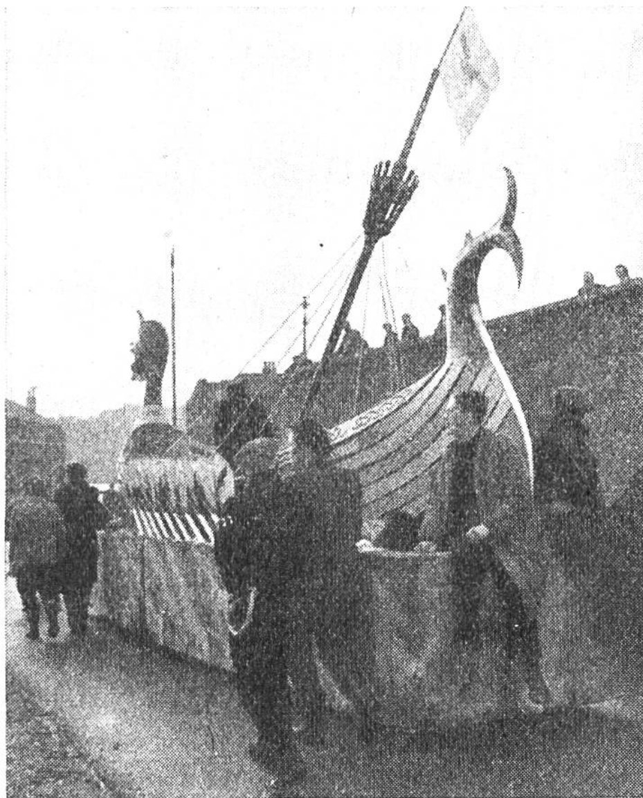
Das selbstgebaute Wikingerschiff wird an den Strand gebracht.