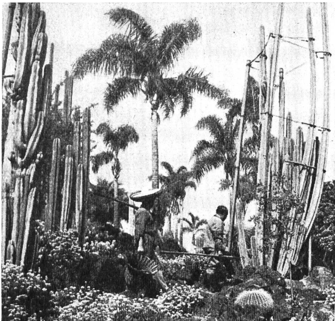
Wie man sieht, brauchen auch die stacheligen Kugeln und die hohen Säulen der Kakteen gärtnerische Pflege und Stütze. Im Hintergrund stehen Palmen.

welken, wenn sie nicht genügend Wasser bekommen, tragen einige Arten Dornen, die fast kein Wasser verdunsten. Bei anderen Arten sind die Blätter ganz zurückgebildet, in den Blattachseln haben sich Haar- oder Stachelbüschel entwickelt. Wenn die Kakteen einmal bei Regen viel Wasser bekommen, so können sie es aufnehmen und in ihrem dicken Stamm für die kommenden Dürrezeiten speichern. Bei manchen Arten benutzen die Menschen dieses aufgespeicherte Wasser sogar als Trinkwasser.