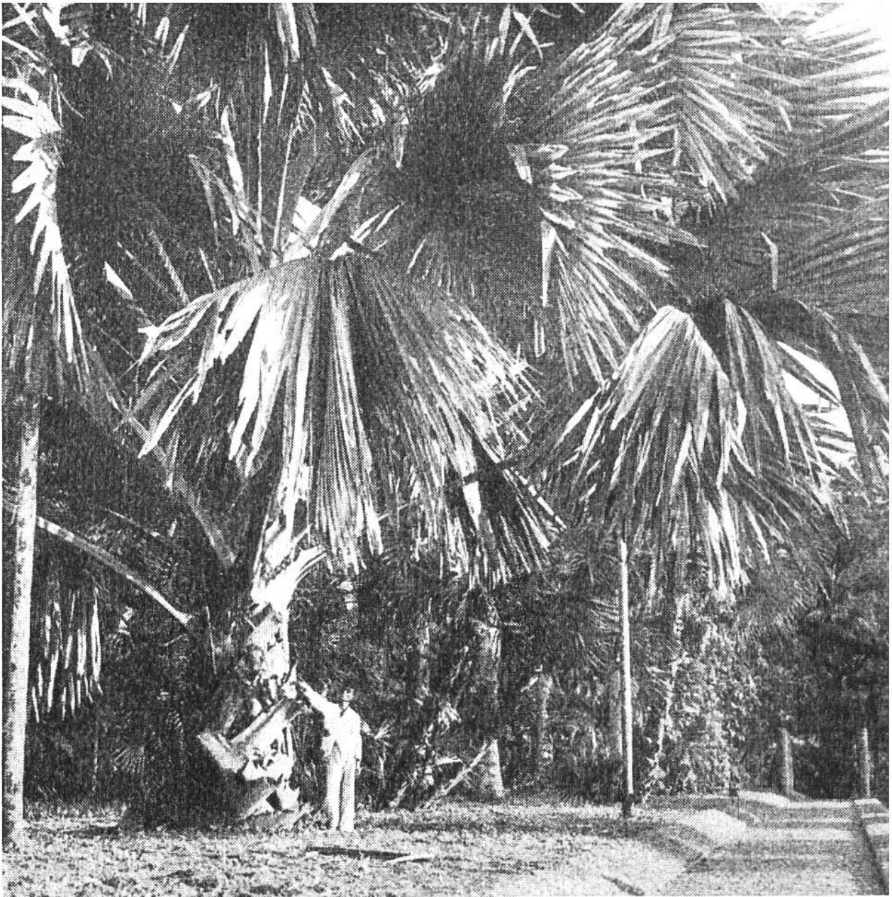
Wie klein ist doch der Mann, der am Fusse dieser Fächerpalme steht, im Vergleich zu ihren riesigen Blättern! Die Aufnahme stammt aus dem botanischen Garten von Buitenzorg.

Besondere Berühmtheit haben die schönen, grossen Alleen erlangt, die den Garten durchziehen. Die eine wird von kubanischen Königspalmen gebildet und führt zum Palais des Generalgouverneurs; die andere, «Kanarienallee» genannt, hat zu beiden Seiten Bäume, die über und über mit tropischen Schlingpflanzen, kletternden Aronstabgewächsen und wunderbaren Orchideen bedeckt sind. G. Tischler