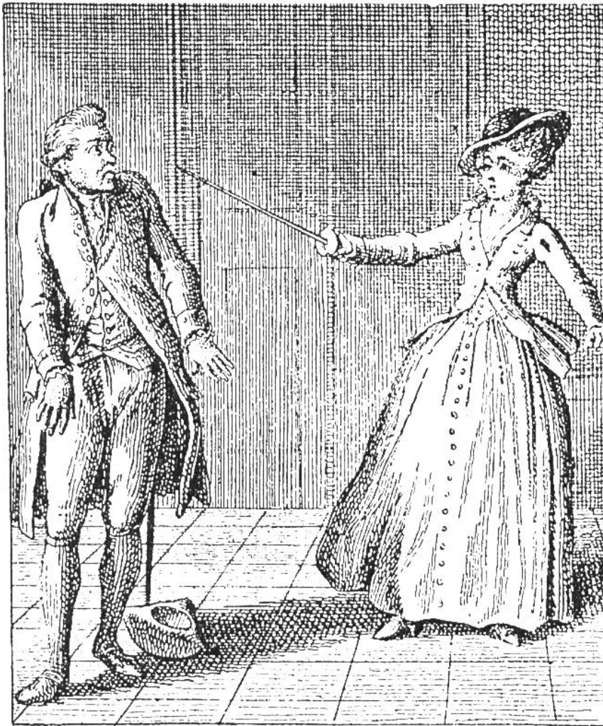
«Siehst du, Bösewicht, was ich jetzt aus dir machen kann?» Franz Moor wird von Amalia zurückgewiesen. Kupferstich von Chodowiecki zu den «Räubern».

In Schillers «Huldigung der Künste» spricht die Poesie: