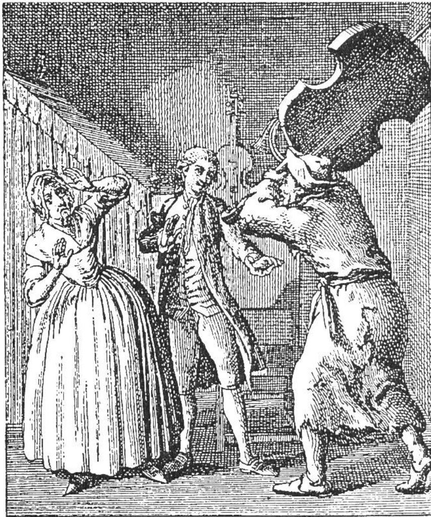
«Willst du dein Maul halten? Willst das Violoncello am Hirnkasten wissen?» Sekretär Wurm, Miller und seine Frau. Kupferstich von Chodowiecki zu «Kabale und Liebe».

Es schlossen sich ihr, die vom schlichten Reichtum des Herzens gab, die Männer aus hochadligem Geblüt an, um dem Dichter mit ehrenden Gaben beizustehen. Und es kam schliesslich derjenige dazu, dessen Freundschaft alles galt: Johann Wolfgang Goethe, der Dichturfürst. Jetzt, in dessen Gesellschaft zu Weimar, fühlte sich Schiller wirklich reich, weil er einen Gleichgesinnten mit gleichem schöpferischem Streben gefunden: «Gib der Welt, auf die du wirkst, die Richtung des Guten!»