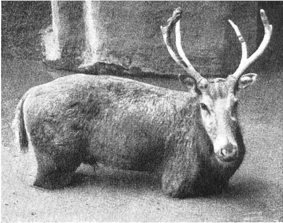
Davids-Hirsche baden sehr gerne.

Damals kaufte der Vater des Duke of Bedford, ein weit-sichtiger Naturfreund, in den Zoologischen Gärten von Paris und Antwerpen die letzten überlebenden Exemplare zusammen und brachte sie auf sein herrliches Gut in Woburn Abbey. In diesem wunderschönen Park befindet sich heute die einzige große Herde der asiatischen Hirschart; sie umfaßt über 300 Köpfe. – Zur Vorsicht und um nicht das ganze Schicksal des seltenen Geschöpfes auf eine Karte zu setzen, ging der Duke of Bedford in letzter Zeit dazu über, einzelne Paare an andere Tierpfleger abzugeben. So gibt es jetzt z. B. im Whipsnade Zoo bei London eine kleine Herde, andere Davids-Hirsche wurden nach Zoologischen Gärten des Kontinents, ferner nach Kanada, Australien und Nordamerika geschickt. Auf diese Weise ist nun das Risiko verteilt. Wenn auch eine Gruppe durch Maul- und Klauenseuche oder eine andere Krankheit gefährdet werden sollte, besteht doch die Wahrscheinlichkeit, daß sich die übrigen zu großen Herden entwickeln werden, so daß die sonderbare Hirschart erhalten bleibt. H.