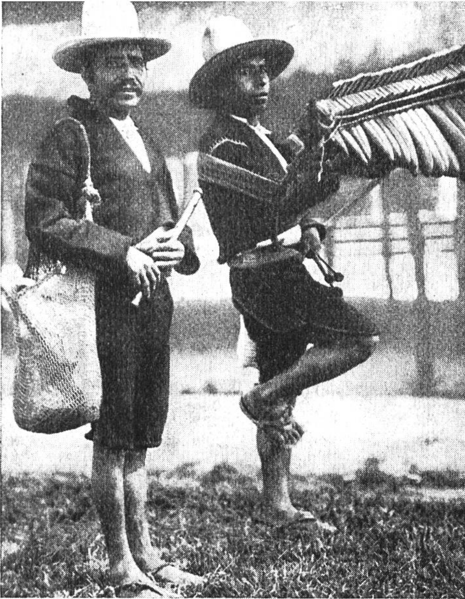
Zwei Musikanten aus Guatemala

in Mittelamerika. Ihre Instrumente sind denkbar primitiv, die kleine Maramba und die einfache Holzpfeife – aber sie tönen und klingen.