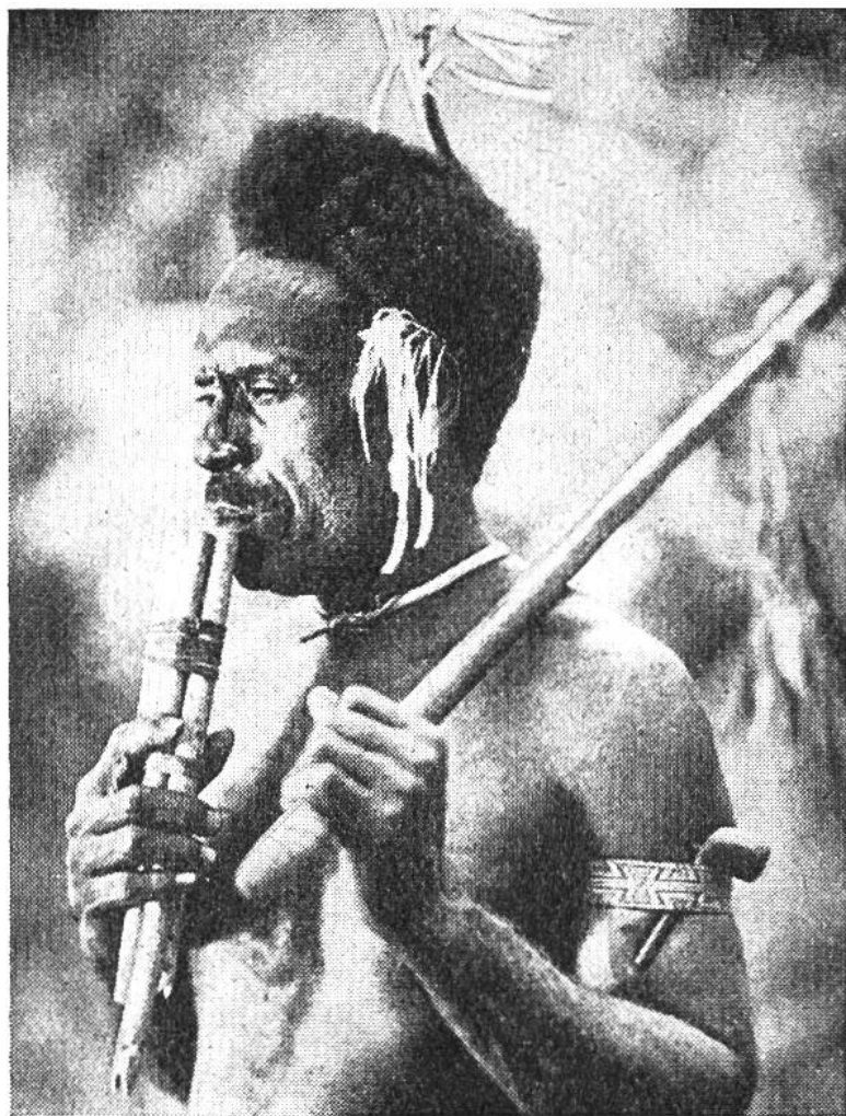
Ein Nasioi-Insulaner der nördlichen Salomon-Inseln im Fest- und Tanzschmuck. Die Rechte hält eine Bocksflöte, auf der er zum Tanz aufspielen wird. Mangels Taschen hat er seine Rauchpfeife in den Armreif gesteckt.

Zupfinstrumente der primitiven Völker gehören hierher. Zur Zeit der Renaissance war die Laute bei Musikfreunden so beliebt und für das Musikleben so bedeutungsvoll wie bei uns das Klavier. Heute ist sie wie Gitarre, Mandoline und fast alle Zupfinstrumente zum Haus- und Familieninstrument geworden, und man vernimmt ihre vollen Klänge selten im Konzertsaal. Die Harfe, deren Akkorden wir bei der Aufführung der grossen Oper ergriffen lauschen, ist eines der ältesten Instrumente. Zum Klang der Harfe sang König David seine Psalmen, feierten die Ägypter und die Römer ihre Feste, und die Minnesänger des Mittelalters begleiteten ihre Weisen auf der kleinen Harfe, wie die bildlichen Darstellungen des berühmten Sängerkriegs auf der Wartburg bezeugen. Die altgriechische Lyra, die in der Bauart einfache, kleine Kitharis, von der wir nicht mehr wissen, wie sie klang, ist zum Sinnbild der holden Kunst der Frau Musica geworden.