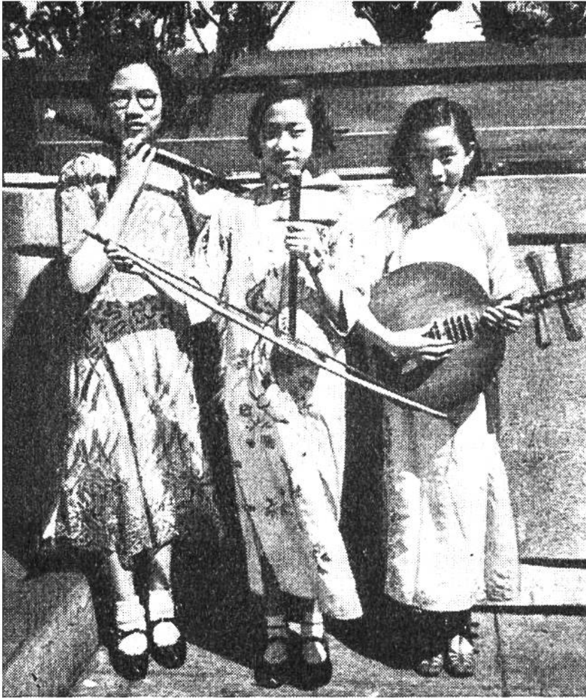
Japanische Mädchen spielen ein Trio auf ihren heimatlichen Zupf-, Streich- und Blasinstrumenten.

Musikinstrumente gibt es in Tausenden von Arten. Holz und Metall, Knochen und Horn, Muscheln und Glas, Fell und Pergament sind die bevorzugten klingenden Stoffe, aus denen sie seit alters hergestellt sind. Der Mensch bringt sie durch Schlagen und Zupfen, Streichen und Reiben, Tasten und Blasen zum Schallen und Tönen.