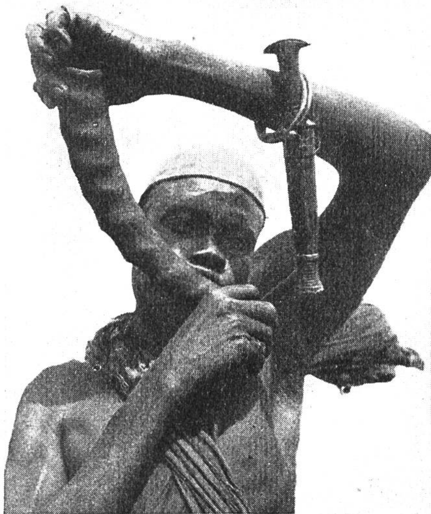
Von den Negern Kameruns wird die Kirdi-Trompete geblasen, wobei mit der Handfläche über der grossen Öffnung des Horns der Ton nach der gewünschten Höhe abgeändert werden kann.

tall, die es auf der weiten Welt gibt, ist Legion. Aus einigen Rohrpfeifen von verschiedener Länge, die sie aneinanderklebten, verfertigten die Hirten in frühesten Zeiten (wie heute noch die Gauchos in Südamerika) die Panflöte. Sie ist in unserem Kulturkreis fast vergessen; aber eines der wundervollsten Musikstücke der Welt erklingt heute noch auf diesem Instrument: Papageno spielt in Mozarts «Zauberflöte» darauf. Die Querflöte mit ihren reinen Tönen und hohen Vogeltrillern wird quer an den Mund gehalten. Sie fehlt in keinem Orchester. Zusammen mit den Wirbeln und Schlägen der Trommel ergibt das schrille Pfeifen der Kleinen Querflöte, der Piccolo-Flöte, wie sie auch genannt wird, eine flotte Marschmusik. Oboe, Englischhorn, Klarinette und Fagott sitzen im Orchester nebeneinander. Die Oboe klingt klar und hell, anmutig und doch spitzer als ihre weicheren, drolligen und zuweilen elsternhaft geschwätzigen Schwestern, die Klarinette und das