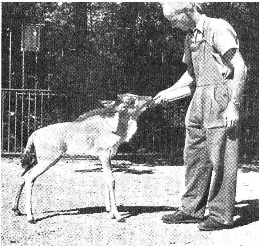
Junges Weissbartgnu als Flaschenkind.

In allen Zoologischen Gärten, in denen Gnus zur Schau gestellt sind, kann man beobachten, wie sich vor deren Gehegen besonders Besucher aus ländlichen Gegenden ansammeln und oft kopfschüttelnd und staunend vor diesen sonderbaren Tieren verweilen. Solche Besucher kennen das Rind und das Pferd sehr gut; aber das Gnu scheint ihnen von beiden etwas zu haben und fesselt sie gerade wegen dieser Mischung oft