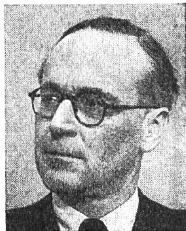
Dr. R. Rubattel von Villarzel (Vd.) * 1896, seit 1948 im Amte

Inneres: Dr. Etter. Mi- litär: Dr. Kobelt. Po- lit. Departement: Dr. Petitpierre. Volks- wirtschaft: Dr. Ru- battel. Post und Ei- senbahn: Dr. Escher. Justiz und Polizei: Dr. Feldmann. Finanz und Zoll: Dr. Streuli.