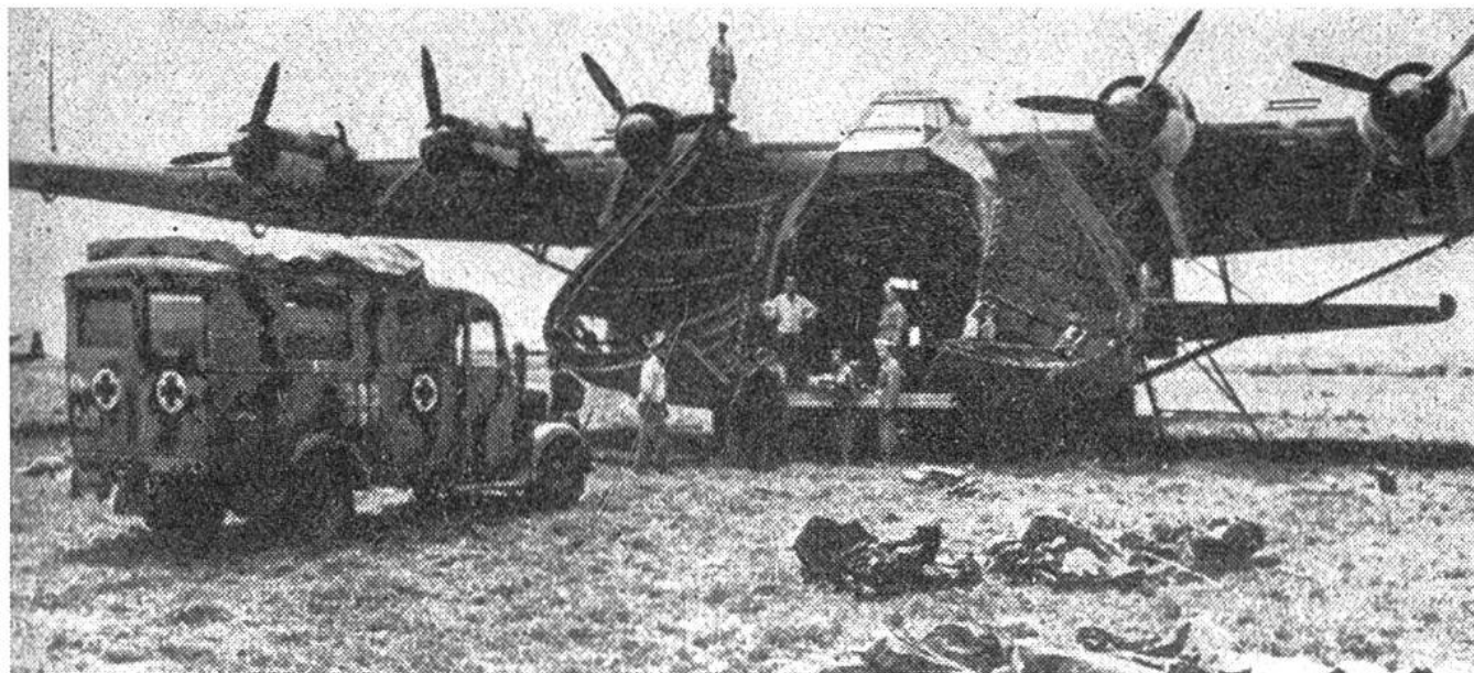
Moderner Transport von Kriegsverwundeten mit Ambulanzen und Grossraumflugzeug.

besserung des Loses der Verwundeten und Kranken der Heere im Felde, zur Verbesserung des Loses der Verwundeten, Kranken und Schiffbrüchigen der bewaffneten Kräfte zur See, über die Behandlung der Kriegsgefangenen und über den Schutz der Zivilpersonen in Kriegszeiten – den Erfahrungen im Koreakrieg und den mutmasslichen Kriegsmitteln eines künftigen Krieges entsprechend schon wieder erweitert werden. Denn die Zerstörungen gehen immer dem Heilen voraus. So wird das Rote Kreuz sein Ziel wohl erst dann erreicht haben, wenn es auf der Erde keine Kriege mehr gibt.