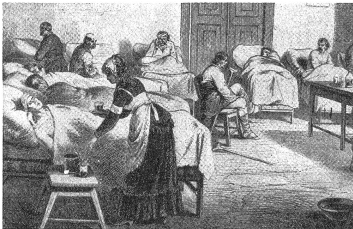
Englisches Kriegsspital in Belgrad 1877. Freiwillige des Roten Kreuzes, Frauen und Männer, pflegen und laben Kriegsverwundete.