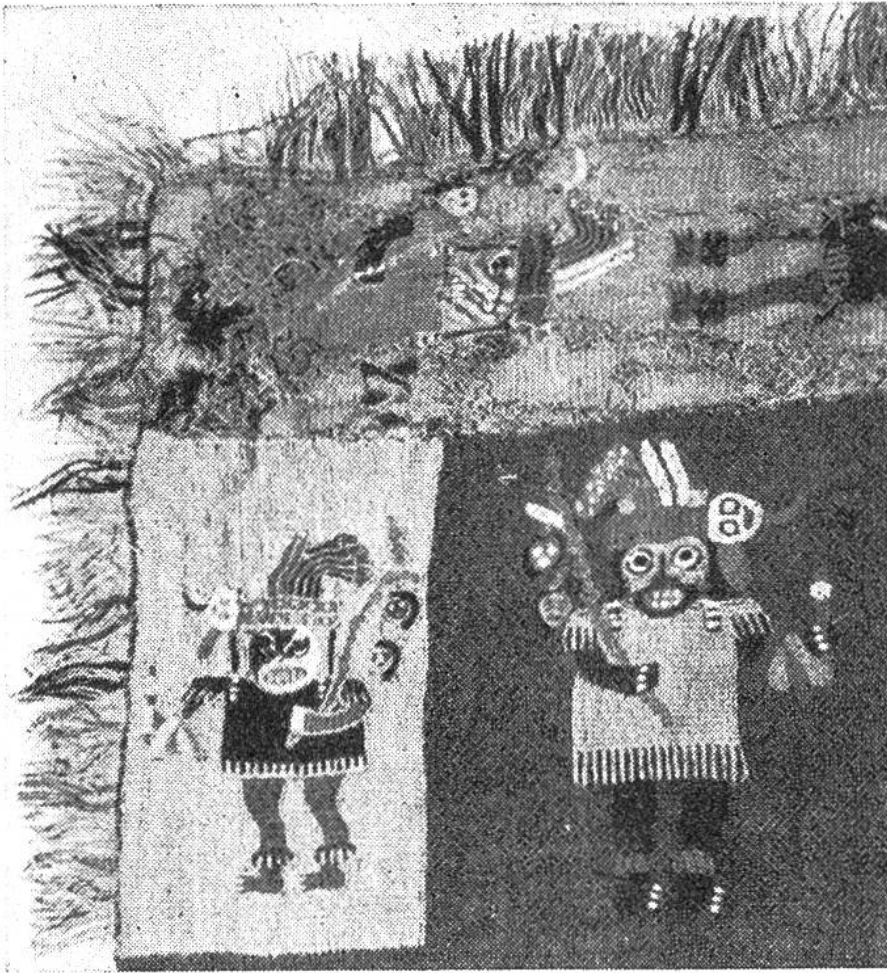
Teilstück eines wiederherge- stellten Mantels. Bunte Wirkerei mit menschi- chen Figuren (sa- genhafte Gestalten, welche Köpfe und Speere als Siegeszeichen tragen).

Mitteln nicht übertroffen werden. Unerreicht sind aber die peruanischen Stoffe vor allem in ihren Verzierungen, ob diese nun gewoben, gewirkt oder gestickt sind. Häufig sind Figuren dargestellt, Menschen, Katzen, Vögel aller Art. Oft hat man sie so stark stilisiert, dass sie kaum noch erkennbar sind. Sie leiten dann zu reinen Ornamenten über. Hier wie dort kommen künstlerische Fähigkeiten zum Ausdruck, die wie die rein handwerkliche Arbeit einmalige, sonst nirgends erreichte Leistungen darstellen.