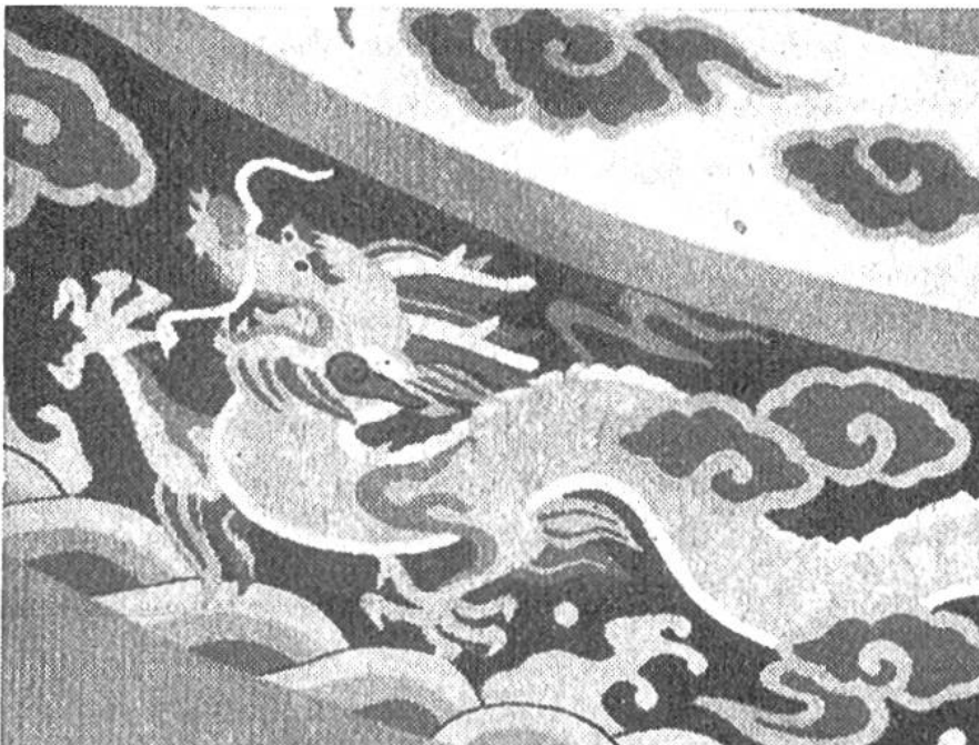
Vielfarbiger japanischer Seidenbrokat mit Drachenmotiv.

und nicht zerreißen. Die japanische Weberin ist Meisterin ihres Faches. Sie schafft Kunstwerke, die in Feinheit der Ausführung und künstlerischer Vollendung der Muster zu den Spitzenleistungen der Weberei gehören. A. Bühler