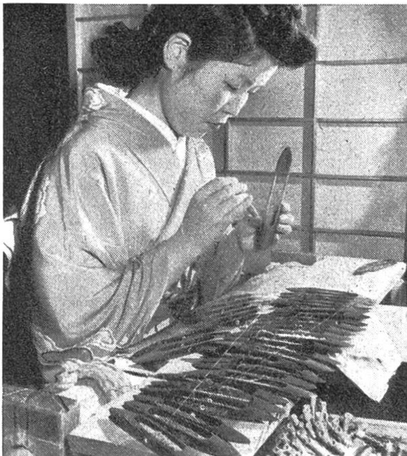
Die Weberin setzt eine Spule mit Seidenfaden im Schiffchen ein. Auf dem Brett weitere Schiffchen.

Hand angefertigt. Auf dem Brett, das dicht vor der Arbeiterin liegt, ist unter der darüber laufenden Kette eine farbig ausgemalte Vorlage ausgebreitet. Für jeden darin vorkommenden Farbton muss die Weberin zunächst einen genau gleich gefärbten, aufgespulten Seidenfaden in einem Weberschiffchen bereitlegen. Sie benötigt oft Dutzende von solchen Schiffchen. Mit deren Hilfe trägt sie die entsprechenden Fäden genau so weit in die Kette ein, wie es die Vorlage erfordert. Sie zieht zu diesem Zweck jeden zweiten Kettfaden mit den Fingernägeln in die Höhe und schiebt das Schiffchen mit der Spitze voran durch den Zwischenraum. Sie führt also die Webarbeit von Hand aus, die sonst mechanisch erfolgt. Ständig werden dabei die Schiffchen den verschiedenen Farben entsprechend gewechselt. So entsteht langsam das Muster. Einfach scheint eine solche Arbeit zu sein; man kann sich aber kaum vorstellen, wieviel Geduld und Mühe dazu nötig ist, was für geschickte Hände es braucht, damit die Fäden ohne Fehler mit dem Schiffchen gekreuzt werden