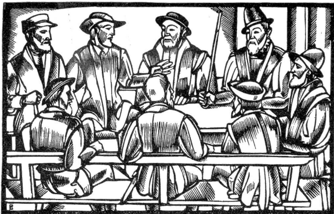
Gerichtssitzung im 16. Jahrhundert.