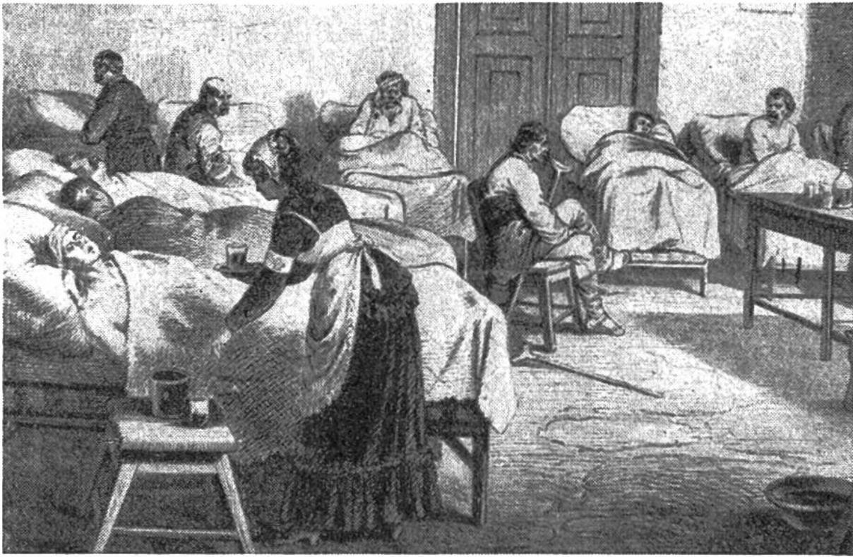
Englisches Kriegsspital in Belgrad 1877. Freiwillige des Roten Kreuzes, Frauen und Männer, pflegen und laben Kriegsverwundete.