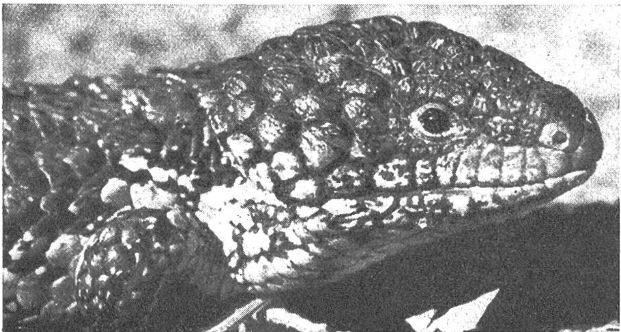
Kopf der Tannzapfen-Echse.

Die australische Tannzapfen- oder Stutz-Echse gehört in den Zoologischen Gärten zu den begehrtesten Schaustücken der Terrarien. Die Beschuppung des seltsamen Kriechtieres ist deswegen einzigartig, weil sie, wie der Name andeutet, der