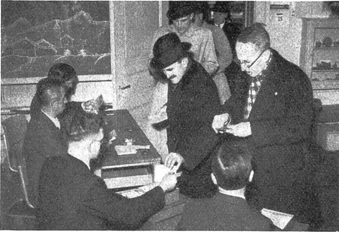
Gefaltet wird der Stimmzettel in die Urne gelegt.

umstrittenen Tabakvorlage und zur Preiskontrolle; er hatte zu entscheiden über Schulhausbauten, über Erweiterung des Friedhofs, über den Umbau der Stadtbibliothek. Soll die Umsatzsteuer abgeschafft werden? Ist für die Rüstungsauslagen ein Vermögensopfer oder eine andere Steuer zu erheben? Sind in den Häusern Luftschutzkeller zu erstellen? Wollen wir den industriellen Unternehmen vorschreiben, dass sie Reserven für die schlechten Zeiten anlegen?