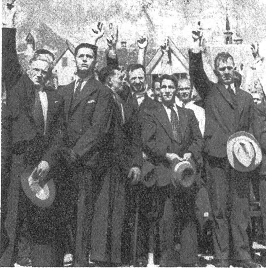
Das offene Mehr an der Landsgemeinde.

keit verpflichten. Der Bürger kann also unabhängig und frei seine wahre Meinung ausdrücken. Seine Stimme wird garantiert richtig gezählt. Das sind heutzutage keine Selbstverständlichkeiten, da es erfahrungsgemäss politische Regime gibt, in denen die Demokratie nur ein leeres Wort ist, in Wirklichkeit aber eine Partei befiehlt und man schon vor den sogenannten Abstimmungen weiss, dass das „Volk“ mit einer Mehrheit von 100% zustimmen wird!