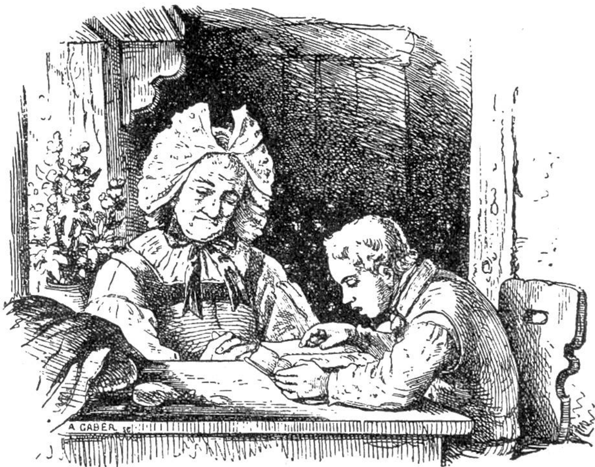
Illustration von Ludwig Richter (Dresden, 1803–1884) zu „Der Besenbinder von Rychiswyl“.