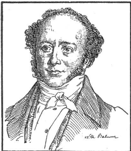
JEREMIAS GOTTHELF (100. Todestag am 22. Oktober)

* 4. Oktober 1797 in Murten, † 22. Oktober 1854 in Lützel-flüh.