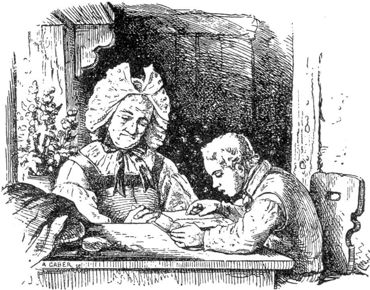
Illustration von Ludwig Richter (Dresden, 1803–1884) zu „Der Besenbinder von Rychiswyl“.