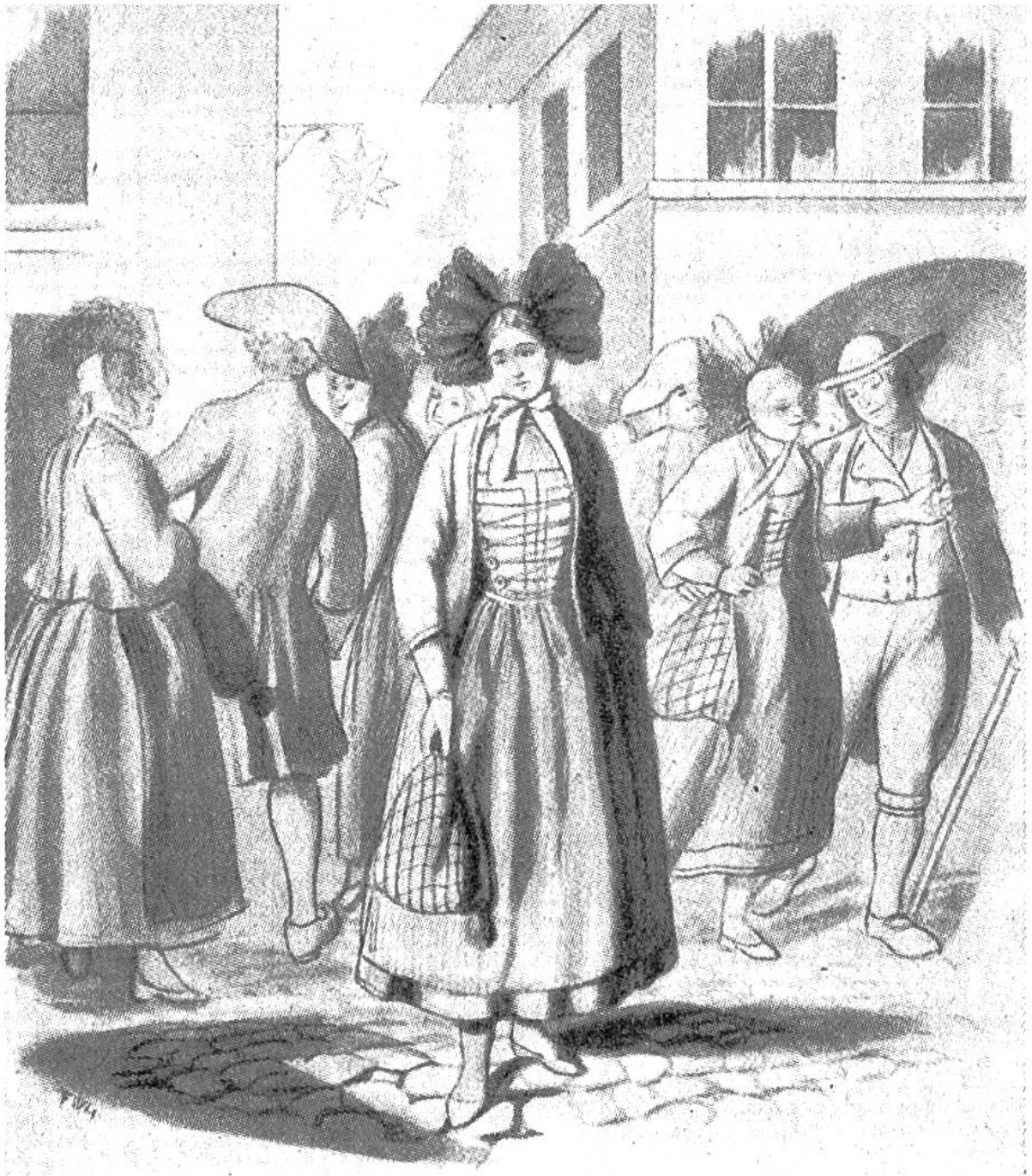
Am Markttage. Illustration von Friedrich Walthard zu „Elsi, die seltsame Magd“.