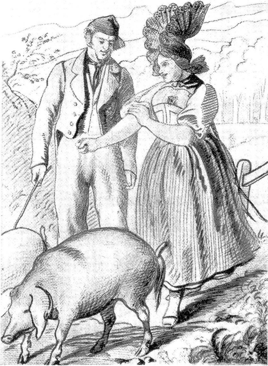
Käthi und Uli auf der Heimkehr vom Markt. Illustration von Friedrich Walthard zu „Uli, der Knecht“.