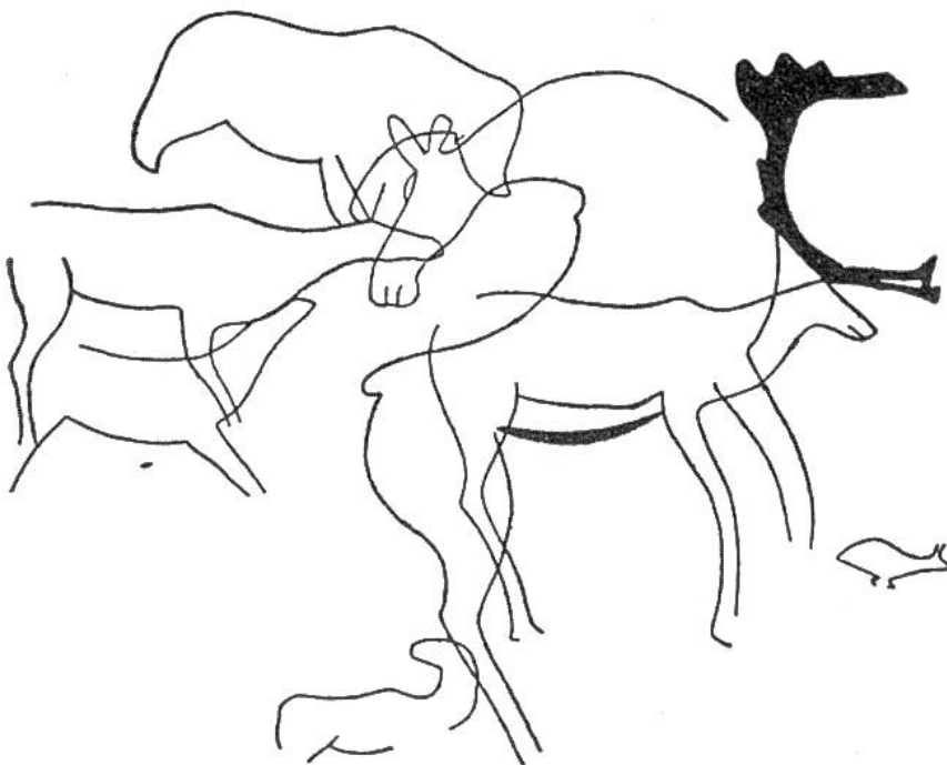
Rentiere, Bär (oben Mitte) und Elch mit rückwärts gewand- tem Kopf. Gleicher Fundort.

Die skandinavischen Felsbilder sind in der Mehrzahl nicht in tiefen Höhlen angebracht, sondern an offen daliegenden horizontalen oder vertikalen Felsflächen; oft befinden sie sich unmittelbar am Rande von Fjorden oder anderen Gewässern. Zur Hauptsache handelt es sich um Gravierungen, das sind Einritzungen, doch kommen daneben auch Malereien vor. Überraschend ist die zum Teil sehr beträchtliche Grösse der Darstellungen, bilden doch Tierfiguren von mehreren Metern