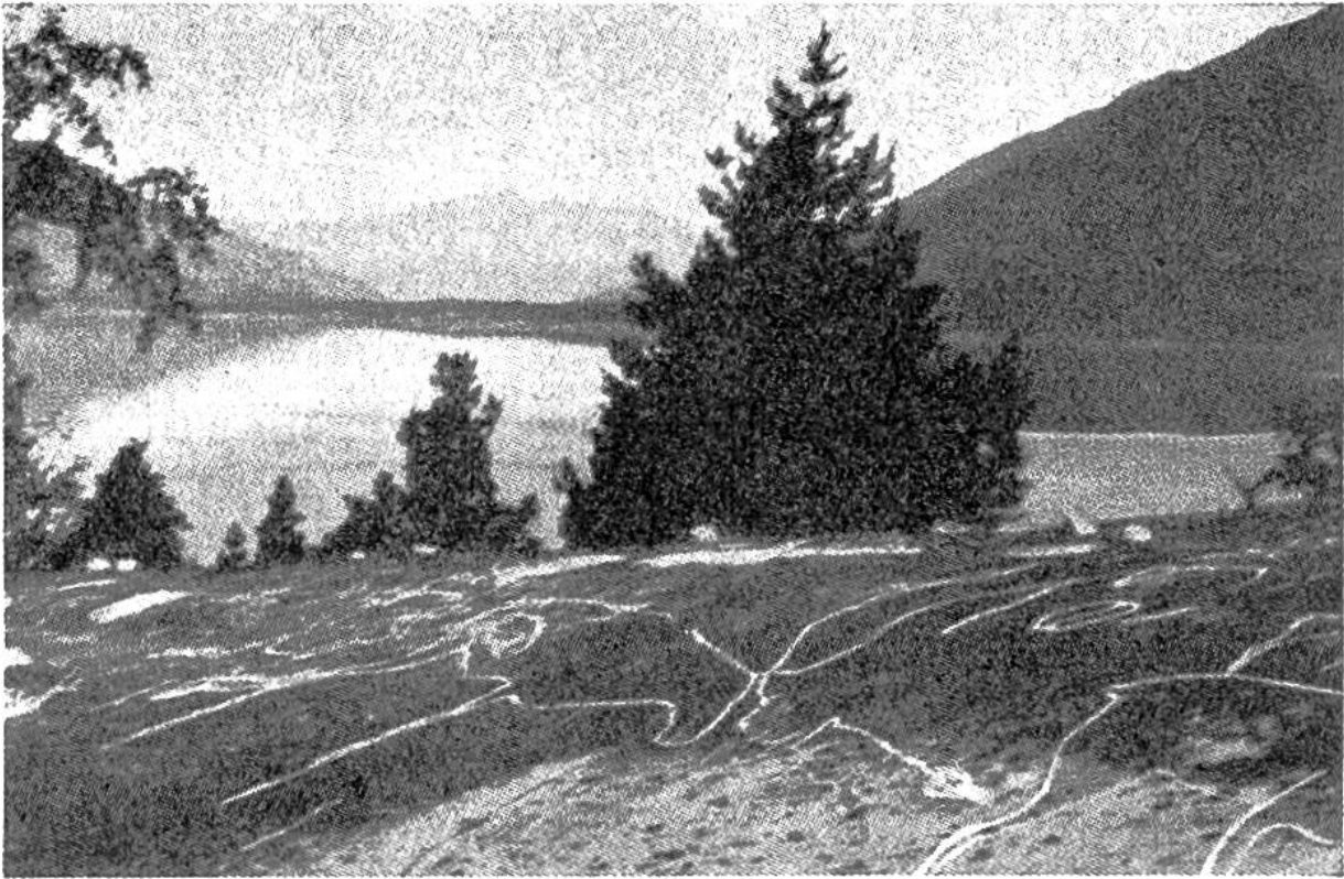
Rentierzeichnungen auf horizontaler Felsfläche in Forselv, Provinz Nordland, Nordnorwegen.