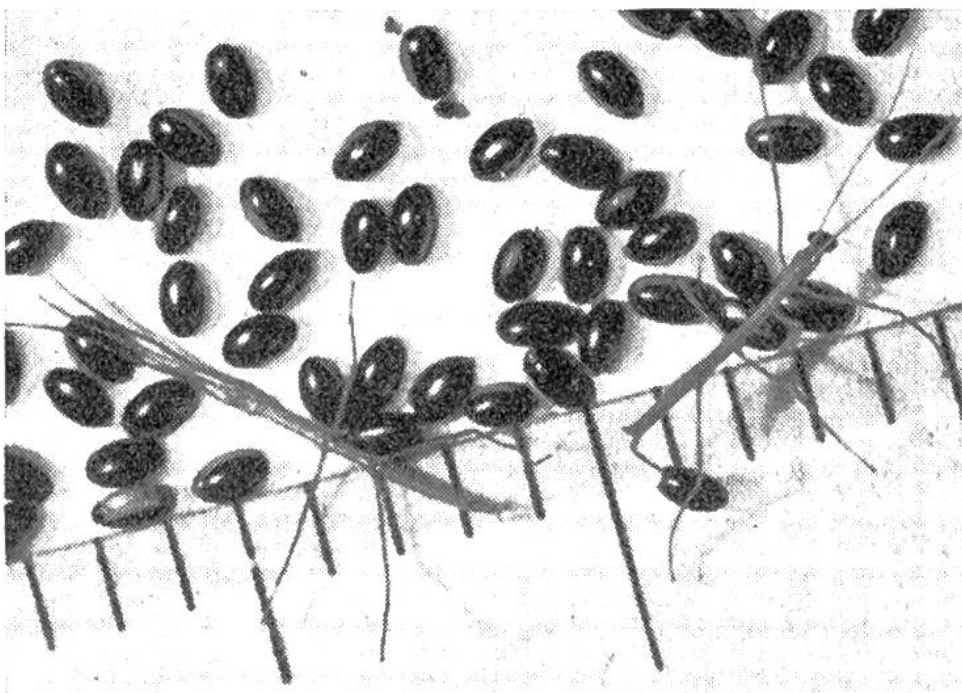
Frischgeschlüpfte Stabheuschrecken mit den pflanzen-samenähnlichen Eiern.

Im Mittelmeergebiet und erst recht in den Tropen finden sich in den immergrünen Gebüsch- und Baumbeständen Insekten