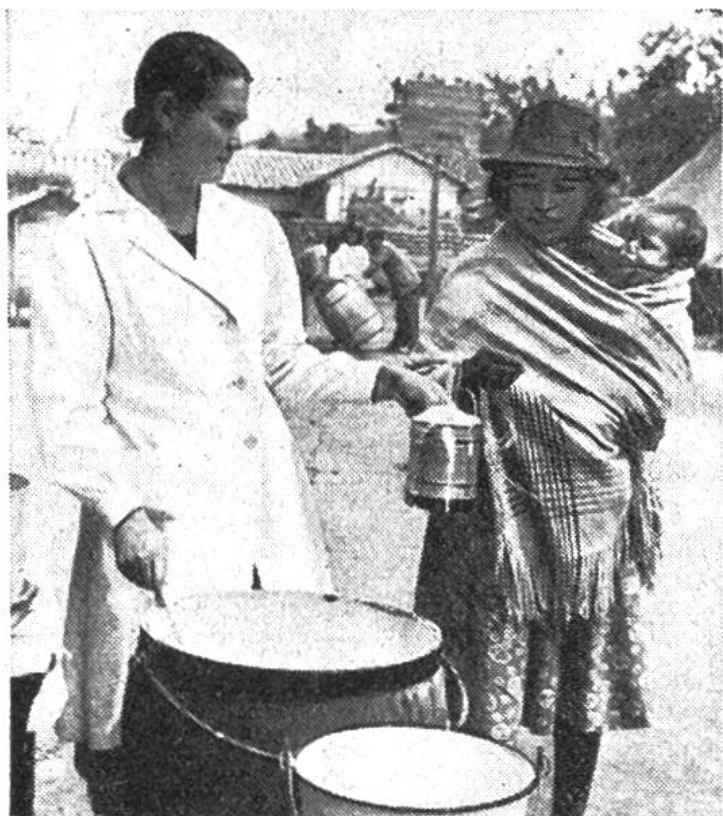
Auch in Equador wird von der Unicef Milch verteilt.