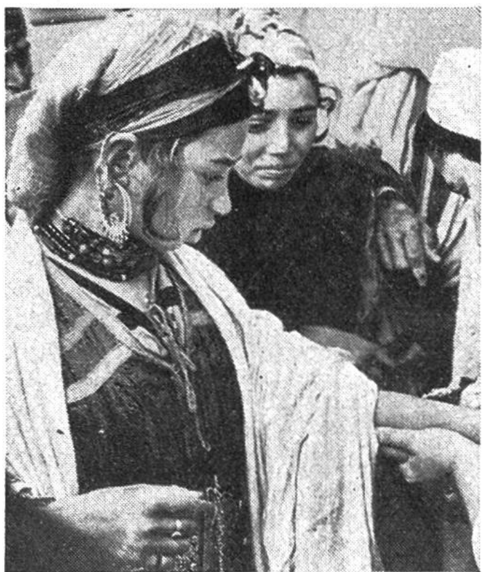
O b e n sucht eine jugoslawische Mutter bei einer Unicef-Kinderschwestern Rat. U n t e n wird eine junge Algerierin gegen Tuberkulose geimpft.

Erde zerstreuten Länder entgegen. In 14 europäischen, 18 asiatischen, 18 südamerikanischen und 11 Ländern des Nahen Ostens wurden Millionen und Millionen Franken ausgegeben – auch die Schweiz hat bei den Spenden wesentlich mitgeholfen –, um den bedürftigen Kindern zu helfen. Doch auch die Zahl der zu betreuenden Kinder geht in die Millionen!