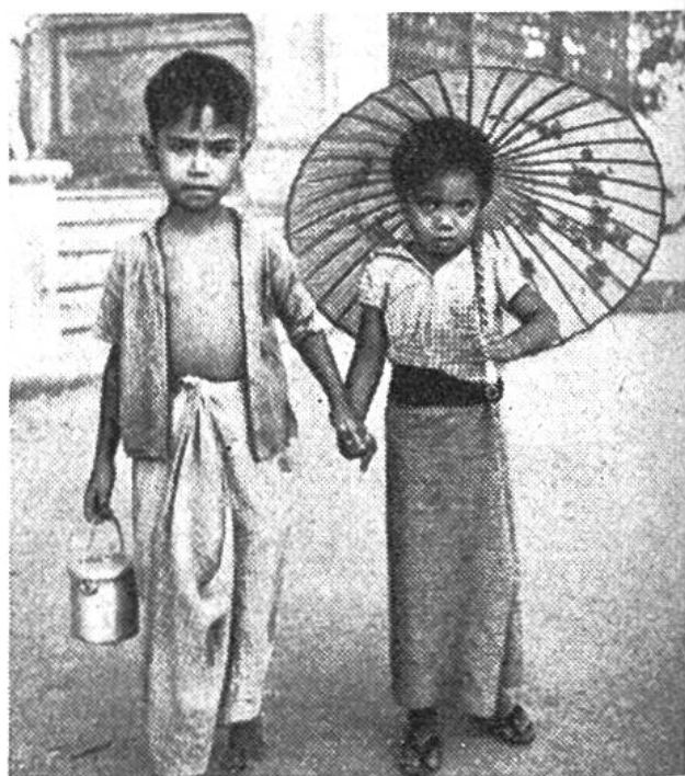
Ein burmesisches Geschwisterpaar holt seine Milchration ab.

den Nationen durch Unterstützung der Informations- und Pressedienste; Förderung des Elementarunterrichtes und der Verbreitung der Kultur im allgemeinen; Mithilfe zur Erhaltung, Weiterentwicklung und Verbreitung des Wissens.