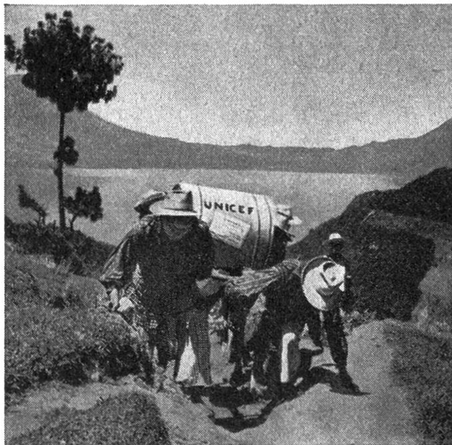
An steilem Berg- hang und unter südlich heisser Sonne wird Milch für die Kinder Guate- malasbefördert.