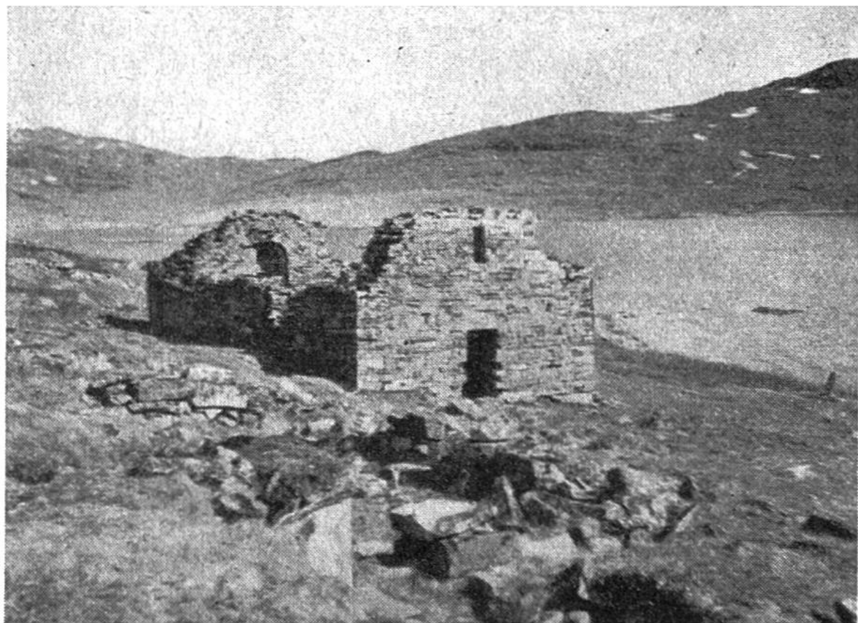
Ruine der normannischen Hvalseyjar-Kirche beim heutigen Qaqortoq.