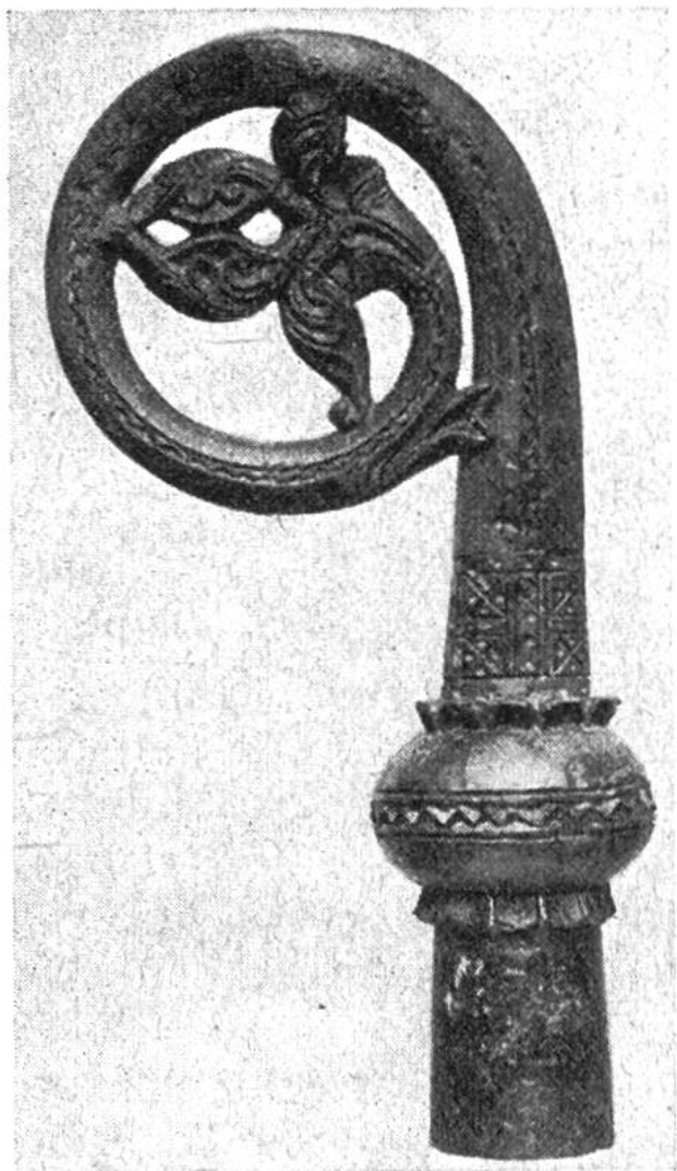
Reich geschnitzter Bischofsstab aus Walrosselfenbein von Gardar, dem Sitz der normannischen Bischöfe auf Grönland.

tauscht wurden. Immerhin waren die Kolonisten bemüht, möglichst weitgehend selbst für die Deckung ihrer Bedürfnisse aufzukommen: sie verstanden es, Sumpferz zu gewinnen und zu verarbeiten, aus Schafwolle Stoffe für Kleider zu weben und aus Speckstein, Treibholz, Walbarten, Elfenbein, Rentiergeweih und Knochen alle möglichen Gegenstände herzustellen. Sie führten auch grosse Entdeckungsreisen durch, die bis nach Nordamerika (Vinland) hinüberführten.