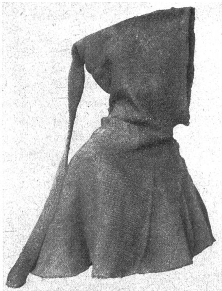
Gewobene Männerkapuze aus einem Grab des Normannenfriedhofs von Herjúlfsnes in Südwestgrönland.

schen mit ihrem Hab und Gut und ihrem Vieh befanden. Die Besiedelung der neuen Kolonie scheint nach aristokratischen Grundsätzen vor sich gegangen zu sein, indem die einflussreichen Männer die günstigsten Fjorde unter sich aufteilten und den übrigen Einwanderern Erlaubnis gaben, sich in ihrem Gebiet anzusiedeln. Insgesamt wurden von den Normannen in Südwestgrönland mindestens 280 Bauernhöfe errichtet, die sich zur Hauptsache