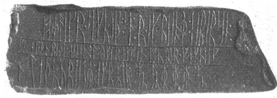
Runenstein, der weit im Norden der Westküste (73. Breitengrad) gefunden worden ist und einen Beweis für die aus-

auf zwei grosse Bezirke verteilten, auf das nördlichere „Vestribygt“ (heute Julianehaab) und das etwas weiter im Süden gelegene „Eystribygt“ (heute Godthaab). Anfänglich war die Kolonie frei und unabhängig. Alljährlich versammelten sich die Bewohner der beiden Siedelungen zu einem „Althing“, wo gemeinsame Fragen behandelt und Rechtshändel abgeklärt