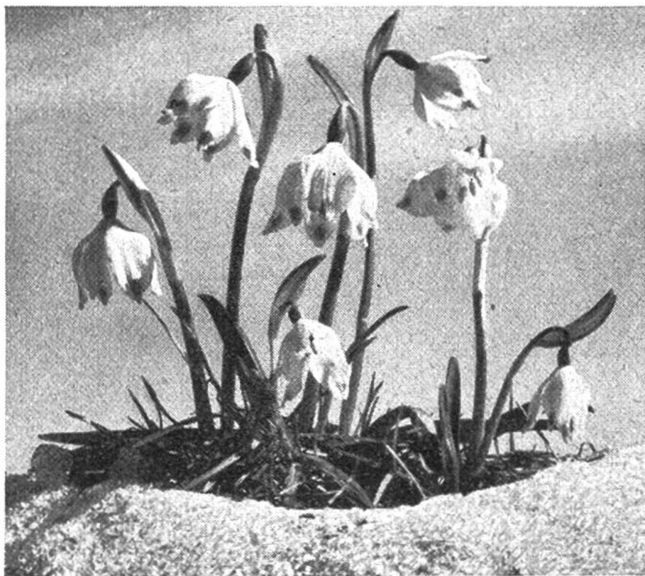
Die ersten Frühlingsboten brechen aus dem Schnee hervor.

und Schneemassen den Weg ins Licht. Die verzauberte Nacht des Winters weicht dem farbenfrohen Morgen des Frühlings: